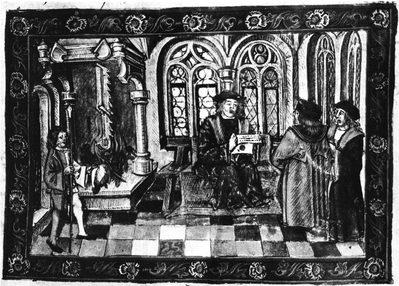
Abb. 3 Diebold Schilling, Luzerner Bilderchronik, 1513, Folio 135. Der Herzog von Mailand liest das Schreiben der Luzerner 1478 (Hahlkesselhaken im Kamin)

Geldes statt gebraucht wurde, der Name Obelos ging auf das Geldstück über, und mit einer Drachme war das Äquivalent der Anzahl Spieße bezeichnet, die man mit einer Hand umfassen konnte. (Im Französischen wird der Bratspieß «haste» genannt, nach der römischen Lanze.) Das Braten mit dem Spieß war eine langweilige Angelegenheit, weil der Spieß ständig gedreht werden mußte. Man konnte einen armen Knaben zum Spießdrehen anstellen, dem man dann den Bräterlohn bezahlte 49 , lief aber Gefahr, daß er nicht immer aufpaßte und die besten Stücke verbrennen ließ. Darum wurden eine Menge Systeme für automatische Bratenwender ausgedacht. Selbst Leonardo da Vinci hat Zeichnungen für zwei solche Maschinen hinterlassen, wovon die eine vielleicht die wirklich ideale Lösung darstellt: Im Rauchfang ist eine Art Propeller angebracht und durch Zahnrad mit der Welle des oder der Bratspieße verbunden; durch die heiße Luft angetrieben setzt sich der Propeller in Bewegung und treibt den Bratspieß um – und zwar je nach Größe des Feuers schneller oder langsamer 50 . In Bern wurde der