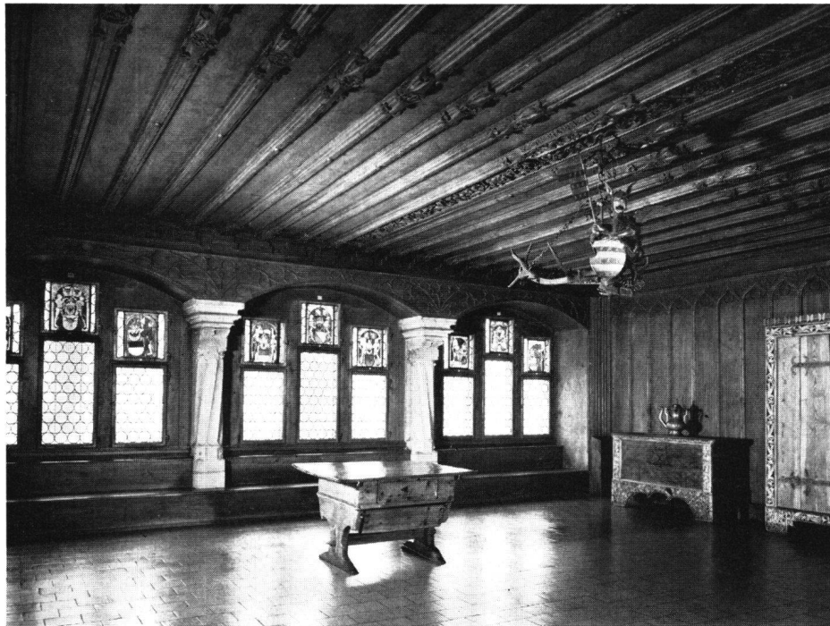
Abb. 6 Die alte Ratstube von Mellingen. Schweizerisches Landesmuseum Zürich