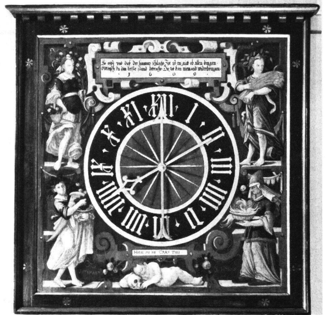
Abb. 5 Uhrenzifferblatt. Malerei auf Holz (111 × 108,5 cm). In den Eckzwickeln die vier allegorischen Gestalten «VER, AESTAS, AVTVMNVS, HYEMS». Rollwerkkartusche mit Aufschrift: «So offit und dick der hammer schlacht. Zyt ist ein gütt ob allen dingen / O Mensch du din letzte stund betracht. Die zyt kan niemand widerbringen. / 1609». Signatur «IVAE» = Jakob von Aegeri. Dieses Zifferblatt wird wohl in den Inventaren als «zeig uhr» bezeichnet, es befindet sich heute im Badener Heimatmuseum

Handel zurückgekauften Zinnkannen mit dem Badener Wappen, wovon nun die eine im Badener Museum, die