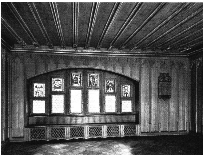
Abb. 2 Rathaus Baden. Tagsatzungssaal gegen Westen; in den Inventaren «der Eidgnossen Stuben» genannt

Schon ein kurzer Überblick über den in den Inventaren aufgezählten Bestand zeigt, daß der Ausdruck «Hausrat» dafür wirklich seine Berechtigung hat; außer der Schlafzimmereinrichtung fehlt kaum ein wesentlicher Bestandteil eines Privathaushaltes. Besonders eindrucksvoll ist die Anzahl und Vielfalt der Küchengeräte . Sie seien einzeln etwas näher betrachtet.