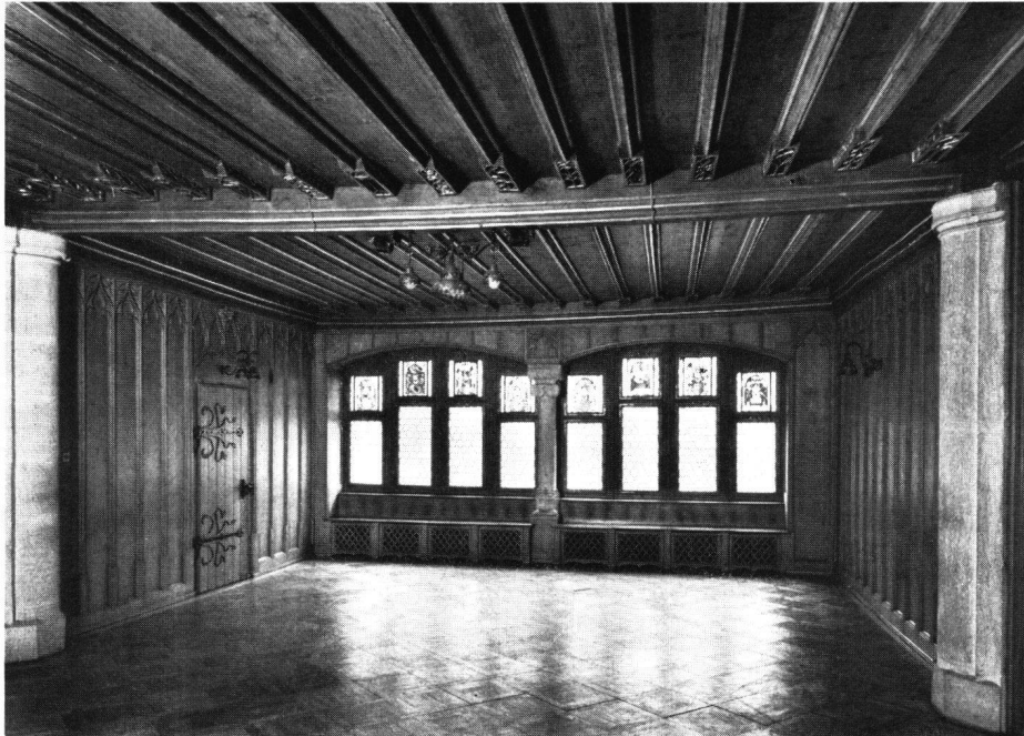
Abb. 1 Rathaus Baden. Tagsatzungssaal gegen Osten (Vertäferungen 20.Jh.)