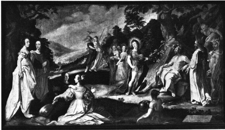
Abb. 4 Urteil des Midas . Öl auf Leinwand (122 × 224 cm). Tituliert, signiert und datiert «IVDICIVM MIDAE HG inv: RS pxt 1646», gemalt von Raffael Sadeler nach einem Stich von H. Glotzius aus dem Jahre 1590. Dieses Gemälde hing den Inventaren zufolge in der Ratstube, heute ist es im Badener Heimatmuseum

Becken, wie sie vor allem in Frankreich herumgereicht wurden zum Händewaschen. Aufbewahrt wurde das Zinngeschirr in einem «mit eisen beschlagenen kasten» auf der Laube oder im Saal. Häufig aber stoßen wir auf Vermerke, daß Stücke – die entweder schadhaft oder altmodisch geworden waren – eingeschmolzen wurden zu neuen.