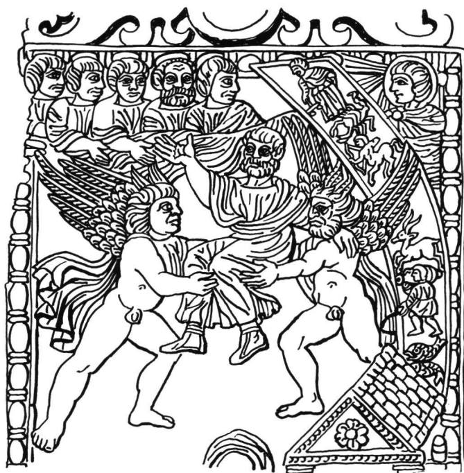
Abb. 3 Apotheose eines römischen Kaisers (nach British Museum, Ivory cat. no. 7)