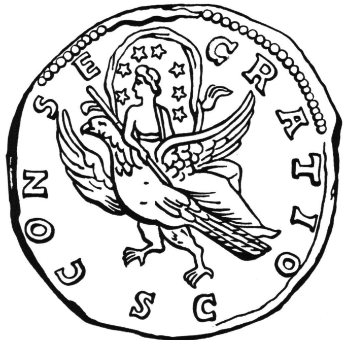
Abb. 2 Apotheose der Faustina auf römischer Münze (nach Daremberg-Saglio)