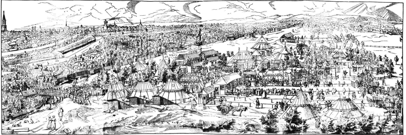
Abb. 2 Holzschnitt mit der Darstellung des Schützenfests von Straßburg 1576. Nach dem Faksimile von August Schricker, 1880. Zentralbibliothek Zürich, Graphische Sammlung

Agentliche Verzairnus des beramten Straßburgischen Haupt schießens mit dem Stachel oder Kumpff die gegenwärtige 1576 Jar. von dem römischen Kaiser bis auf den heutigen Tag samt dem Haupt schießen / also glücklich vollbracht und gendet / und nun gegen- wärtig geistlich mit dem römischen Kaiser / durch den Kaiserlichen Statthalter in Straßburg zu thun / einen Schießens Statthalter mit der höchsten Ehrenwürde und höchsten Statthalter Schießens.