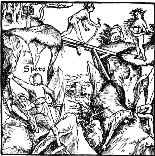
Fig. 5 Gravure illustrant: P.Olearius, De fide concubinarum , Bâle, entre 1501 et 1505

la vertu, tandis que l'autre s'avance les yeux bandés sur un pont vermoulu pour rejoindre l'allégorie du vice qui joue de la musique. Un cadavre au fond du précipice indique le danger qu'il court. Baldung reprit l'idée, en condensant le personnage et l'allégorie, car sa Prudence, avant de voir