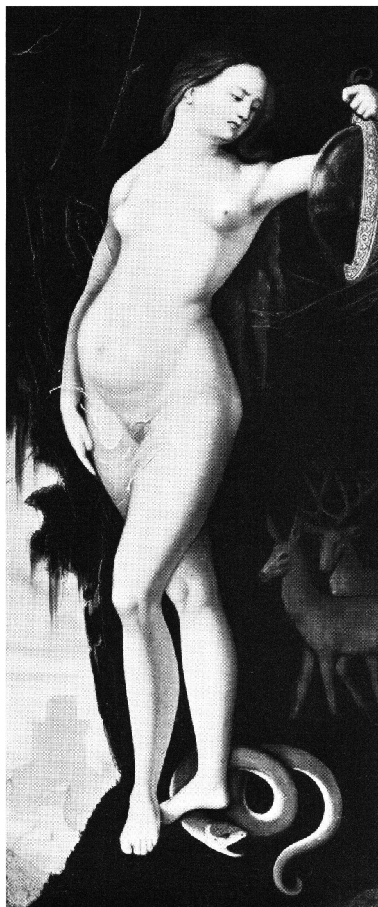
Fig. 2 Hans Baldung, La Prudence , 1529, Munich, Alte Pinakothek