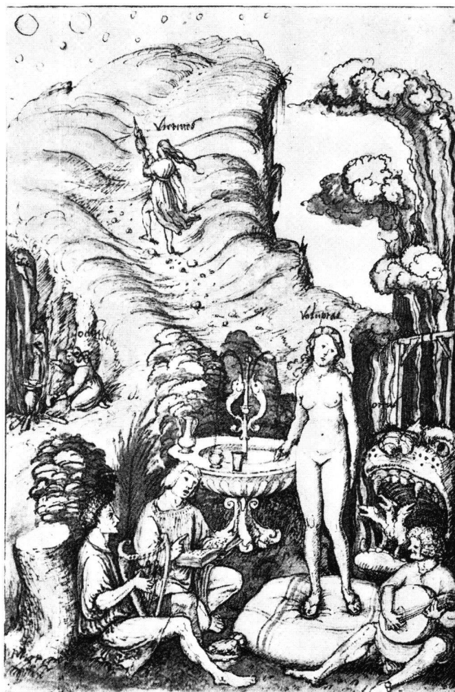
Fig. 4 P.Vischer le Jeune, Virtus et Voluptas , dessin, Berlin-Dahlem, Kupferstichkabinett

Or, il existe un thème iconographique montrant deux allégories chacune de part et d'autre d'une vallée, celui du