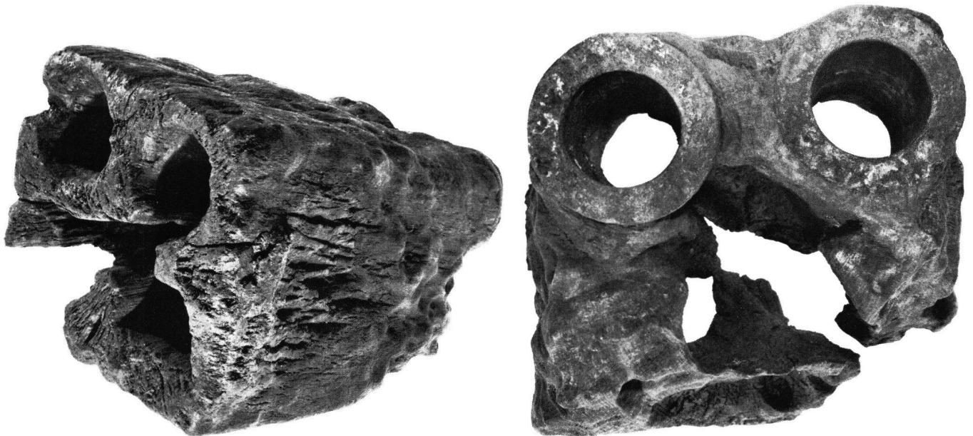
Abb. 38 Lyon (Département Rhône, Frankreich), «Rue Victor-Hugo / Rue Sainte-Hélène». Notgrabung 1975. Gallo-römisch (wahrscheinlich 2. Jh. n. Chr.). Pumpenstück aus Eichenstamm mit zwei eingelassenen Bronzemanschetten, aus einem Schacht. Styren-Strahlenpolymerisation 1977. Breite des Objekts 35 cm.

La pénétration des produits d'imprégnation sans limita-