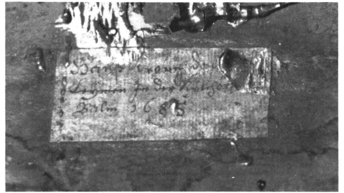
Abb. 2 Detail von Abb. 1. Originaler handschriftlicher Zettel: «Haß Krouchda[ler uf] / Leymen In der Kilchhöri Ober / Balm 1685.» Vor der Restaurierung.

MANN einer Schule zu, der ein Jakob Joseph Meyer (1670 in Geroldshoffstetten bei Grafenhausen), Franz Straub (1668–1696 nachweisbar, aus Friedenweiler bei Neustadt), beide im Schwarzwald, und möglicherweise andere vergessene Geigenbauer angehören; auf sie weisen verwandte Instrumente aus dem 17. Jahrhundert im alemannischen Raum. Das Bassett des Landesmuseums rückt mit seinem schlanken Ober- und Mittelteil sowie dem zarten Ornament in die Nähe des späteren, reich verzierten Bassetts von 1696 im Bernischen Historischen Museum, dessen Hals und Griffbrett ebenfalls ergänzt sind und das wohl einmal abgelautet und neu lackiert worden ist.