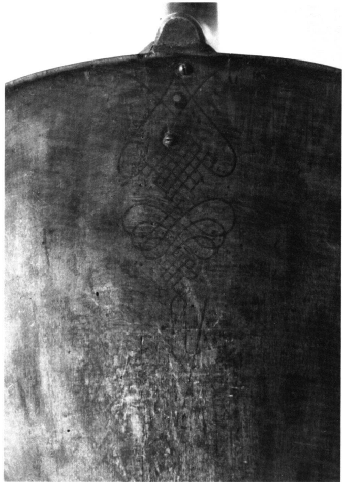
Abb. 4 Detail von Abb. 1. Intarsienornament im Boden. Vor der Restaurierung.

eingepaßt werden mußte. Weit offene Risse wurden mit Spänen gefüllt und ebenfalls durch Taqués verstärkt. Drei Ecken mußten auch am Boden ersetzt werden. Der mehrfach gerissene Oberklotz wurde geleimt. Die störenden Schrauben im Boden sind entfernt und die Löcher mit Holzapfen ausgefüllt worden. Fehlende Einlagen im Ornament mußten ersetzt werden.