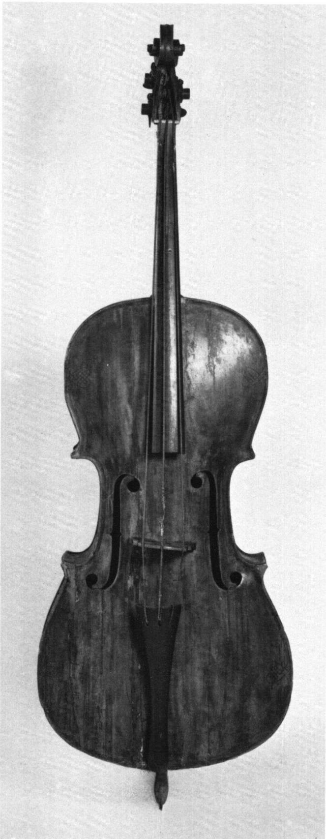
Abb. 3 Bassett wie Abb. 1. Vor der Restaurierung.