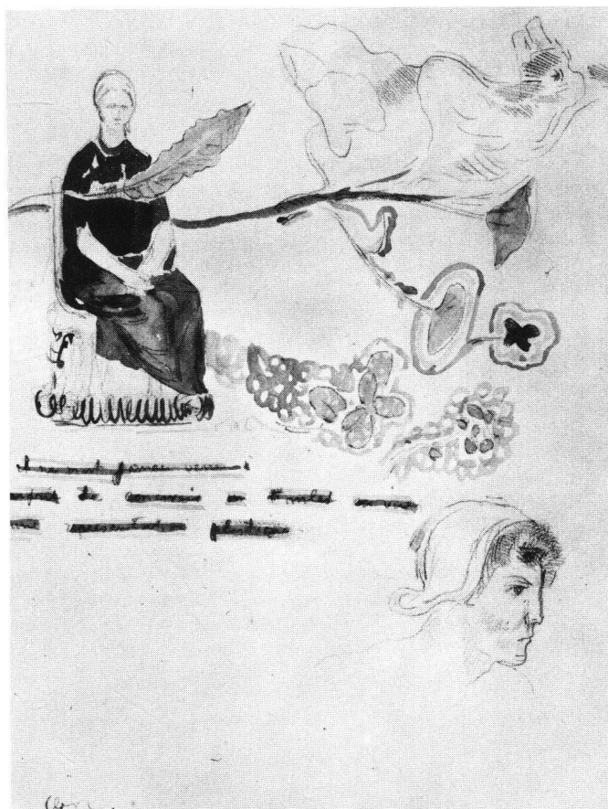
Fig. 4 Odilon Redon: Pensée sur Hamlet , vers 1910, crayon et aquarelle, 23,5×18 cm, collection privée; inscription: «il ne m'est jamais venu à l'esprit de concevoir un Hamlet en vue d'une représentation plastique».

J'en arrive tout naturellement à ma seconde conclusion. J'ai essayé de montrer que la définition des objets que nous examinons (la critique d'art, l'histoire de l'art, la science de l'art) et