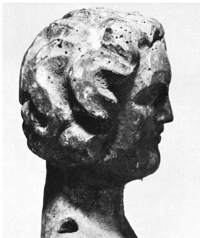
Abb. 4 Kopf des Engels im Profil.

Die Figur ist merklich nach links gekrümmt, wobei das Haupt die Krümmung noch betont; zugleich ist der Körper auch sanft nach hinten gebogen. Im rundlichen Haupt, das auf breitem Hals sitzt, scheinen Mund, Nase und Augen störend eng zusammengedrückt (Abb. 3). Das Haupthaar ist entlang der Schläfe und den Wangen in einer damals verbreiteten Art 9 frisiert; ein «Lockenmäander» zeichnet die modische Ohrlocke (des frühen 14. Jahrhunderts) zwar deutlich, lässt sie aber nicht als beherrschendes Motiv hervortreten (Abb. 3+4). Nach der Stellung der Arme zu schliessen, könnte der Engel eine Ampel oder ein Weihrauchfass getragen haben. Der Mantel bzw. der Überwurf ist um den rechten Oberarm geschlungen; an der linken Körperseite wird er hochgezogen, so dass er die Schulter