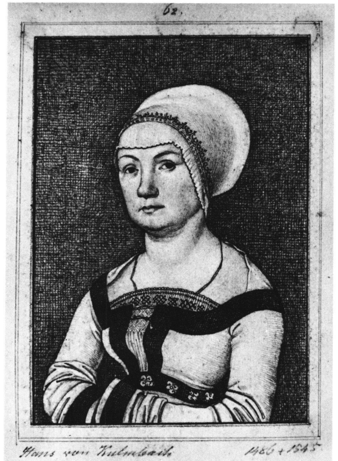
Abb. 2 und 3 Peter Decker (1823–1876), Nachzeichnungen nach den Bildnissen von Jörg Fischer und seiner Gattin von Hans Holbein d. Ä. Bleistift auf Papier, je ca. 21 x 15 cm. Privatbesitz Köln.

Wer möchte nicht, wenn er ein eindringliches Bildnis sieht, gern wissen, wen ihm der Maler vor Augen gestellt hat? Denn nur einen bestimmten Aspekt des ganzen Menschen kann uns dieser zeigen, und wie jeder etwas anderes und anderes wiederum nicht sichtbar macht, darüber könnte wohl eine ganze Geschichte des Porträts geschrieben werden. Uns genügt es aber für jetzt zu sehen, dass es offensichtlich Bildnisse gibt, die besonders ansprechen, deren Figuren uns quasi bekannt vorkommen, und so ergeht es uns auch mit Holbeins Bild einer 34jährigen Frau in der Basler Sammlung (Abb. 1). Schwierig zu sagen, woran dies jeweils liegen mag, hier vielleicht an der nicht zu weit getriebenen äusseren Individualisierung der Züge, vielleicht an einer von aller Routine und Repräsentation freien Unmittelbarkeit, die durch eine gewisse Scheu im Ausdruck – sowohl des Malers als auch des Modells – und die strenge, aber doch etwas labile Komposition zurückgenommen wird. Wie der Maler solches erreichte, werden wir noch näher fassen können, wenn wir den Werdegang des Bildes und seine Stellung im Gesamtwerk des Künstlers bedenken; zunächst wenden wir uns aber der Identifikation zu.