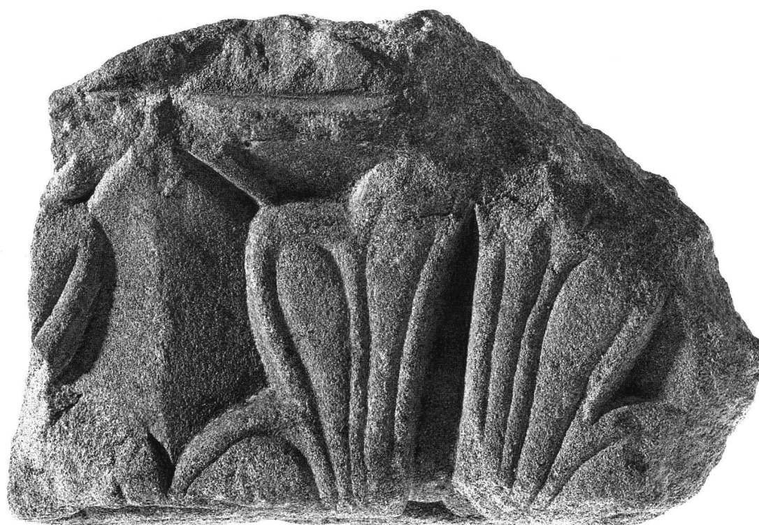
Fig. 1 Fragment sculpté en molasse, peut-être trabes d'une clôture de chœur, trouvé à Lausanne, rue Vuillermet n° 6, vue de face.

La face principale représente une feuille, traitée schématiquement, aux extrémités presque pointues et vraisemblablement au nombre de cinq à l'origine. On remarque à gauche l'amorce d'une deuxième feuille, semblable. La forme et l'articulation renvoient au modèle de la feuille d'acanthe chère à l'art antique, bien qu'on en ait modifié la structure organique et le dessin classique, réduits à une stricte frontalité et à un relief aplati. Trois des pointes de la