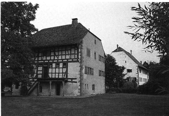
Abb.1 Stäfa/ZH, Ürikon, Ritterhäuser. Spätmittelalterlicher Ammannersitz mit zwei neuerbauten Herrenhäusern von 1492 (sog. Burgstall, rechts) und 1535 (sog. Ritterhaus, links), sowie einer älteren Hofkapelle.

Wenn wir Stekls Argumentation zum Schloss des 19. Jahrhunderts als Machtsymbol allgemeiner fassen und auf den aristokratischen Herrschaftsbau ganz allgemein übertragen, so trifft es auch hier zu, dass die traditionell kunstgeschichtliche Thematik zwingend mit spezifisch geistesgeschichtlichen, sozialökonomischen und konstitutiv-politischen Aspekten zu erweitern ist, ohne welche die Bedeutungsebene der Schlossarchitektur nur ungenügend erschlossen werden kann. 1 Stekl beschreibt den Schlossbau als Resultat eines breiten Spektrums von Beweggründen, welche bei den einzelnen Anlagen in wechselseitiger Verflechtung jeweils unterschiedliches Gewicht besaßen.