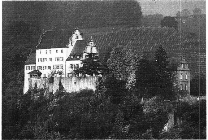
Abb. 8 Oberflachs/AG, Schloss Kasteln. Durch General Johann Ludwig von Erlach um 1650 zum frühbarocken Gerichtsherrenschloss umgebaute Hügelsburg (1642–50).

beim feststehenden nachgotischen Formenkanon, ja dieser wurde weit ins 17. Jahrhundert hinein weiter benutzt. 24 Ein zweigeschossiger Mauer- oder Fachwerkbau mit Schopfwalm (Gehrschild) oder Treppengiebel, flankiert von einem Wendelstein (Treppenturm) an der Traufe, verkörpert diesen Typus.