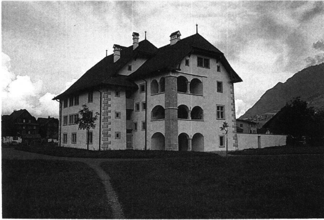
Abb.5 Stans/NW, Winkelriedhaus. Repräsentativer Wohnsitz, der um 1600 durch Ritter Johann Melchior Lussy aus älterem Kern erweitert und umgestaltet wurde.