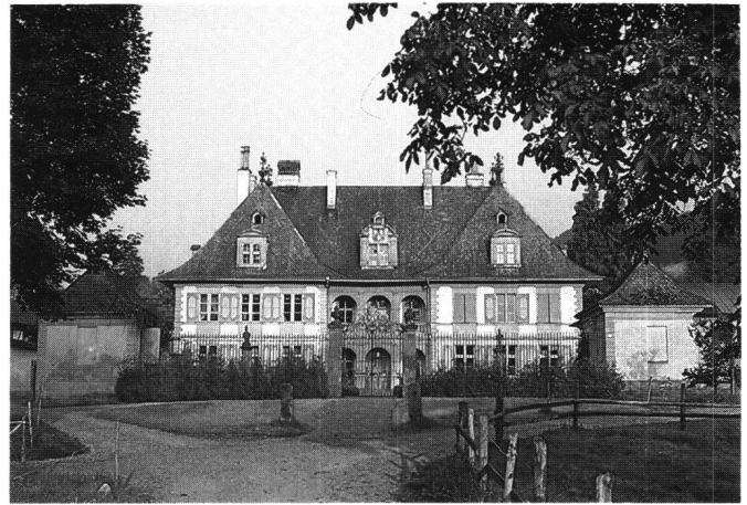
Abb. 9 Oberdiessbach/BE, Schloss. Herrschaftssitz in der Tradition des oberitalienischen Villenbaus mit offener Mittelloggia, jedoch in feiner französischer Durchbildung.

Im vorstädtischen Sommersitz La Poya bei Freiburg zeigt sich der originelle Versuch, das allgegenwärtige palladianische Vorbild der «Villa als Herrschaftsarchitektur» zu rezipieren. Hier, wo die Bausituation hoch über dem Flusslauf mit freiem Blick über die Stadt zu den fernliegenden Bergen geradezu dem klassischen italienischen Landsitzideal der Villa suburbana entspricht, hat das Palladio-Zitat einen besonderen Sinngehalt. Corboz spricht denn auch mit dem Hinweis auf Lord Burlington ein Entstehungsmerkmal von La Poya an: der aristokratische Bauherr Schultheiss Franz Philip von Lanthen-Heid als gebildeter Architekturkenner und -liebhaber. 26 Allerdings liegen auch hier die Planungsstände im dunkeln. Eine Ideenvermittlung ist auf verschiedenen Wegen denkbar, sowohl über die französische Architekturtheorie, wie über die italienische Palladionachfolge. Wieweit in diesem Fall persönliche Anschauung und Architektur Erfahrung aus früheren Reisen des Bauherrn in die Planung eingeflossen sind, lässt sich in Ermangelung von Quellen selbst bei diesem wichtigen Architekturwerk, wie bei allen entscheidenden Neubauprojekten des 17. Jahrhunderts, nicht feststellen. Alle Bauten dieser Zeit bleiben hinsichtlich ihrer