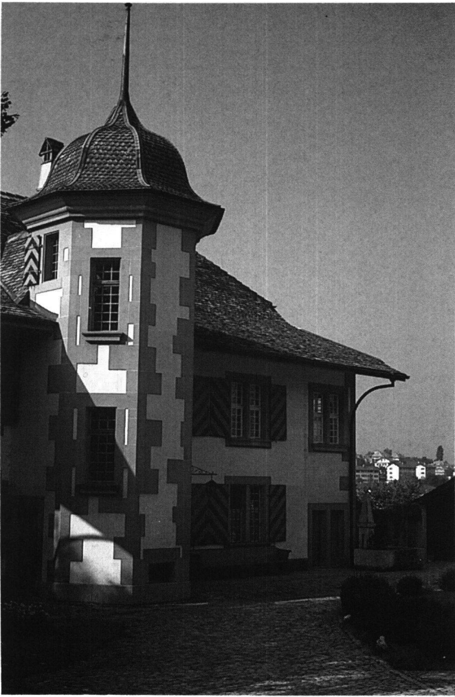
Abb.7 Ittigen/BE, Thalgut, Spätform des nachgotischen Herrschaftshauses mit Wendelstein. Die regularisierte Fassade und die «welsche Haube» bereits im Zeitstil des 17. Jahrhunderts.

walserischen Wandermeister wird in der Architekturgeschichte nach ihrer unmittelbaren Herkunft als Prismeller bezeichnet (Prismell im Val Sesia). Sie wanderten im 15. Jahrhundert vor allem nach Mailand an die Dombauhütte aus. Im 16. Jahrhundert wandten sie sich dann nach Norden und emigrierten in die Eidgenossenschaft, nach Deutschland und Frankreich. In ihrer unmittelbaren geographischen Nachbarschaft, im Gebiet der Walliser Zenden und des Bischofs von Sitten, haben die Prismeller seit dem beginnenden 16. Jahrhundert in mehreren Baumeistergenerationen eine geschlossene Kunstlandschaft nachhaltig mitgeprägt. Hier, wo ausserordentliche Meister – unter ihnen der von Bischof Mathäus Schiner beschäftigte, um 1485 in Prismell geborene Baumeister Ulrich Ruffiner – die wichtigsten sakralen und profanen Bauten in Stein errichteten und wo deren Tradition durch nachfolgende Generationen von zugewanderten Prismeller Meistern bis in die