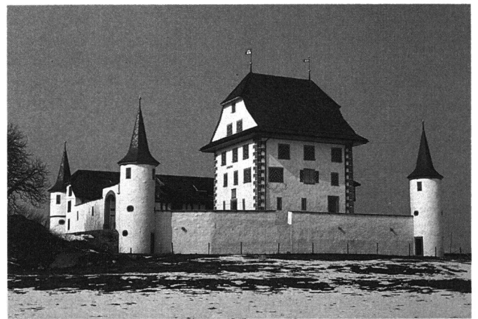
Abb.3 Ettiswil/LU, Schloss Wyher. Weiterführung der spätmittelalterlichen Erscheinungsform des Weiherhauses in nachgotischer Zeit, fertiggestellt 1588-90 unter Oberst Ludwig Pfyffer.

In der ersten Phase dieser politisch-sozialen Emanzipation, die sich über das ganze 15. und 16. Jahrhundert erstreckte, ist das Verhalten der «neuen» (d. h. nun territorialstaatlichen) Führungsschicht gekennzeichnet durch eine bewusste Anlehnung an die Würdeformen der vorausgehenden feudalzeitlichen Herrschaft, unter denen die Nobilitierung durch Ritterschlag inhaltlich an erster Stelle stand. Identifikation mit dem adligen Vorbild war zugleich Ausdruck eines verfassungsmässigen Kontinuitätsanspruchs (Landeshoheit, Führungselite). 6 In diesem frühneuzeitlichen Emanzipationsstreben der protoarokratischen eidgenössischen Führungsgruppen spielten herkömmliche