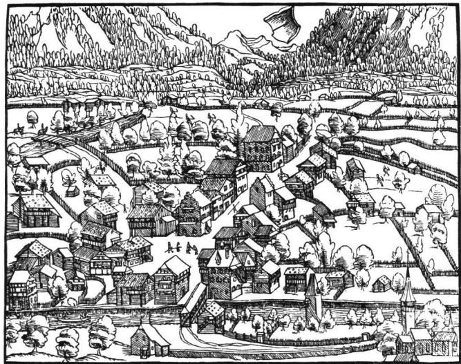
Abb. 4 Sarnen/OW, Ortsansicht nach Johannes Stumpf, um 1548. Spätmittelalterlicher Flecken mit alpinen Blockhäusern, aus denen die steinernen Herrenhäuser herausragen.

Der Einfluss der urbanen Baukultur auf das der Stadt vorgelagerte und durch den See unmittelbar mit ihr verbundene Umland scheint sich am Nordufer des Neuenburgersees, wo ein fürstlicher Kleinstaat den einheitlich politischen Rahmen gab, besonders stark ausgewirkt zu haben. In keiner andern Landesgegend im Gebiet der Alten Eidgenossenschaft findet man in der Zeit der Nachgotik (spätes 16. Jahrhundert) eine derart stilprägende, weitgehend durch das traditionelle Steinhauerwerk bestimmte Einheitlichkeit