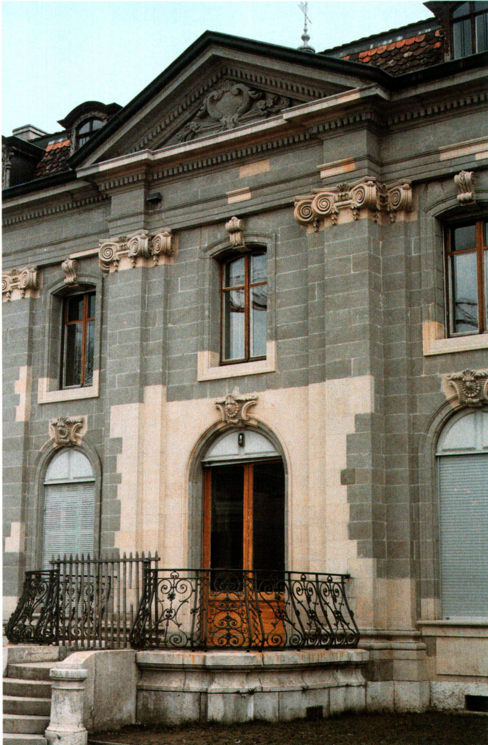
Fig.9 La Grande Boissière (Genève), avant-corps central de la façade ouest. Une restauration comme on les pratiquait dans les années 50-60: les façades ont été entièrement ravalées et de nombreux quartiers remplacés par des pierres d'une autre couleur.