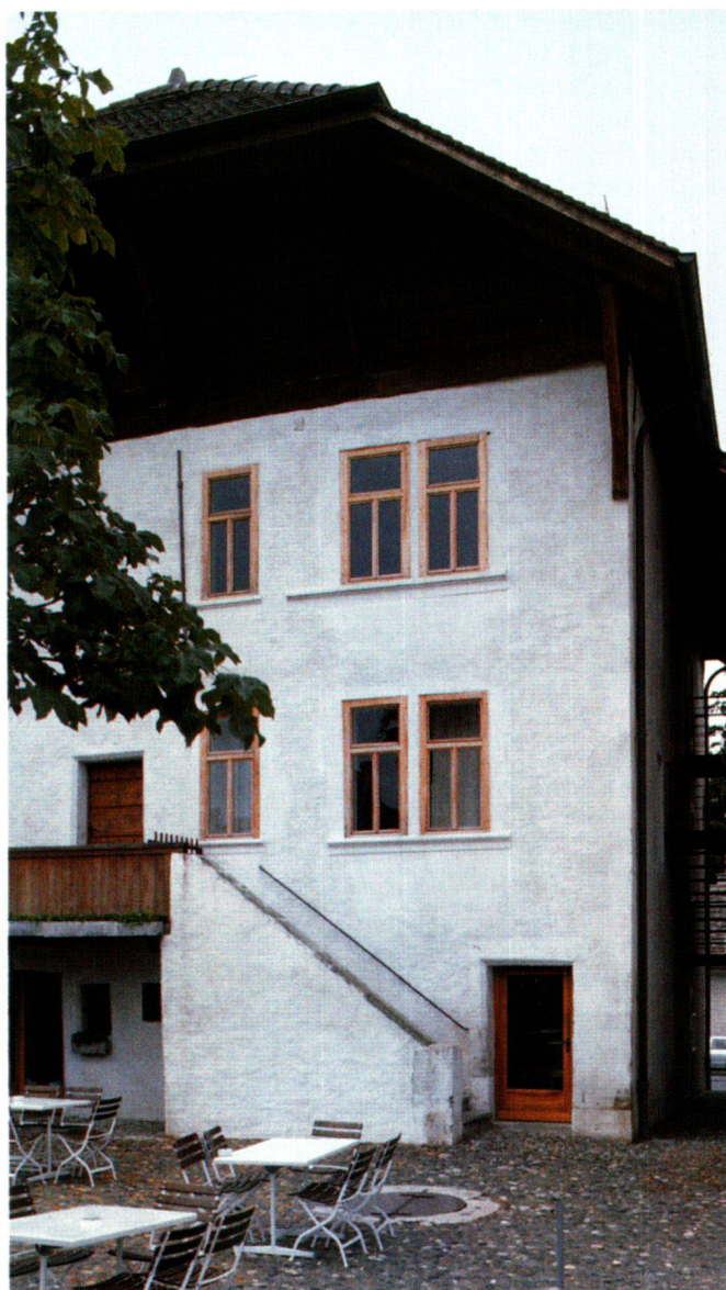
Fig. 3 Le château de Genthod (Genève), devenu Mairie en 1978, possède encore des fragments d'un crépi à faux-joints typique du XVII e siècle; ceux-ci ont été consolidés et l'ensemble des façades, soit crépi et pierre de taille (molasse), a été blanchi à la chaux, un traitement qui semble avoir été fréquent autrefois.

Ces remarques nous conduisent à relever que les différentes façades d'un même bâtiment s'organisent selon une hiérarchie très claire. L'architecte a modulé le décor et le