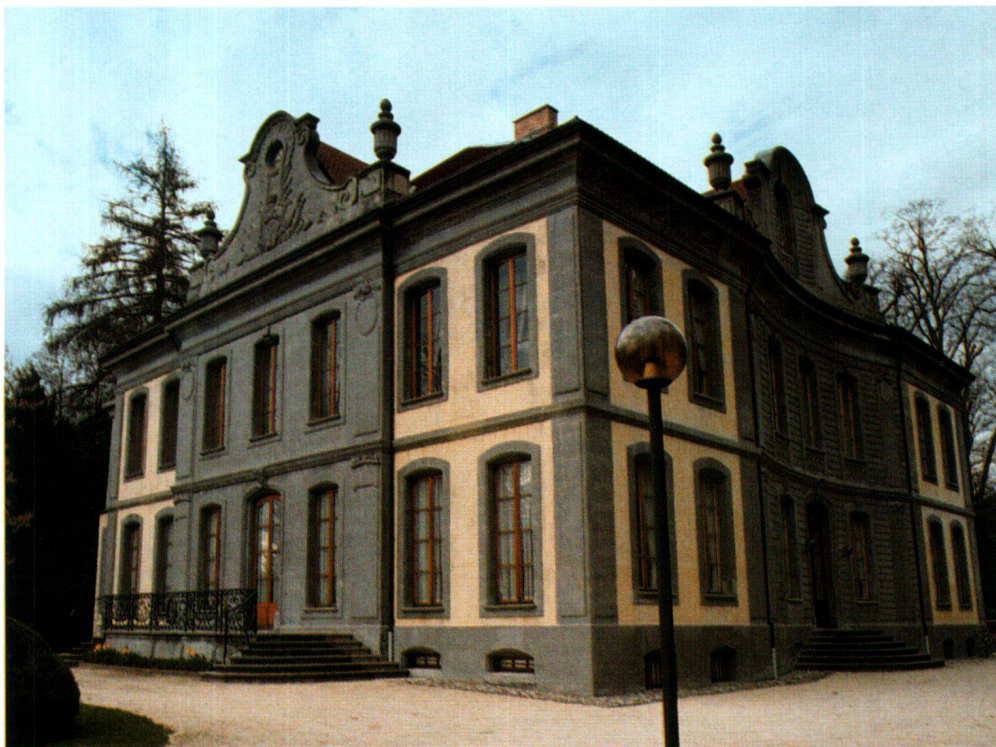
Fig. 4 L'Elysée (Lausanne). Les couleurs d'origine des façades ont été rétablies en 1979. On remarquera que les avant-corps, entièrement en pierre appareillée, sont uniformément badigeonnés en gris foncé, une couleur très répandue aux XVII e et XVIII e siècles, alors que, sur le reste des façades, les parties crépies badigeonnées en jaune contrastent avec le gris appliqué sur la pierre.

Que savons-nous de l'aspect des façades des maisons patriciennes lorsqu'elles étaient neuves? – Selon les informations recueillies à ce jour, il semble que, lorsque la pierre disponible avait un aspect suffisamment uniforme et que