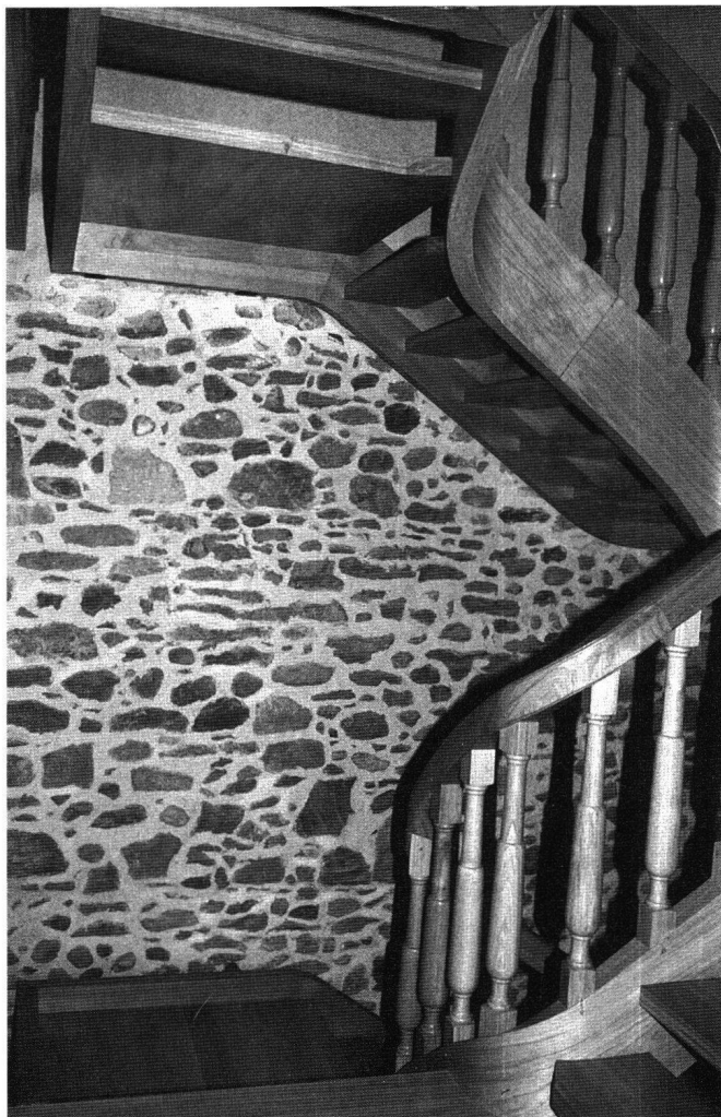
Fig. 12 La Tour de Meinier (Genève). Ce détail de l'escalier, construit lors de la récente transformation de ce bâtiment de la fin du XVI e siècle en mairie, témoigne d'un goût moderne pour la «belle pierre apparente» étranger à la tradition locale et à la sensibilité des constructeurs d'autrefois.

La confrontation des informations ainsi obtenues avec celles qui ont déjà été rassemblées à ce jour, avec des documents iconographiques bien sélectionnés et les mentions d'archives qui devraient être systématiquement relevées, serait riche d'enseignements et nous révélerait probablement les maisons patriciennes sous un jour nouveau.