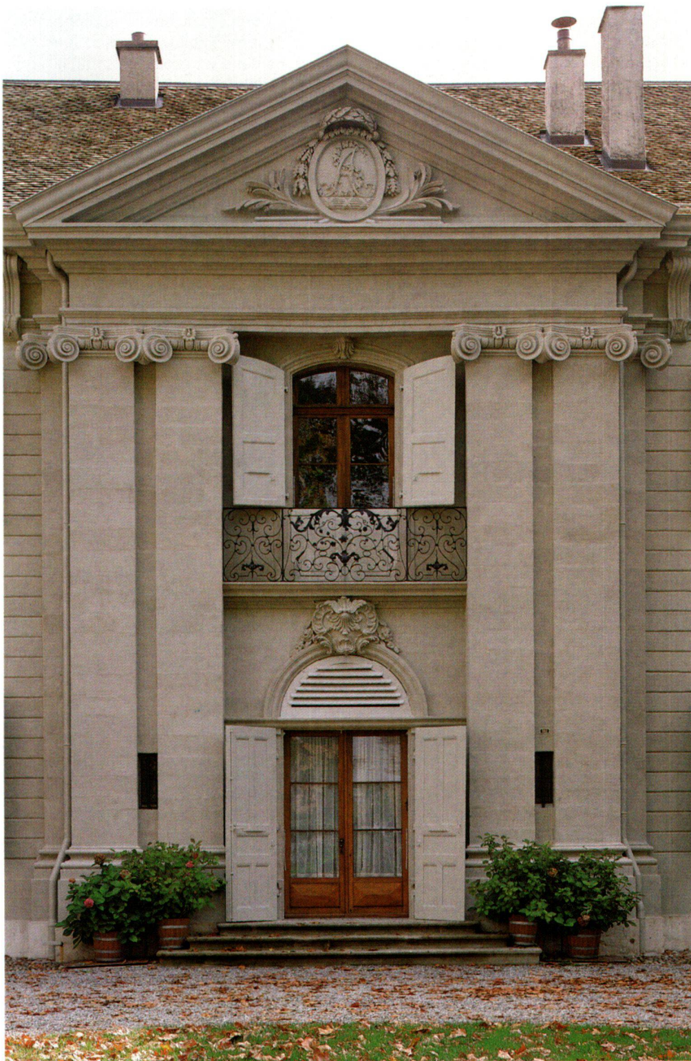
Fig. 10 Château de Crans (Vaud), avant-corps central de la façade sur cour. Pour unifier l'aspect des façades, auxquelles les réparations successives avaient donné un aspect «bigarré», et pour protéger la pierre, nous avons utilisé une peinture minérale Sax-Hydrosil avec glacis. Ce traitement unifié doit permettre une bonne lecture de la composition des façades.