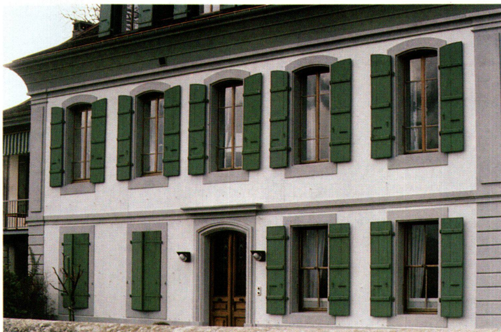
Fig. 5 Maison Barde, Genthod (Genève). Le gris «couleur de pierre» contrastant avec le blanc des fonds de murs crépis était fréquent à Genève aux XVII e et XVIII e siècles. Pour les façades de cette maison, entièrement ravalées lors d'une précédente intervention, nous avons utilisé, dans ces deux couleurs, des peintures minérales Sax-Hydrosil plus faciles à appliquer et moins fragiles que les badigeons de chaux.

introduire des couleurs autres que celles auxquelles on était habitué, même si l'on se référait à des modèles français traités différemment. Mais à la fin du XVIII e siècle la situation se modifie; le goût pour les couleurs se développe 12 ; la palette commence à s'enrichir et le XIX e siècle les verra se multiplier.