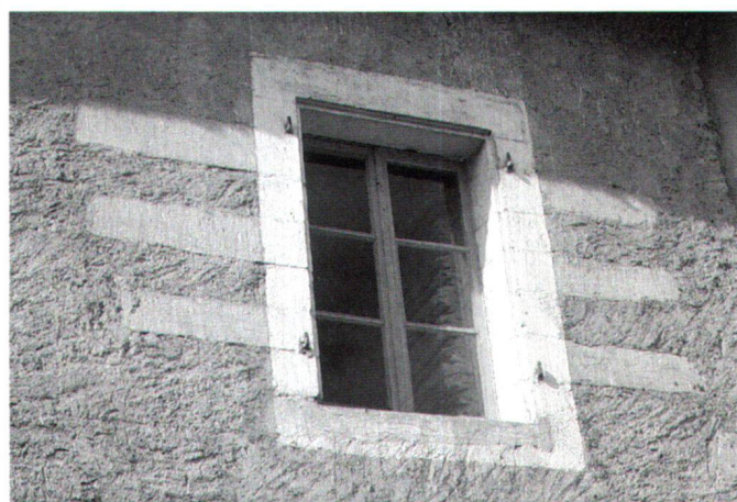
Fig. 7 Encadrement de fenêtre en molasse peint en blanc, couleur du calcaire de qualité du Jura proche de Genève. On notera que la largeur de l'encadrement est régulière et que les « queues » des pierres d'encadrement intégrées dans la maçonnerie sont peintes dans la couleur du crépi, comme c'en était l'usage.

sition. Et pourquoi ne pas peindre la molasse – matériau médiocre – de la couleur d'un matériau meilleur comme le calcaire du Jura (blanc près de Genève, jaune plus au nord) (fig. 7 et 2) ou plus prestigieux, tel le marbre de Saint-Tryphon (gris foncé 13 )? Si l'on ne pouvait pas s'offrir des chaînes d'angle et des encadrements de fenêtres en pierre, il était facile de les suggérer, par le traitement du crépi 14 ou par la peinture. Ces procédés permettaient d' enrichir à moindre frais les façades d'un faux appareil de pierre ou d'éléments d'architecture peints en trompe-l'œil, tels ces pilastres