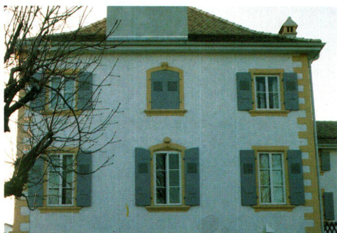
Fig. 6 Au château de Préverenges la peinture d'une fausse fenêtre à l'emplacement occupé par les conduits de fumée a permis d'assurer la régularité de la façade.