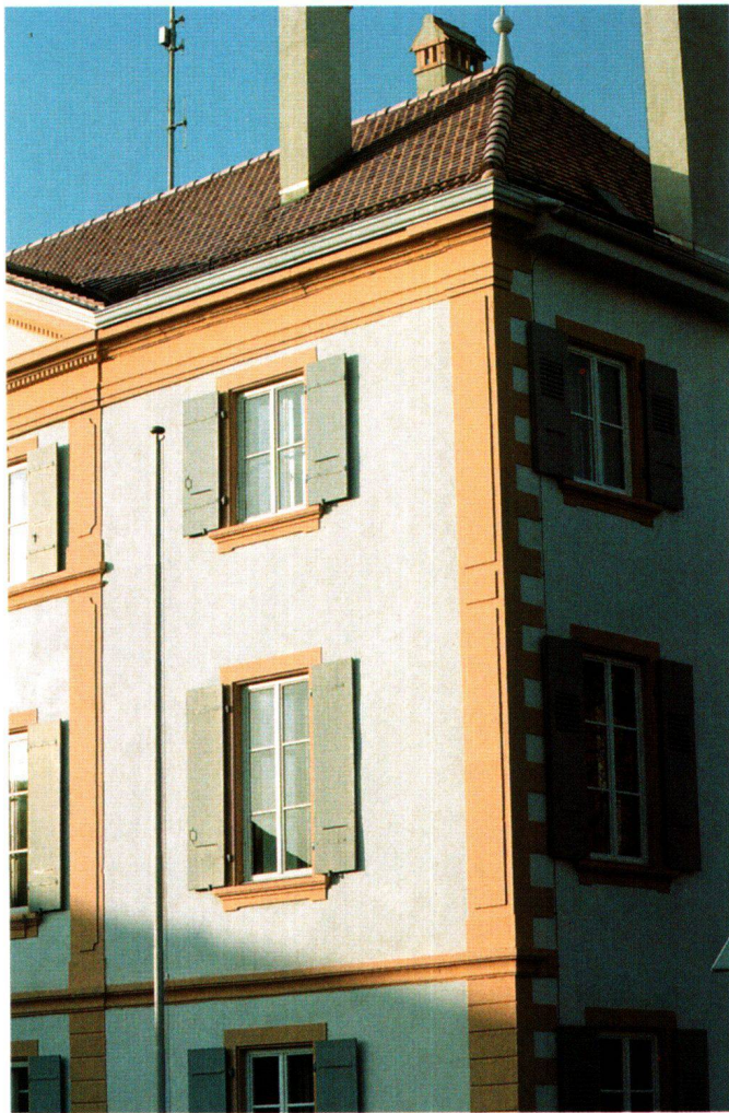
Fig. 2 Le château de Préverenges (Vaud) est devenu le siège de l'administration municipale. Une restauration intelligente réalisée par la commune avec la collaboration des Monuments historiques a permis de restituer les couleurs d'origine des façades; ici, la «couleur de pierre» est le jaune du calcaire du Jura vaudois et neuchâtelois. Comme au XVIII e siècle, le traitement souligne la hiérarchie des façades voulue par le constructeur: à gauche, sur la face principale, chaîne d'angle avec refends, tables en saillie et cordon mouluré; à droite, simple chaîne en harpe et absence de cordon mouluré marquent le caractère secondaire de cette face latérale.

On signalera d'autre part que l'élément le plus marquant de la façade principale, le porche d'entrée, avec ses colonnes, a été exécuté dans le marbre de Saint-Tryphon gris foncé réputé évoqué p. 90; comme ailleurs, avec le temps et l'exposition aux intempéries, ce marbre s'est beaucoup éclairci en surface.