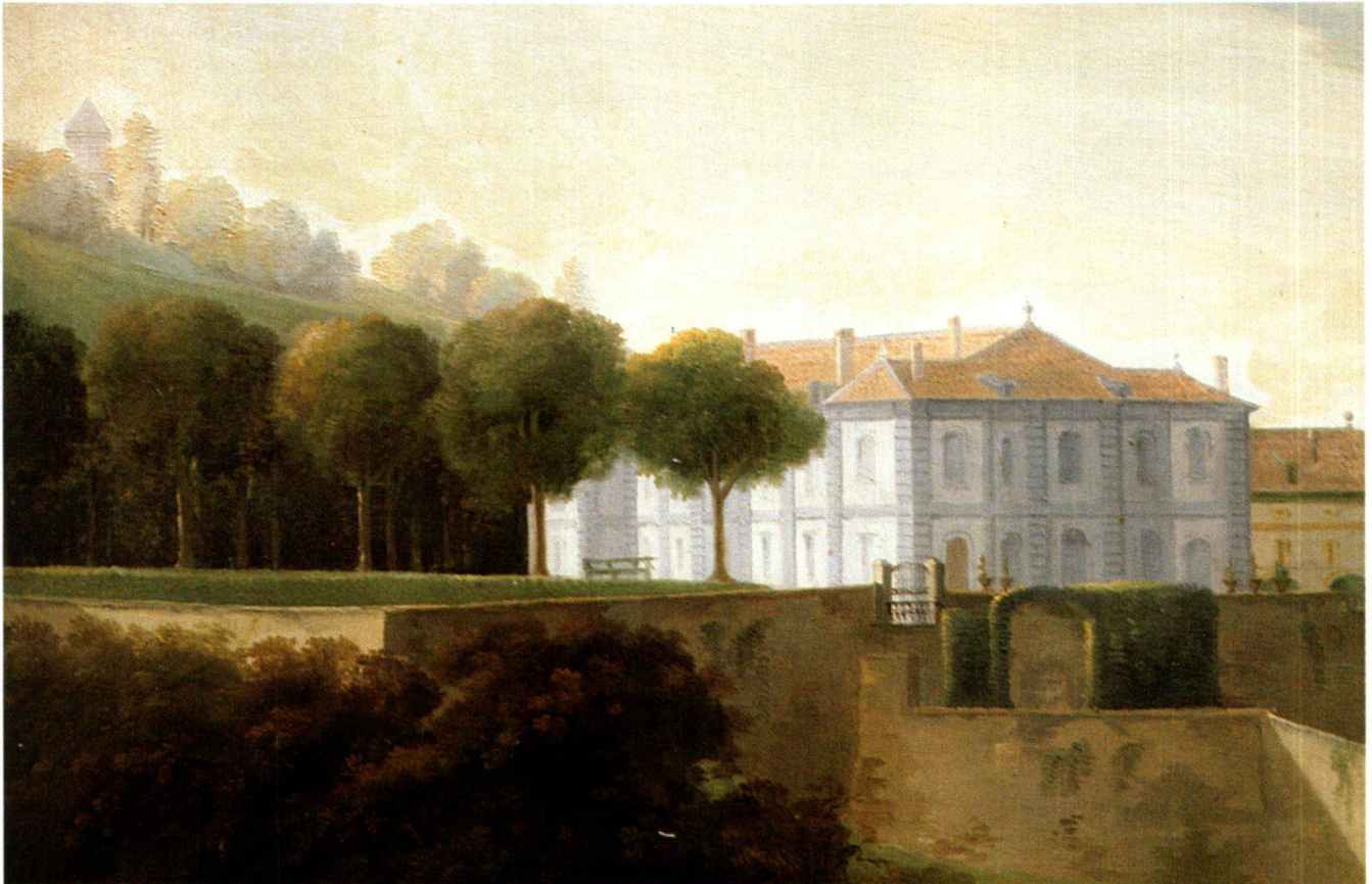
Fig. 1 Le Reposoir, Pregny (Genève). Détail d'une huile sur toile de Rodolphe Gautier, 1791, Fondation du Reposoir, Pregny. Sur cette peinture de 1791 la maison de maître, mise en évidence par la peinture des façades qui en souligne l'architecture, se distingue nettement des bâtiments ruraux traités plus simplement que l'on aperçoit à droite. Aujourd'hui la peinture rose du crépi et la pierre de taille de différentes couleurs laissée nue (dès la fin du XIX e siècle probablement), confèrent à la maison un caractère différent.