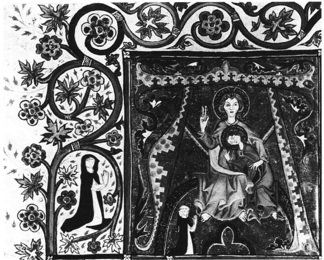
Abb. 4 Christus-Johannes-Gruppe, Graduale von St. Katharinenthal, LM 26117, fol. 158av. Zürich, Schweizerisches Landesmuseum, und Frauenfeld, Historisches Museum des Kantons Thurgau.

Eine weitere Bedeutungsschicht der Christus-Johannes-Gruppen stellt der Aspekt der Brautmystik dar, der ebenfalls auf Origenes zurückgeht. In seiner Ausdeutung des Hohenliedes Salomonis setzt er Johannes mit der Braut des Hohenliedes gleich. Daraus erwuchs die Idee von der Virginität des Evangelisten, die auch in den Breviertext aufgenommen wurde («virgo est electus...», fol. 189r). So wurde die «familiaritas» mit Christus begründet; Johannes ist