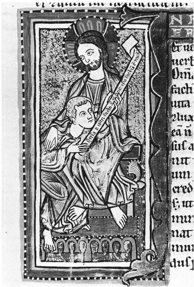
Abb. 5 Christus-Johannes-Gruppe, Missale, Rh. 14, fol. 122r. Zürich, Zentralbibliothek.

telbar nachfolgenden Initialminiatur mit der sogenannten Jungenprobe zu. Beide Miniaturen illustrieren dieselbe Antiphon («Valde honorandus est...», die zweite gehört zum ersten Responsorium der ersten Nokturn), und, wie wir gleich sehen werden, ihre Bildaussagen ergänzen sich;