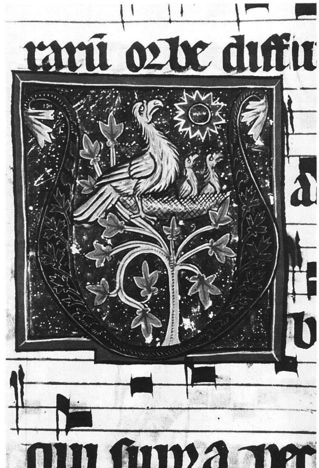
Abb. 6 Jungenprobe, Antiphonar, Cod. Vat. lat. 10771, fol. 189v. Rom, Biblioteca Apostolica Vaticana.

Am Kolloquium «Artistes, Artisans et Production Artistique au Moyen Age» in Rennes 1983 waren gleich drei Beiträge den verschiedenen Werkstattangaben gewidmet. 52