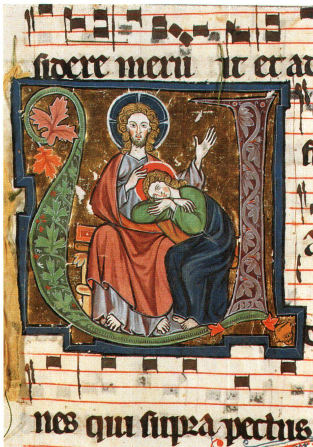
Abb. 1 Christus-Johannes-Gruppe, Antiphonar, Cod. Vat. lat. 10771, fol. 188v. Rom, Biblioteca Apostolica Vaticana.

weniger gut erforscht. Insbesondere sieben liturgische Handschriften, die seit spätestens 1905 in der Biblioteca Apostolica Vaticana in Rom unter den Signaturen Cod. Vat. lat. 10769 bis 10775 aufbewahrt werden 3 und auf die P. Ladner im Kommentarband zur Faksimileausgabe des Graduale von St. Katharinenthal aufmerksam gemacht hat 4 , sind bisher unerforscht geblieben. Im vierten Band der Kunstdenkmäler des Kantons Thurgau, das Kloster St. Ka-