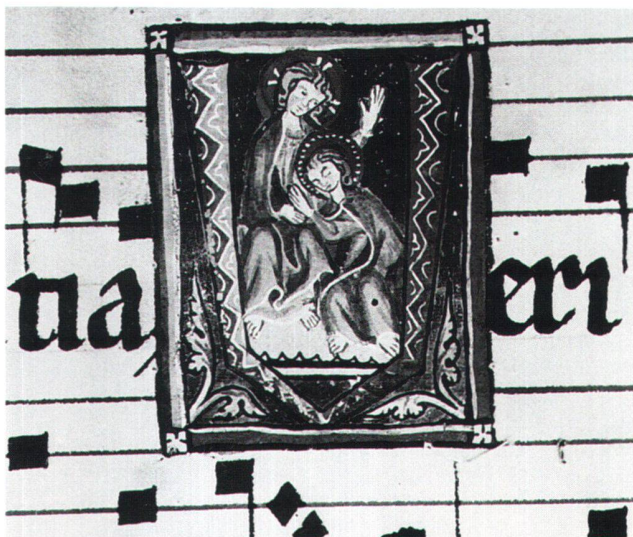
Abb. 3 Christus-Johannes-Gruppe, Graduale von St. Katharinenthal, LM 26117, fol. 161r. Zürich, Schweizerisches Landesmuseum, und Frauenfeld, Historisches Museum des Kantons Thurgau.

Im folgenden werden die zwei Miniaturen – Christus-Johannes-Gruppe und Jungenprobe (Abb. 1 u. 6) – erörtert, die das Fest Johannes des Evangelisten in der Antiphonahandschrift Vat. lat. 10771 der Vatikanischen Bibliothek illustrieren.