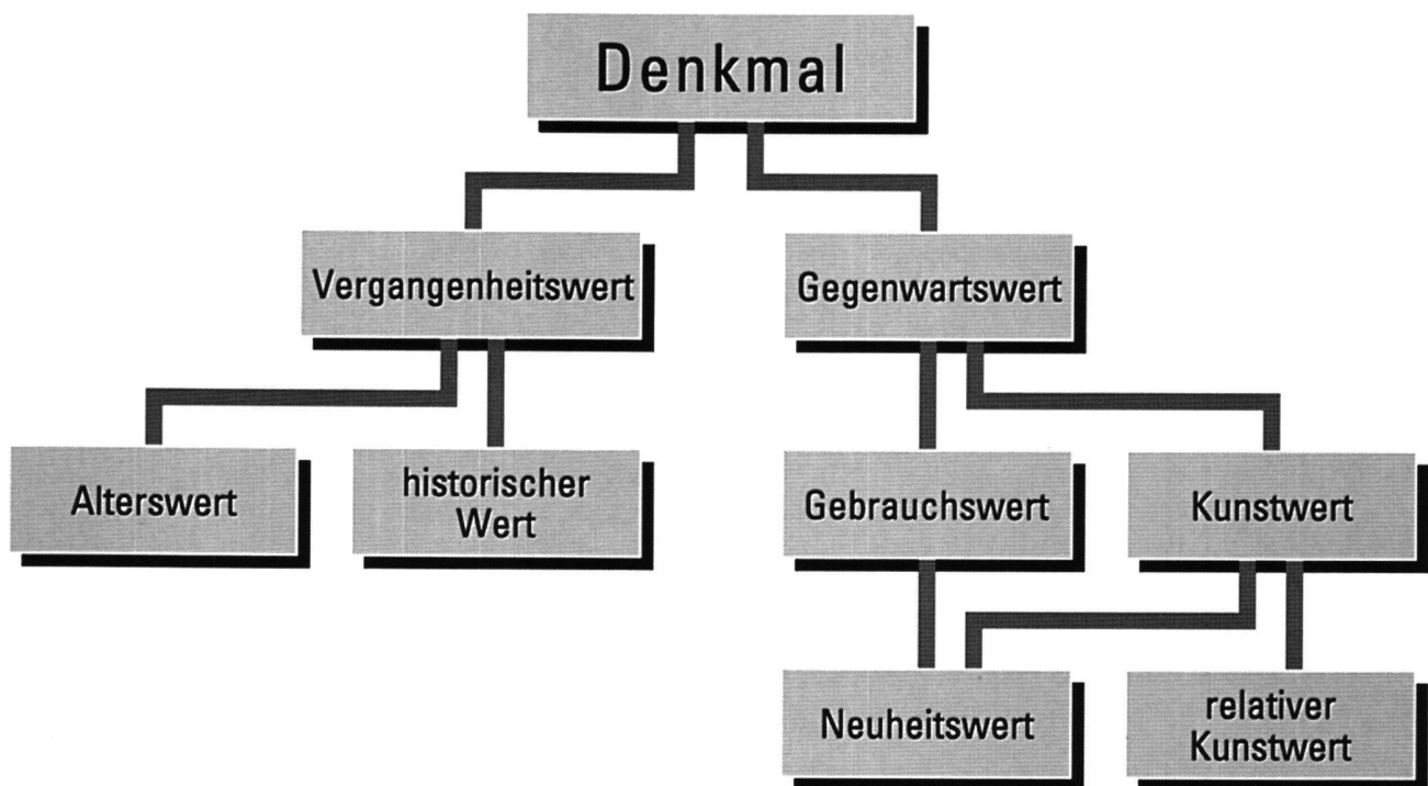
Abb. 2. Die Denkmalwerte nach Alois Riegl, reduziert um die in seiner Theorie nebensächlichen Begriffe «Gewolltes/Ungewolltes Denkmal» und «Gewollter Erinnerungswert». Das Schema zeigt nun jene Werte, die auch heute noch nichts von ihrer Bedeutung verloren haben.

ihre Zweckmässigkeit für Erhaltung und Steigerung des Gattungslebens, der Ausgangspunkt auch für ihren Schönheitwerth gewesen ist. ... Vielmehr bildet diese eigenartige Tendenz, die Dinge möglichst aus der Entfernung auf sich wirken zu lassen, ein vielen Gebieten gemeinsames Zeichen der modernen Zeit. ... Daher nun auch der jetzt so lebhaft empfundene Reiz des Fragmentes, der blossen Andeutung, des Aphorismus, des Symbols, der unentwickelten Kunststile.» 73