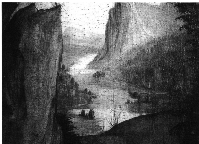
Fig. 6 Paysage, détail de la Visitation du maître-autel de Lautenbach, du peintre du maître-autel de Lautenbach, vers 1505–11. Eglise paroissiale de Lautenbach/Renchtal.

Cet homme riche n'est pas un aristocrate mais bien plutôt un bourgeois dont la classe a beaucoup suscité l'art du portrait. Il a acquis son rang social grâce aux valeurs de courage et de ténacité à la tâche qui étaient celles de son milieu aux XVe et XVIe siècles 3 . Il est parvenu à la fin de ses jours à une aisance matérielle qui lui permet de contempler sa vie avec une conscience de soi tranquille. Cette tranquillité se remarque à la main abandonnée, entr'ouverte, aux traits du visage détendu, sans apprêt.