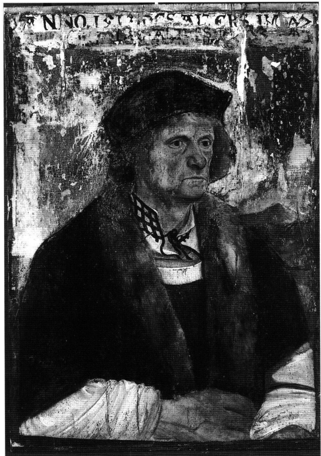
Fig. 1 Portrait d'un homme dans sa soixante-douzième année (Johannes Amerbach?), attribué au peintre du maître-autel de Lautenbach, 1513. Tempera sur parchemin tendu sur bois, 52 cm × 36 cm. Bâle, Öffentliche Kunstsammlung (Inv. n° 671).

Le portrait d'un homme de 71 ans présente un personnage de trois-quart occupant toute la hauteur du tableau dont le fond de ciel bleu pâle est ruiné. Il est habillé avec richesse, coiffé d'une toque à la mode et revêtu d'une pèlerine brune à col de vison, un habillement dans lequel aimaient se faire portraitiser beaucoup de personnages de l'époque. La blouse blanche au col haut négligemment lacé et entr'ou-