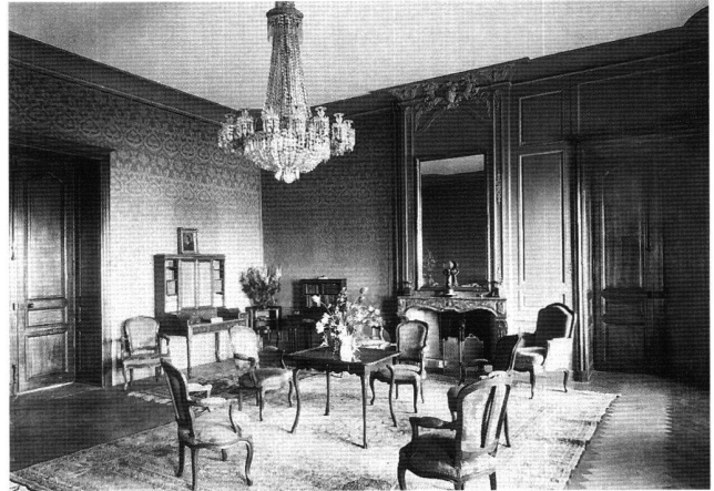
Fig. 3 Grand salon de réception du Château de Prangins (même pièce que la salle du culte, fig. 3), vers 1950. Photographie. Zurich, Musée national suisse.

tution du passé comme condition de son intelligence ne nous est plus possible. Evoquer, oui, mais aussi expliquer. Expliquer par tous les moyens que permet l'exposition d'objets et d'images: la mise en scène qui permet de rappeler la fonction de l'objet, l'abstraction qui privilégie l'approche esthétique ou symbolique, la systématique enfin qui n'isole pas l'objet, mais le place parmi d'autres. Et nous voici au troisième volet de notre sujet: le château de Prangins.