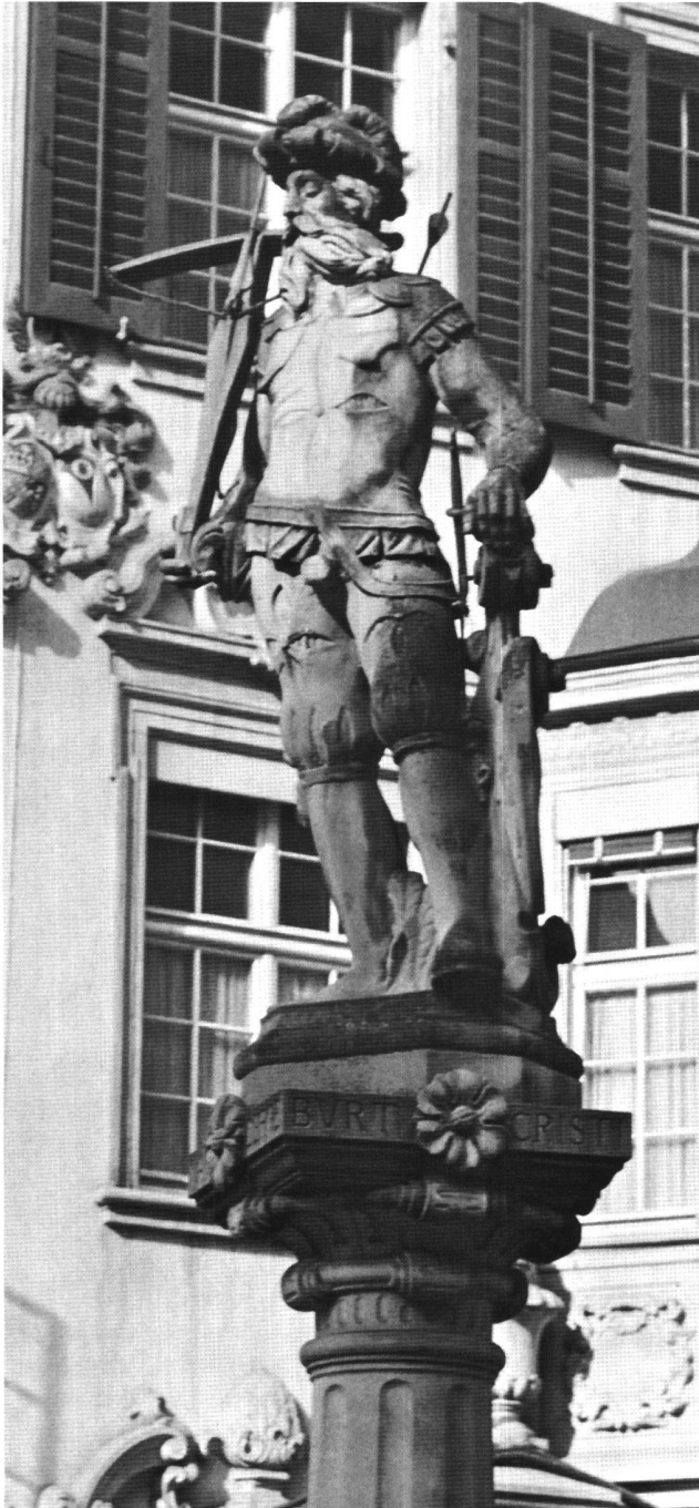
Abb. 4 Tell-Brunnen in Schaffhausen, 1522; die Figur datiert von 1682. Dieser Krieger-Tell ist eine Kombination aus Bannerherr und allgemeiner Tellenfigur mit Standesfarben und Standeswappen.

lichkeit gar nicht. Die meisten entstanden zu Beginn des 16. Jahrhunderts als Produkte der anhebenden Neuzeit. Die ältesten Harnischmänner der Schweiz – es gibt sie auch im süddeutschen Raum (z.B. in Staufen) – sollen 1515 und 1524 in Schaffhausen aufgestellt worden sein. 10