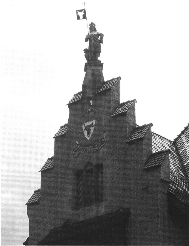
Abb. 9 Der Urner Bannerherr aus dem 16. Jahrhundert auf dem Giebel des 1906 errichteten Historischen Museums in Altdorf. Der Historismus (z.B. mit seinen patriotischen Monumenten) verdrängte die echten Relikte der Vergangenheit und bot ihnen zugleich Schutz, wenn auch in entfremdeter Umgebung im oder in diesem Fall auf dem Museum.

kompensierte mit den Jahren in einem gewissen Sinn den Verlust der Linde, so dass der mit dem Baum verknüpfte Mythos auf den Turm übergang, an dem in einem aus dem Jahr 1694 stammenden breit angelegten Bildprogramm unter anderem auch die bereits erwähnte Apfelschuss-Szene abgebildet war. Vor dem Turm wurden im übrigen nun auch gewisse Strafvollstreckungen auf dem Lasterstein (Pranger) vorgenommen. Der Turm bestimmte letztlich auch den Standort des Kissling-Denkmal, das heisst: Die Eidg. Kunstkommission entschied sich für die Lösung, die den Turm zur Kulisse machte, während ein Teil der Fraktion der Einheimischen den alten Brunnen-Standort vorgezogen hätte.