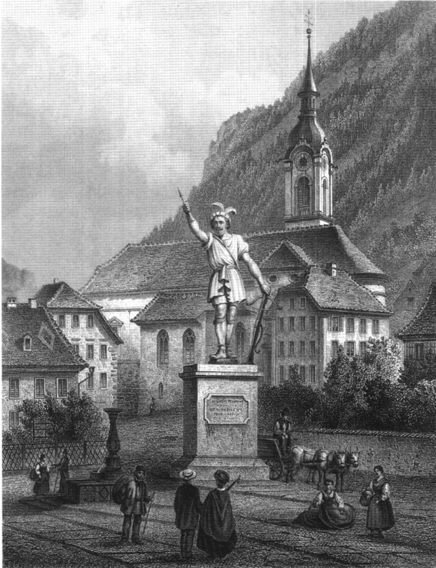
Abb. 6 Tell-Denkmal in Altdorf, um 1860, Stahlstich. Curigers bescheidene Tell-Statue von 1786 hatte für den Geschmack des späteren 19. Jahrhunderts als Monument für den Nationalhelden zu wenig Pose. Die Urner liessen sich das imposante Gips-Monument schenken, das am Eidgenössischen Schützenfest von 1859 in Zürich den Triumphbogen bekrönt hatte. Links vom Sockel der nun leere Brunnenstock. Zürich, Schweizerisches Landesmuseum.

pelfigur ist – nicht als szenische Darstellung, sondern als symbolisch verdichtetes Emblem –, wie gesagt, schon 1588 an der Bürgler Kapelle angebracht worden. Hier ist anzumerken, dass zwischen einer zweidimensionalen Darstellung an einer Kapellenwand (auch wenn es sich um die Aussenwand handelt) und einer auf einem öffentlichen Platz aufgestellten Skulptur ein mehr als bloss formaler