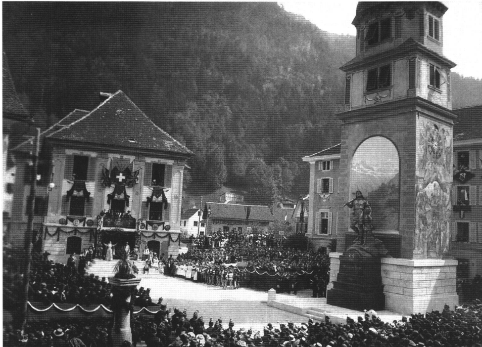
Abb. 8 Festspiel zur Einweihung des Tell-Denkmal von Richard Kissling am 28. August 1895. Links im Vordergrund wiederum der nun – beinahe – leere andere Brunnenstock.

Motivgeschichtlich müssen wir drei Etappen auseinanderhalten: Die erste Etappe, in der am zentralen Ort kein Tell oder nur ein namenloser Tell in der Gestalt eines Bannerherrn figuriert; die zweite Etappe mit drei aufeinander folgenden Tell-Monumenten auf einem Nebenplatz, während der alte Krieger die Stellung auf dem zentralen Platz hält; und die dritte Etappe schliesslich, welche den