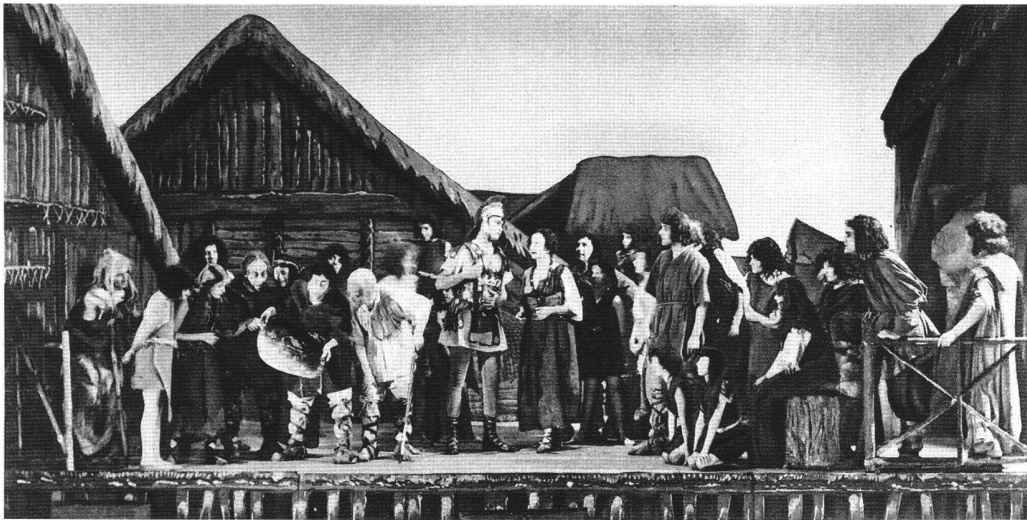
Abb. 3 «Die Pfahlbauer» in der Uraufführung von 1929 am Stadttheater in Bern, mit dem Bühnenbild von Ekkehard Kohlund (1887–1974). Die Szene zeigt Avanzan , der in voller Bronzerüstung in sein Dorf zurückkehrt. Daneben wirkt Majola wie eine behäbige Berner Bäuerin.

gegenüber, die einen strukturierten Handlungsablauf nicht aufkommen lässt. Diese Neuerung kontrastiert gerade eben mit der existentiellen Beschränktheit, der Bequemlichkeit und der geistigen Enge des Pfahlbürgers (des Spiessbürgers), der nicht über seine eigene Siedlung hinausieht und sich allem Ungewohnten und Fremden widersetzt. Nur die Angst vor dem Feind, vor materiellem Verlust bringt etwas Bewegung in den von Feigheit,