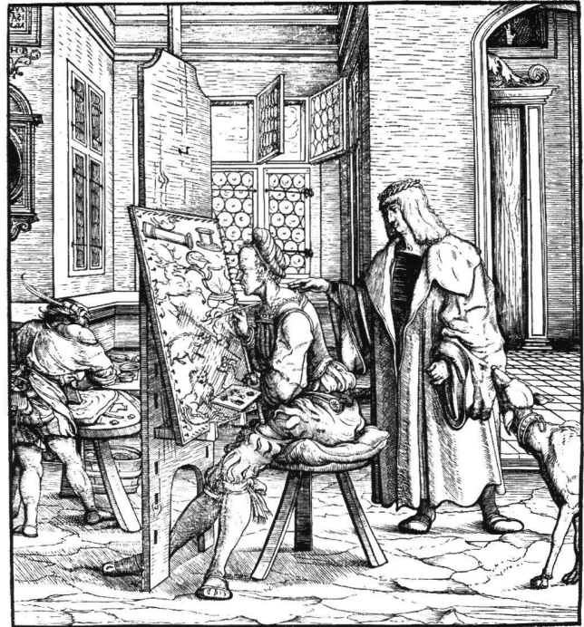
Abb. 9 Der Weisskunig besucht den Maler in der Werkstatt, von Hans Burgkmair, 1516–1518. Holzschnitt aus dem Weisskunig.

im Imperfekt. Es ist nicht mehr zu klären, wer ihm den Text vorschrieb: «H.BVRGKMAIR BINGEBAT 1505». 48 Die Signaturformel des Apelles, so wie sie Plinius überliefert, 49 ist ein wichtiges Indiz für das Interesse des Malers an dem antiken Kollegen. In jedem Fall wird ihm dies von einem Augsburger Humanisten, vielleicht Peutingen, nahegelegt