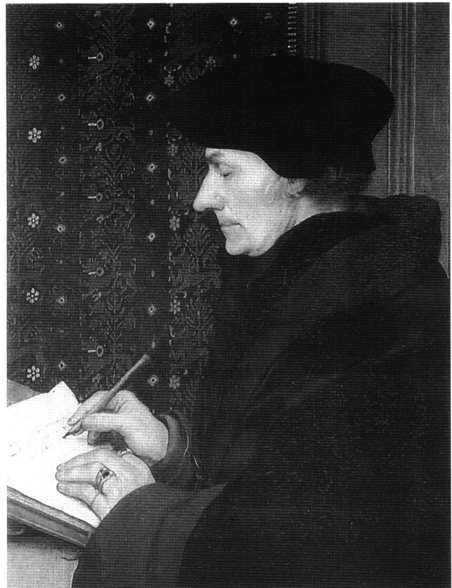
Abb. 6 Bildnis des Erasmus von Rotterdam, von Hans Holbein d. J., 1523. Tempera auf Lindenh Holz, 42 × 32 cm. Paris, Musée du Louvre.

eine reflexive Versunkenheit bzw. eine Handlung des Denkens, die den Dargestellten seiner Gegenwart spirituell enthebt. Das Morus-Bildnis kann dies veranschaulichen. Der mit einem solchen Blick einhergehenden Dreiviertelansicht wohnt, wie das Beispiel Baldungs zeigte, eine immerhin potentielle Kontaktaufnahme zwischen Betrachter und Figur inne, die hier als eine Form der Verweigerung Distanz und somit eine aeternisierende Dimension schafft.