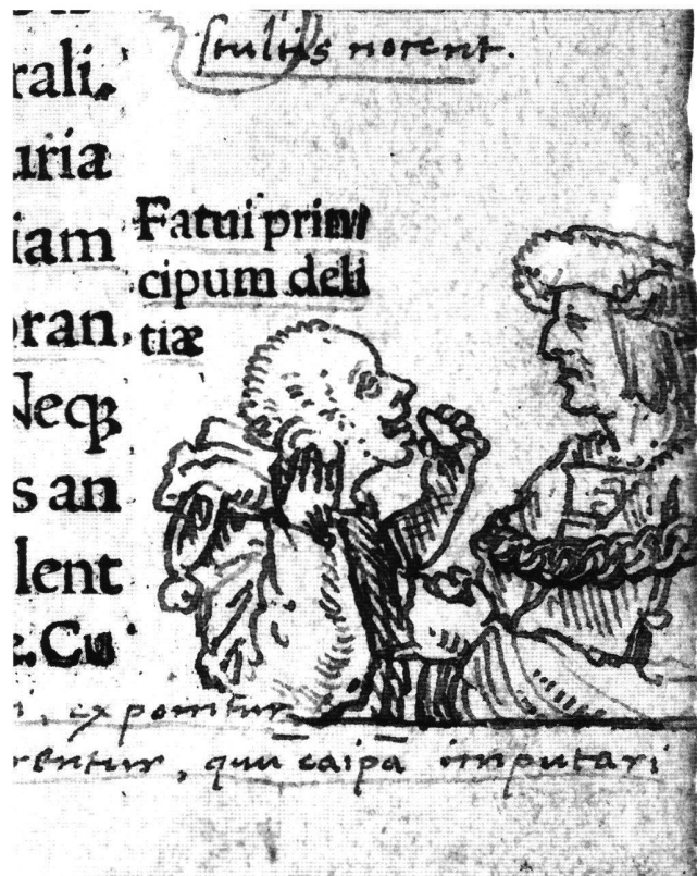
Abb. 7 Kaiser Maximilian und sein Hofnarr, von Hans Holbein d. J. Feder, Randzeichnung in: Erasmi Roterodami encomium moriae i. e. Stultitiae laus, Johannes Froben, Basel 1515, fol. H 4. Basel, Öffentliche Kunstsammlung, Kupferstichkabinett, Inv.-Nr. 1662. 166.