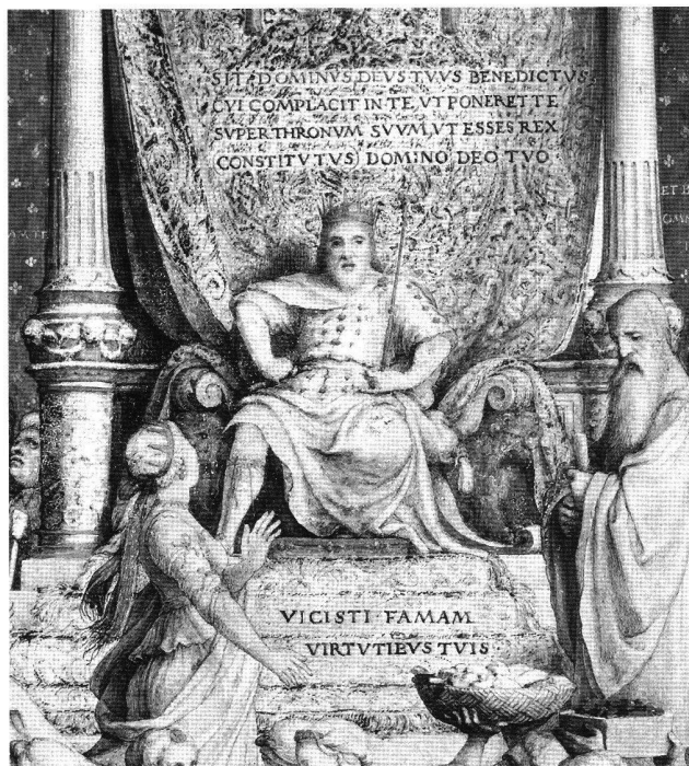
Abb. 3 Salomo, Detail aus Abb. 1.

Kleidung sonst gefertigt ist. Damit verzichtet Holbein auf die bei Porträts so wichtige Möglichkeit, die Figur durch das Kostüm zu individualisieren. In der Gewandung spielt er bestenfalls auf den englischen König an.