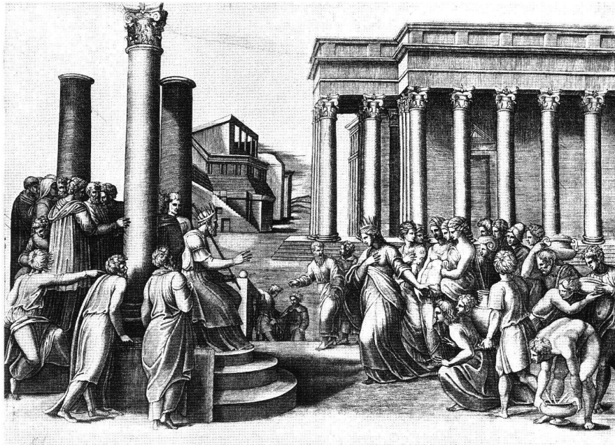
Abb. 5 Salomo und die Königin von Saba, von Marcantonio Raimondi, um 1520. Kupferstich, 401 × 565 mm. London, British Museum, B. 13.

Eine exakte Analyse der Figuresprache ist schwierig, da es keine illustrierte zeitgenössische Aufschlüsselung von Gesten gibt; doch nimmt John Bulwer den ausgestreckten kleinen Finger in sein 1644 in London publiziertes und mit zahlreichen Holzschnitten illustriertes Werk «Chirologia: Or the Natural Language of the Hand» auf. Dort erläutert er, dass es verächtlich und provozierend sei, bei geschlossener Hand mit dem kleinen Finger zu winken. 33 Das entspricht Salomos Geste natürlich nicht exakt; doch im Zusammenhang mit den weit auseinandergespreizten Beinen, einer Haltung, die Jodocus Willich 1540 als un-