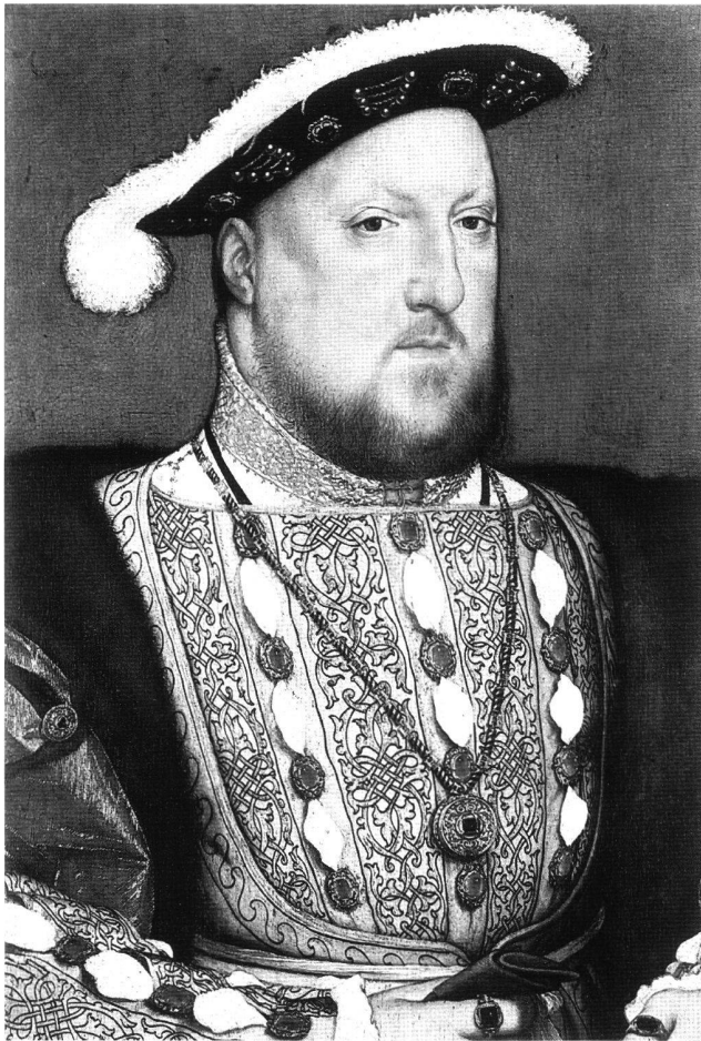
Abb. 2 Bildnis Heinrichs VIII., von Hans Holbein d. J., um 1537. Öl auf Eichenholz, 28×20 cm. Madrid, Fundación Colección Thyssen-Bornemisza.

Hofstaat und ist deshalb in drei durchgehend zu lesenden Zeilen links und rechts vom Thron zu finden: «BEATI VIRI TVI ET BEATI SERVI HI TVI QUI ASSISTVNT CORAM TE OMNITPE ET AVDIVNT SAPIENTIAM TVAM». Bis hierhin wird der Paralipomenon-Text der Vulgata-Fassung zitiert. Die Schlussworte, die unmittelbar über dem thronenden Salomo stehen, weichen jedoch leicht von dieser Bibelstelle ab. Bei Holbein exklamiert die