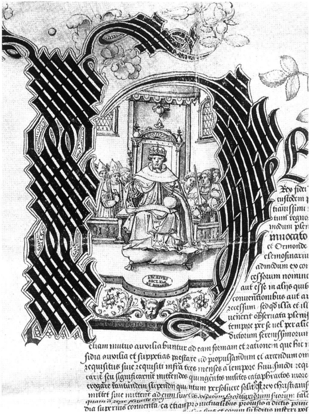
Abb. 4 Initiale mit Heinrich VIII., von Lucas Horenbout (?), in: Vertrag von Windsor, 1532. Feder (braun), braun laviert auf Pergament. Paris, Archives Nationales, AE III 31.

Um Ähnlichkeit zwischen Salomo und Heinrich aufzuzeigen, hätte Holbein das Band unterhalb von Salomos Knie, welches sofort an den Hosenbandorden erinnert, wie in Whitehall und dem Barbers-Bild, als solchen deutlich kennzeichnen können. Damit wäre der Zusammenhang zwischen historischer und biblischer Figur deutlich geworden. Salomos «Strumpfband» ist aber Teil seiner Sandale.