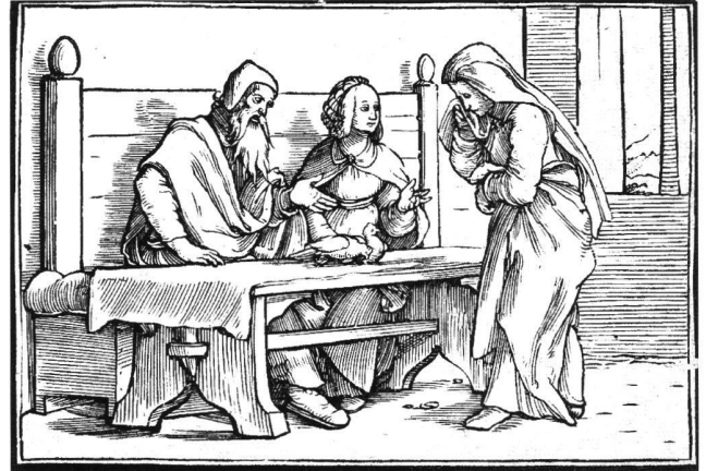
Abb. 7 Hannah, Pennina und Elkanah, nach Hans Holbein d.J., 1538. Holzschnitt aus «Historiarum Veteris Testamenti Icones». Basel, Öffentliche Kunstsammlung, Kupferstichkabinett.