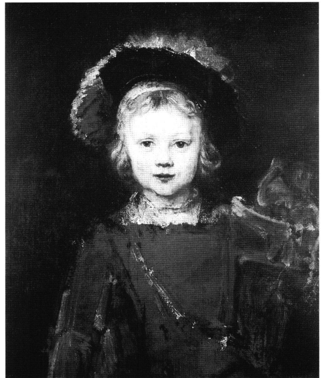
Abb. 9 Junge in Phantasiekostüm, von Rembrandt Harmensz. van Rijn. Öl auf Leinwand, 64,8 × 55,9 cm. Pasadena, Norton Simon Foundation.