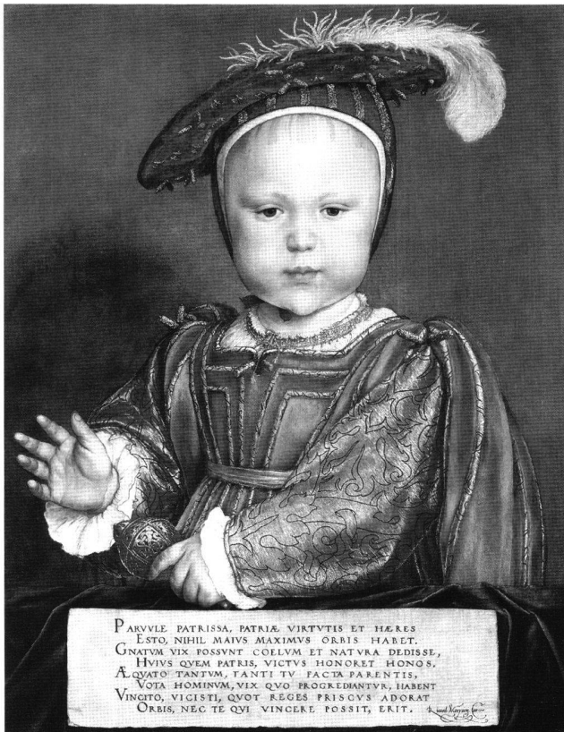
Abb. 8 Bildnis von Edward, Prince of Wales, von Hans Holbein d. J., 1538/39. Tempera auf Eichenholz, 57 × 44 cm. Washington, National Gallery of Art, Andrew W. Mellon Collection.