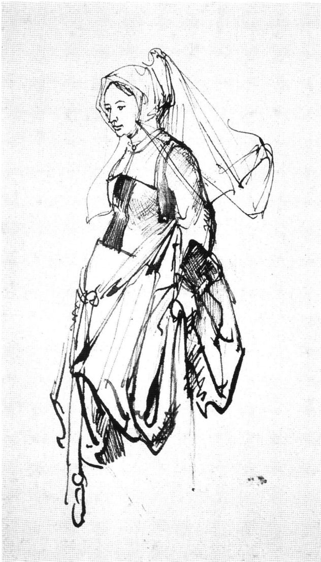
Abb. 2 Junge Engländerin, von Rembrandt Harmensz. van Rijn (?). Feder in Braun, 191×126 mm. Oslo, Nasjonalgalleriet.