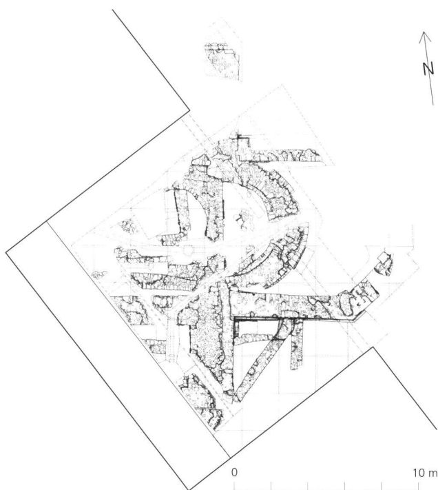
Abb. 2 Glarus, ehemalige Talkirche St. Fridolin und Hilarius. Die Kirche ist nach dem Brande von Glarus im Jahre 1861 verlegt worden; an ihrer alten Stelle steht seit 1864 das Gerichtsgebäude von Architekt Johann Caspar Wolff. Grabungssituation im Hof des Gerichtsgebäudes 1968, Plan mit Zweimeterraster.

menhang heraus erkennen und einordnen zu können (Abb. 3).