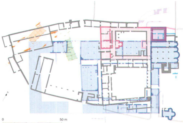
Abb. 4 Müstair, Kloster St. Johann, Übersichtsplan. Prähistorische (orange), römische (grün), karolingische (blau, hellblau: nachträglich) Gebäude. Bauten des 10. Jahrhunderts (violett) und romanische Bischofsresidenz (rosa).

Ganz allgemein spielt sich Zusammenarbeit zwischen Archäologie und Denkmalpflege vor allem auf dem Gebiete der Architektur ab; die Archäologie leistet den Teil «Bauforschung», wenn es darum geht, das Denkmal als Urkunde zu verstehen. Das heisst nicht, dass der Archäo-