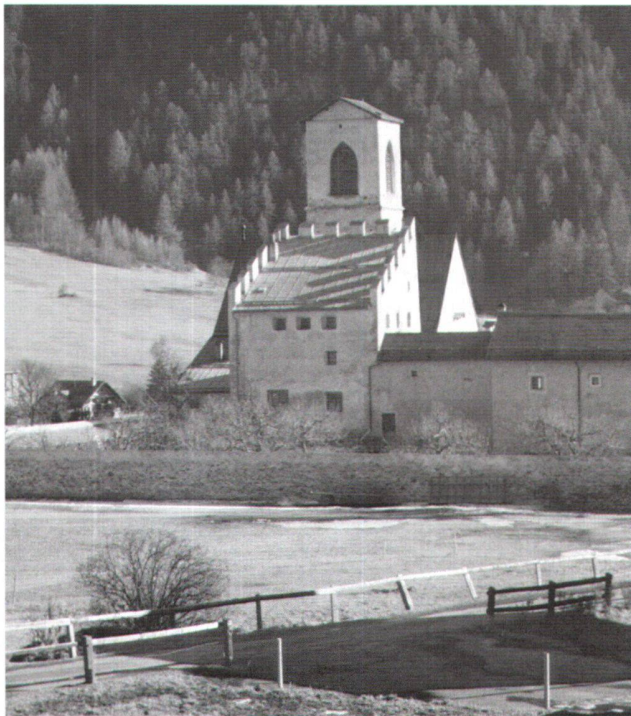
Abb. 5 Müstair, Kloster St. Johann. Nordostecke des Klosters mit Plantaturm, dahinter Kirchendach und Kirchturm von Nordwesten, 1989.

Ganz allgemein spielt sich Zusammenarbeit zwischen Archäologie und Denkmalpflege vor allem auf dem Gebiete der Architektur ab; die Archäologie leistet den Teil «Bauforschung», wenn es darum geht, das Denkmal als Urkunde zu verstehen. Das heisst nicht, dass der Archäo-