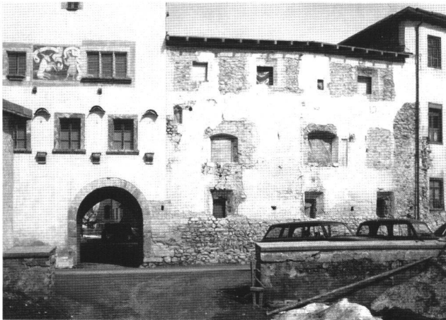
Abb. 8 Müstair, Kloster St. Johann. Südtrakt, Fassade nach der Untersuchung. Fenster aus dem 19. Jahrhundert sind zugemauert, ältere wieder geöffnet.

Der Archäologe befasst sich mit dem materiellen Bestand des Denkmals unter historischen Gesichtspunkten. Die wissenschaftliche Betreuung der Denkmäler hat aber selbstverständlich noch andere Seiten. Die technischen Eigenschaften, Standfestigkeit, Dauerhaftigkeit, Wasserhaushalt, sowie die Schäden, die sich aus dem Alter