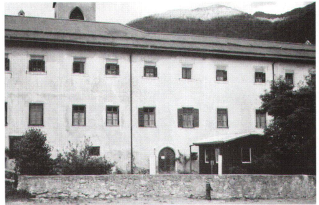
Abb. 6 Müstair, Kloster St. Johann. Westfassade, Ausschnitt mit Klosterforte.