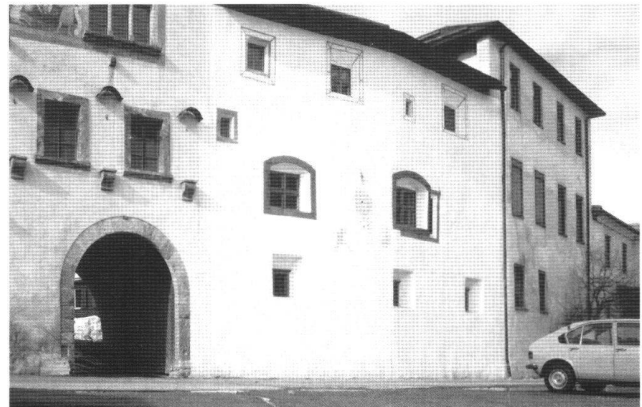
Abb. 9 Müstair, Kloster St. Johann. Südtrakt nach der Restaurierung.