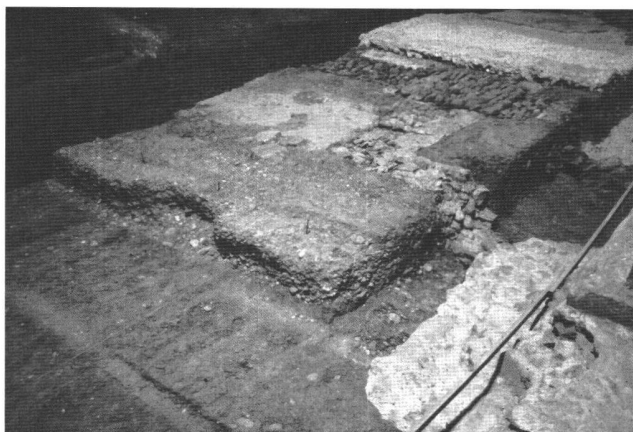
Abb. 1 Basler Münster. Archäologische Schichten im Mittelschiff. Links vorn Negative von Unterlagsbalken und Bretterboden eines über 30 m langen Militärgebäudes aus dem späten 1. Jahrhundert vor Christus. Darauf Strassenkies, an den ein Lehmniveau der Siedlungszone anschliesst. Ein Mauerwinkel durchschlägt diesen Lehm: Es ist eine Kellermauer aus dem 1. Jahrhundert. Dahinter Kieselmauer eines grossen spätromischen Gebäudes und darauf Rest des Mörtelbodens aus dem 11. Jahrhundert.