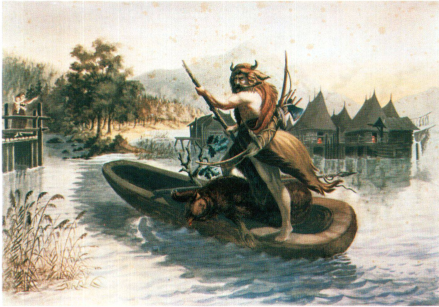
Abb. 2 Jägers Heimkehr in der Pfahlbauzeit, von Johann Gottlieb Hegi, 1865. Aquarell auf Karton. Mit dem Kind im Arm erwartet die Frau ihren Mann. Sempach, Privatbesitz.