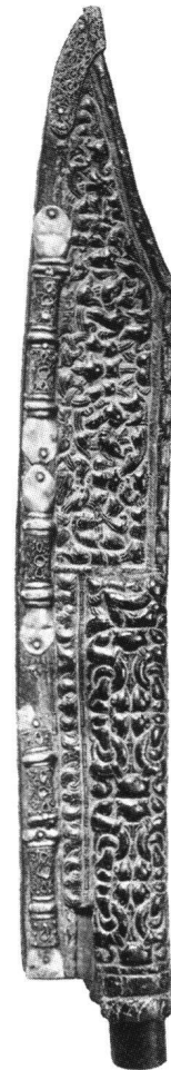
Abb. 7 Sogenanntes Jagdmesser Karls des Grossen mit Scheide. Klinge angelsächsisch oder skandinavisch, 8.–10. Jh. Aachen, Domschatz.

Was bedeuten schliesslich die Messer in den Händen Josephs und der Könige?