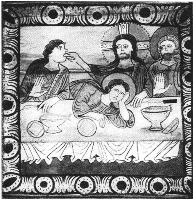
Abb. 8 Judas beim Abendmahl. Tafel 137 der Decke in Zillis.

schwingt, auch wenn die drei Geisselschnüre nicht sichtbar sind, entweder weil sie ausserhalb des Bildes zu denken oder sonst wie verdeckt sind. Dass Joseph hier auf einer Bank «thront» – so Erwin Poeschel –, scheint keine besondere Bedeutung zu haben; auch Maria steht bei der Spinnarbeit (Tafel 55) vor einer ähnlichen Bank. Tafel 80 (Abb. 3) zeigt die Szene, in der Joseph im Traum vom Engel zur Flucht nach Ägypten aufgefordert wird. Joseph,