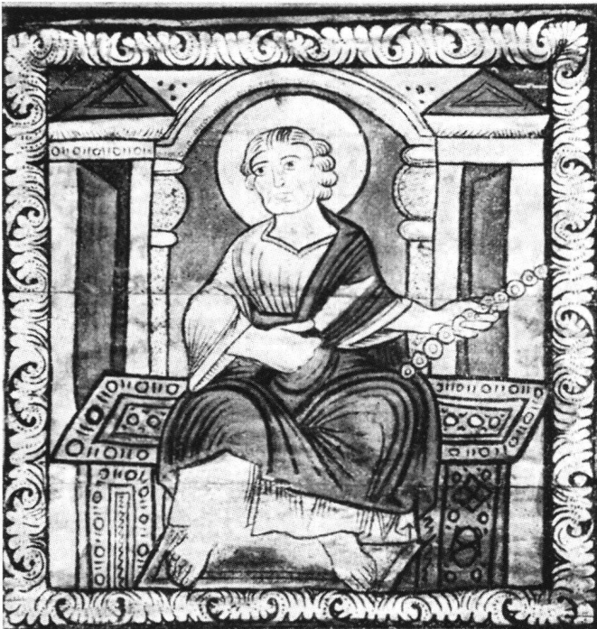
Abb. 2 Joseph bei der Geburt Christi. Tafel 62 der Decke in Zillis.

Eine andere Ansicht vertritt Suzanne Brugger-Koch in ihrer Dissertation. 14 Sie sieht die Könige als Teil der Dreikönigsgeschichte, die an der Decke von Zillis in der Folge auffallend ausführlich erzählt wird. 15 Sie weist hin auf die Dreizahl und auf die zeigenden Finger, die als syrisch-südgalisches Motiv bekanntermassen zur Ikonographie der Magier, die den Stern erblicken, gehören. 16 Auch betont sie die Ähnlichkeit dieser Figuren mit jenen drei Königen,