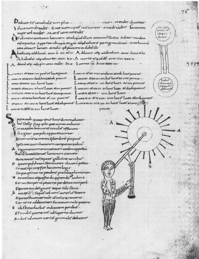
Abb. 10 Darstellung des Gebrauchs eines Sehrohrs zur Beobachtung der Sterne zur Zeitbestimmung (horologium nocturnum) und eine schematische Zeichnung, s. Detail Abb. 11. Manuskriptseite aus der Handschrift Vat. Lat. 644, fol. 76r. Rom, Biblioteca Apostolica Vaticana.

Bemerkenswert ist auf alle Fälle, dass das Zillis-Gerät funktionell einem «offenen» Sehrohr entspricht. Sehrohre (fistulae), also Rohre ohne optische Linsen oder Spiegel, wurden im Mittelalter als dioptra, als eine Art Visier, zu mancherlei Zwecken gebraucht. 49 Das Sehrohr diente auch