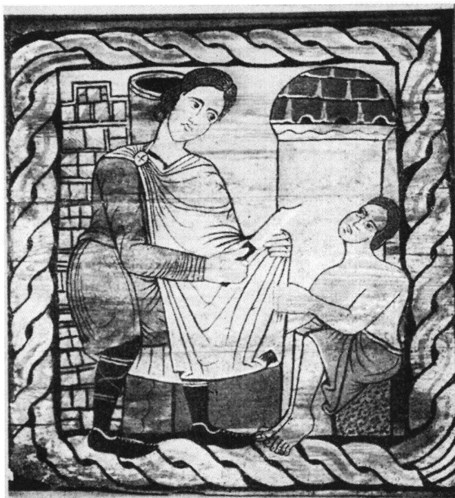
Abb. 5 Der Heilige Martin und der Bettler. Tafel 148 der Decke in Zillis.