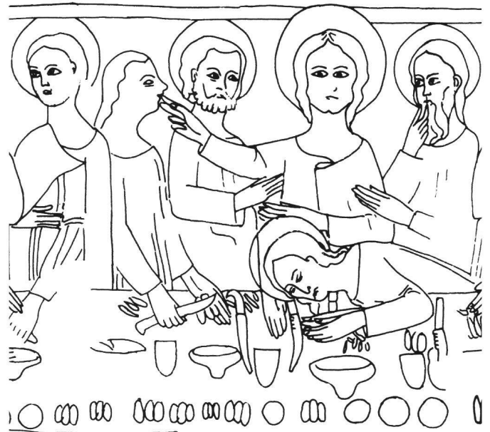
Abb. 9 Das Abendmahl. Umzeichnung des Wandgemäldes in der St. Gall Kapelle in Medel GR (vgl. Abb. 6).

Unterstützt wird diese These zusätzlich durch die Attribute, die dem dritten König auf Tafel 51 (Abb. 1c) beigege-