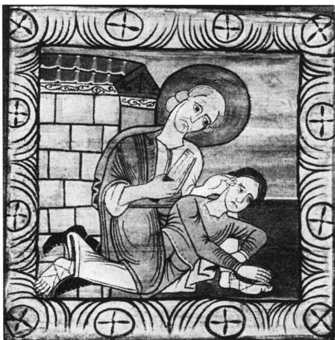
Abb. 4 Petrus schlägt Malchus das Ohr ab. Tafel 141 der Decke in Zillis.

mals vor, unter anderem zweimal als Attribut von Joseph (Abb. 2 und 3). Erwin Poeschel interpretiert sie auch in diesem Zusammenhang als Beschneidungsmesser. Sollte diese Deutung zutreffen, so stellen sich aber gleich die Fragen: Warum fehlt das Messer bei der ersten Darstellung Josephs auf der Tafel 56, aus welchem Grund erscheint es aber beim «thronenden» Joseph auf Tafel 62 (Abb. 2), und vor allem was soll das Beschneidungsmesser in der Hand des schlafenden Joseph mit dem Engel auf Tafel 80 (Abb. 3) bedeuten? 22 Wenn man Suzanne Brugger-Kochs Argumentation bezüglich der Könige nur deshalb nicht akzeptiert, weil sie «keine einleuchtende Erklärung» 23 für