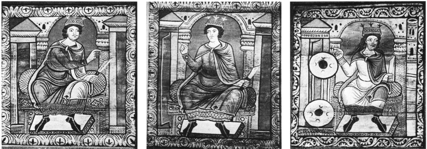
Abb. 1 Die drei thronenden Könige. Tafeln 49 bis 51 der bemalten Decke in der Kirche St. Martin in Zillis.

teiligt war, hat die Tafeln damals in eine neue Reihenfolge gesetzt und sie nummeriert. Mit Bezug auf die erwähnte Interpretation kamen die drei Könige an den Anfang des Zyklus und erhielten die Nummern 49 bis 51. Die folgenden Tafeln 52 und 53 sieht er als Personifikation von «Synagoge und Ecclesia», «die von den alttestamentlichen Königen zu den Ereignissen der Evangelien überleiten sollen». 3