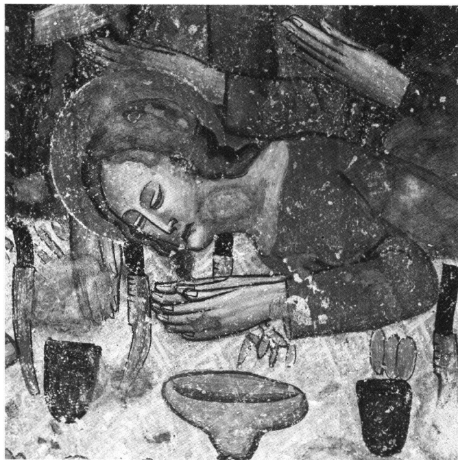
Abb. 6 Das Abendmahl. Wandmalerei, 14. Jh. Ausschnitt aus dem Wandgemälde in der St. Gall Kapelle in Medel GR.

Wie das Messer gebraucht wurde, ist in der Bilderfolge der Zilliser Decke an mehreren Orten zu beobachten. Auf den beiden Tafeln mit der Abendmahlsszene (Tafeln 136 und 137) liegen die mitgebrachten Messer auf dem Abendmahlstisch. Judas, ohne Nimbus und mit dem Bissen im