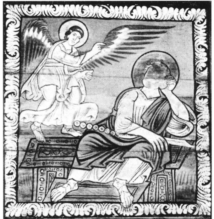
Abb. 3 Josephs Traum (Mahnung zur Flucht). Tafel 80 der Decke in Zillis.

Letzterer sieht aber auf Tafel 51 den König Salomo, den der beigegebene Turm als Tempelbauer ausweist, wobei die Scheiben und Stangen eventuell eine Seilwinde darstellen könnten, und demzufolge Rehabeam auf Tafel 50.