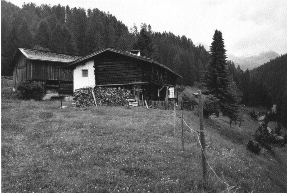
Abb. 4 Das Haus «Auf dem Wildboden» am Eingang des Sertig-Tals bei Davos, wo Kirchner 1923–1938 wohnte und arbeitete.

graph Balthasar Burkhard mit grossformatigen Aufnahmen der Bergwelt. Ebenso wichtig wäre eine verstärkte Präsentation in der nationalen Museumslandschaft. Noch immer gilt das Kirchner Museum manchem als «Museum