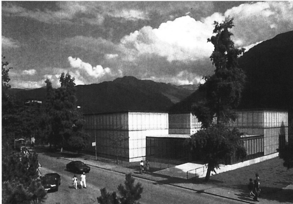
Abb. 2 Kirchner Museum Davos. Der Museumsbau von Annette Gigon und Mike Guyer aus dem Jahr 1992.

Wie ein Solitär ragt das Museum aus der Struktur des traditionellen Kur- und Wintersportortes heraus. Synergie- und Mitnahmeeffekte wie in historischen Innenstädten und grossen Kunstmetropolen sind hier nicht zu erwarten. Das Besucherpotential der 13 000-Einwohner-Stadt ist begrenzt, viele Einheimische waren noch nie im Kirchner Museum, manche kennen es gar nicht. Zürich und andere Ballungsräume sind zweieinhalb Autostunden oder mehr entfernt,