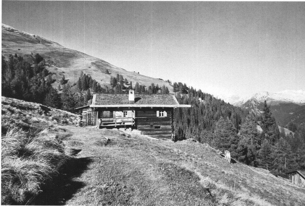
Abb. 3 Kirchners Hütte auf der Stafelalp bei Davos.

von den Touristenströmen profitieren kann. Andererseits könnte die Verwaltung von «Davos Tourismus» versuchen, durch das Herausstellen des Faktors «Kunstmuseum» oder «Kulturlandschaft» eine anspruchsvollere Zielgruppe anzusprechen. Vor diesem Hintergrund ist die Tendenz einiger Wintersportorte zur «Ballermannisierung» mit Skepsis