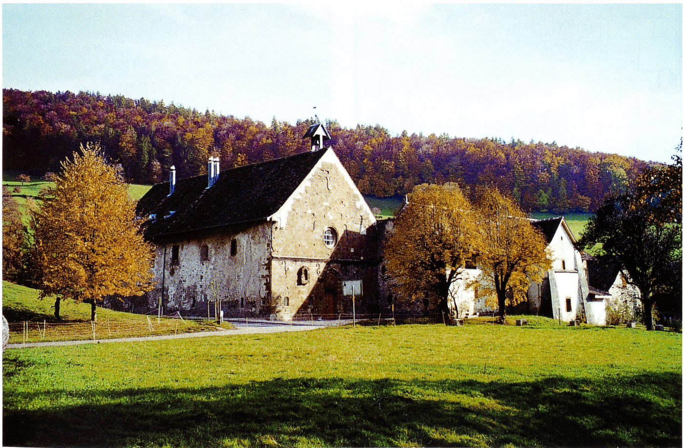
Abb. 1 Schönthal in Langenbruck.

An der alten, heute wenig befahrenen Passstrasse von Langenbruck nach Eptingen tritt uns in einem lieblich gelegenen Seitental, am Südhang des Hauensteins, das Kloster Schönthal entgegen (Abb. 1 und 2). Die Westfront der Klosterkirche, «ein Prunkstück romanischer Architektur» 2 , ist die älteste erhaltene Gebäudefassade des Kan-