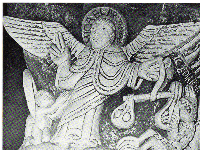
Abb. 8 Chauvigny, Saint-Pierre, Kapitell in der Apsis der Kirche: Der Erzengel im Kampf gegen den Teufel.

Gestalt wird – obwohl an sich auch ohne die Inschrift HIC EST DIABOLUS als Teufel zu erkennen – mit der gleichen Eindringlichkeit lokalisiert wie der Löwe am Schönthaler Portal: der betont hinweisende (deiktische) Charakter der Inschriften hebt die beiden diabolischen Figuren, auf die sie zeigen, 20 besonders eindrücklich hervor. In beiden – sehr ähnlichen – Fällen hat der Hinweis HIC EST [...] die magische Kraft eines Bannspruches: die Lokalisierung des zu bannenden Bösen ist bereits Teil des Kampfes gegen das Böse und trägt schon zu dessen Überwindung bei.