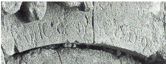
Abb. 6 Löwe am linken Bogenansatz mit schwach erkennbarer Inschrift: HIC EST RODO(S).

dualisiert wiedergegeben und tragen schon deshalb keine Eigennamen.