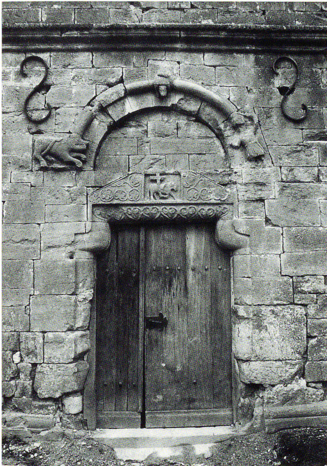
Abb. 4 Tympanon des Westportals mit Ornament und Figuren.

Dieses Schauspiel ist, hier sind sich die Interpreten der Fassadensymbolik fast ausnahmslos einig, 9 als der ewige Kampf zwischen zwei grossen Mächten dieser Welt, zwischen Gut und Böse, zu deuten. Das Böse wird durch