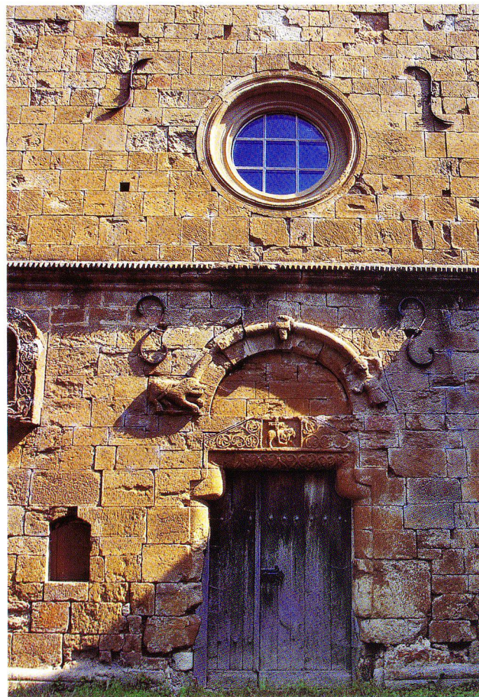
Abb. 3 Klosterkirche, Westportal mit Figuren und Ornament im Tympanon.

das Kloster rund 340 Jahre nach der Weihung, nach einigen Jahrhunderten mönchisch-religiösen Lebens in seinen Mauern, von einheimischen Bauern geplündert, verwüstet 6 und dann im Jahre 1529 – als Folge der Basler Reformation – aufgehoben worden ist. In der Folgezeit, so berichten die Annalen, wurde das Kloster als Sennhof ver-