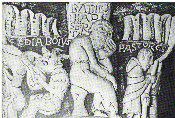
Abb. 7 Chauvigny, Saint-Pierre, Kapitell in der Apsis der Kirche mit Teufel, Babylon und Hirten.

Ohne diese Abweichungen bagatellisieren zu wollen, ist doch zu fragen, mit welchem Genauigkeitsmassstab wir die Arbeit unseres mittelalterlichen Schreibers/Steinmetzen von Schönthal zu beurteilen haben. Er war wohl, wie oben vermutet, ein nicht ungebildeter, weltoffener Mönch/Steinmetz, hat jedoch aller Wahrscheinlichkeit