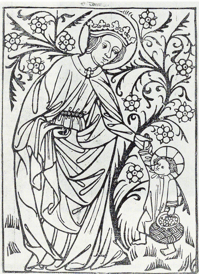
Abb. 2 Heilige Dorothea, Holzschnitt aus einer Handschrift aus St. Zeno bei Reichenhall von 1410, aus: Brockhaus Enzyklopädie, Bd. 8, Wiesbaden 1969, S. 642.

Zum Bild selbst meinen Rapp Buri und Stucky-Schürer: «Auch wenn der Inhalt des Zwiegesprächs unlesbar ist, so deuten die Gesten der zwei Figuren darauf hin, daß der Knabe seiner Dame als Zeichen der Verehrung Blumen darbringt.» 3 Natürlich handelt es sich auch bei dieser Aussage lediglich um eine Vermutung. Von einem nicht entzifferbaren Text kann niemand wissen, wie er gemeint war, ob er beispielsweise als Teil eines Zwiegesprächs zu lesen wäre; und Verehrung ist auch nicht der einzige mögliche Grund für die Übergabe von Blumen.