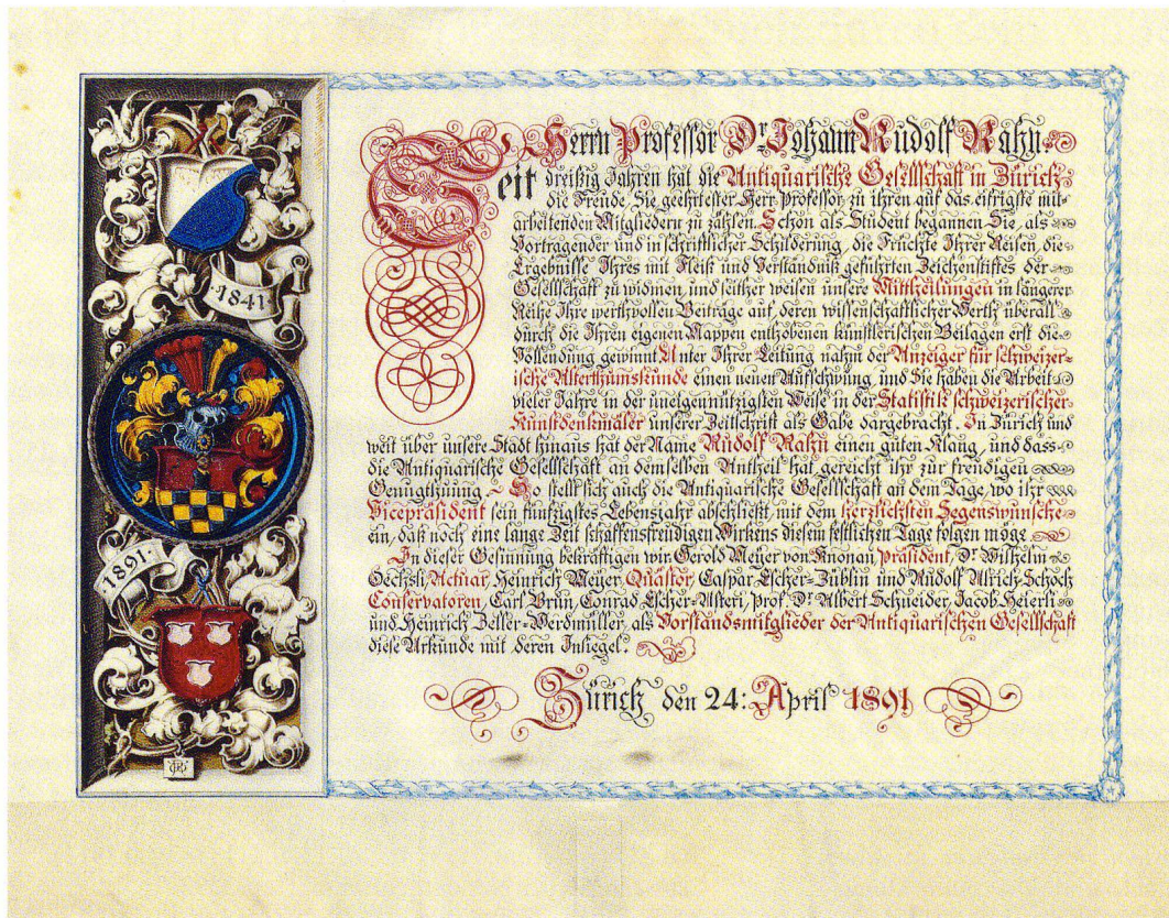
Abb.6 Ehrenurkunde für Johann Rudolf Rahn zu seinem 50. Geburtstag, 1891, Geschenk des Vorstandes der AGZ, Zentralbibliothek Zürich, FA Rahn 1470d.

Winterthur diskutiert. Da die Abbildungen den Vizepräsidenten nicht zu überzeugen vermochten, gab er zu Protokoll, «dass solches Gfätterlzeug durch eine wissenschaftliche Gesellschaft nicht subventioniert werden» dürfe. 40