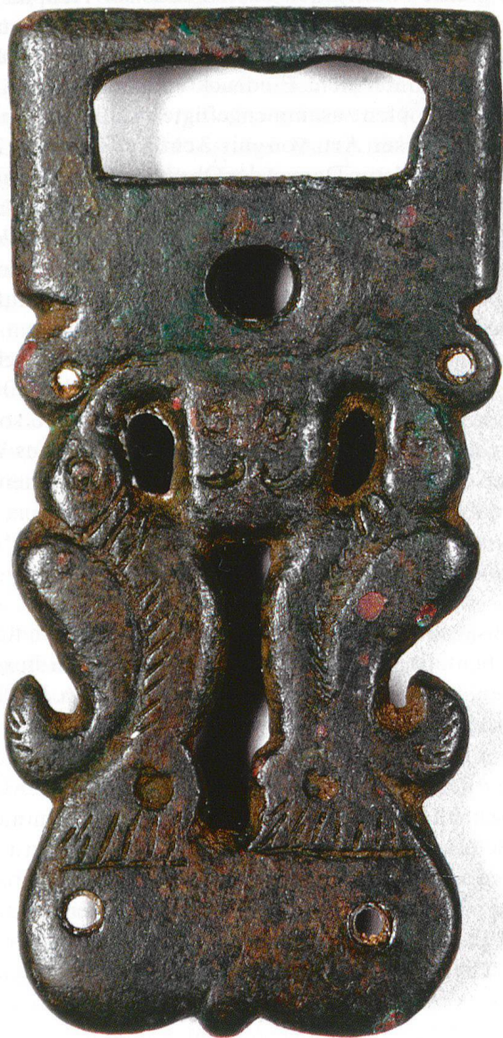
Abb. 5 Zwei Otter mit Fischen. Gürtelschnalle. Burgund.

verstärkt. Die Schnalle widerspiegelt auf diese Weise sogar die «Menschlichkeit» der Otter (Aufrechtsitzen, Fressgier, Zopf), die ja bei den Tieren selbst zu beobachten ist, wie ein Blick in «Brehms Tierleben» lehrt, und die auch noch in der schriftlichen Fassung der Sage lebt, die erzählt, wie der Otter am Ufer sass und «mit halb geschlossenen Augen» ass. 16