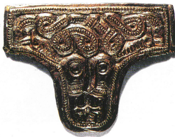
Abb. 3 Zwei Eberköpfe als ein Gesicht. Pressblechmodel. Museum Wiesbaden.

Ähnliche Such- oder Vexierbilder findet man in dieser Zeit des Öfteren, beispielsweise auf einem Pressblechmodel aus Worms-Abendorf, wo zwei Köpfe von Eberschlangen – ebenfalls mit einem Band in der Kopfmitte als Abschnittsbetonung –, wenn man sie zusammensieht, das Antlitz eines Gottes ergeben (Abb. 3). 8