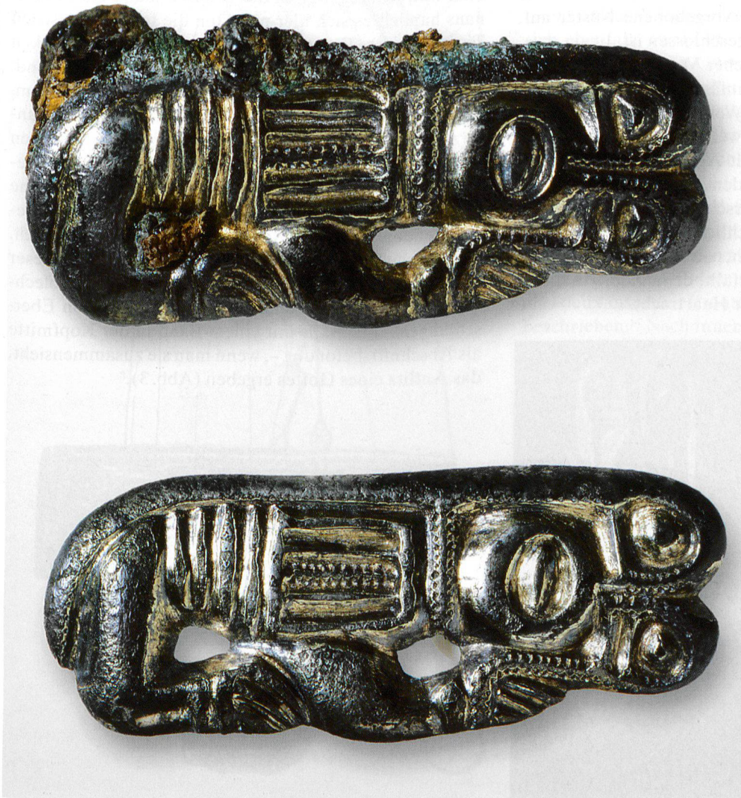
Abb. 1 Zwei Otter. Kleinfibelpaar. Historisches Museum, Basel.

Die beiden Spangen stellen kauernde Tiere dar und wurden deswegen stets als «Kleintierfibel-Paar» bezeichnet. Am Kopf erkannte man vor dem riesigen Auge eine merkwürdige, schnabelartige Schnauze» oder auch einen «eigenartig gerollten Schnabel». 3 Die nahezu birnenförmige Schulter und die senkrechten Rippen über dem