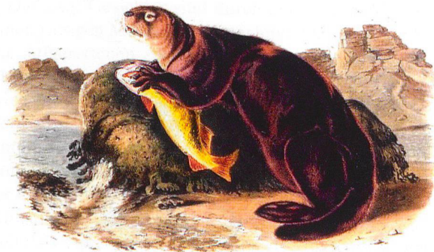
Abb. 6 Seeotter mit Lachs. Zeichnung von J.J. Audubon, 1842.

Die burgundische Schnalle hat mit den Basler Spangen nicht nur die Figur des Otters gemein, sondern auch, mit Blick auf das Ganze, ein grosses Haupt, das in diesem Falle auf durchbrochener Arbeit beruht. Auch hier ist der Kopf deutlich beabsichtigt, denn wenn der Spalt zwischen den Tieren – als Nase erkennbar – noch zufällig sein mag, so ist die Verzerrung des Mundes als Ausdrucksmittel des Entsetzens sicherlich absichtlich und nicht zufällig. Das Gesicht erscheint als offener Hintergrund in der «figure-ground perception», zu der auch die