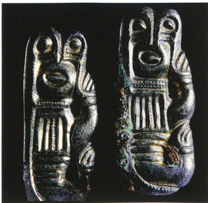
Abb. 2 Zwei Otter (wie Abb. 1). Historisches Museum, Basel.

Will man nicht in bedenkllicher Verfahrensweise dem Künstler darin ein Versehen anlasten, gilt es, eine andere Sichtweise einzunehmen. Werden die Spangen nach links gedreht, blicken einen zwei menschliche Gesichter an, ein menschlicher Arm mit Armband und Hand erhebt sich, und das Feld mit den vier jetzt senkrechten Rippen sieht wie ein vorne verschliessbares Gewand aus (Abb. 2). Dass der Kopf tatsächlich senkrecht anzusehen ist, bestätigt der Zopf, der rechts als zweifaches Perlband vom Kopf zur Hand herunterfällt, denn Zöpfe in dieser Lage gehören zu menschlicher Haartracht.