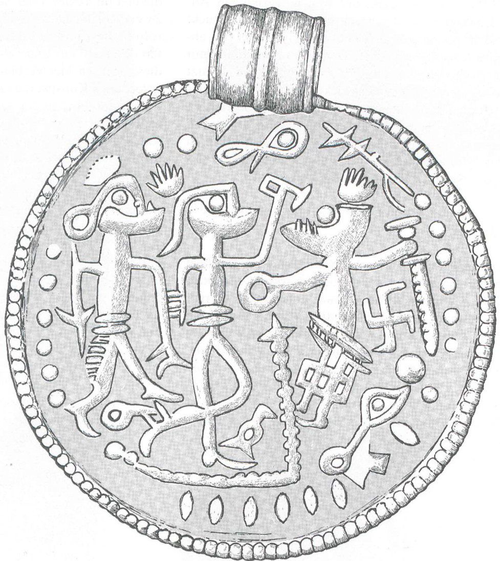
Abb. 8 Wodan, Balder, und Loki mit dem Otter. Brakteat-Goldanhänger. Gummerup, Dänemark.

te sich an, diesen zu fressen. Loki warf mit einem Stein nach dem Tier und traf damit den Otter am Kopf, sodass dieser tot hinfiel. Loki frohlockte über seine Beute, da er sowohl den Lachs wie auch den Otter mit einem Wurf bekommen hatte. Die Götter gingen dann weiter und kamen zu Hreidmars Hof, wo sie um Nachtquartier baten. Essen hätten sie genug, sagten sie und zeigten den Lachs und den Otter vor. Der Otter aber war Hreidmars Sohn Otr. Der Vater rief deshalb seine beiden anderen Söhne, Fafnir und Regin, herbei, und zusammen schlugen sie die Götter in Fesseln. Sie bestimmten als Lösegeld, dass Otrs Fell, das sie ihm nun abzogen, mit Gold zu füllen und mit Gold zu bedecken sei.