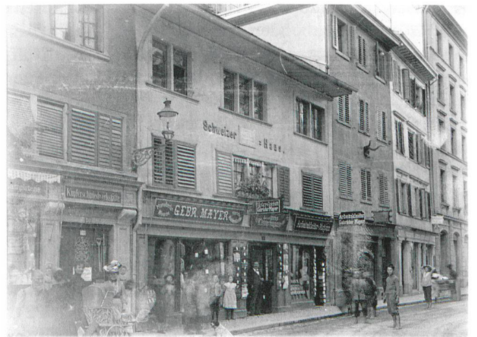
Abb.4 Anton Graffs Geburtshaus in der Winterthurer Altstadt, Untertor Nr. 8, Aufnahme um 1890.