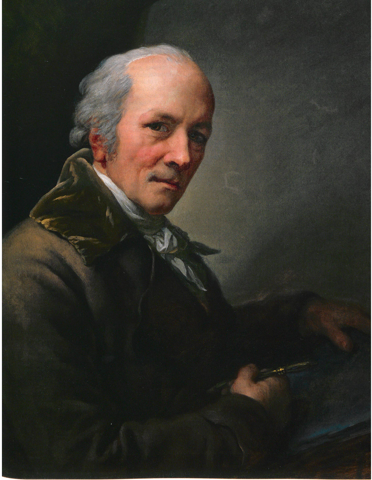
Abb. 14 Selbstporträt 1805, Öl auf Leinwand, 69,5 × 56,5 cm, rückseitig bezeichnet: «A Graff pinx 1805», Museum Oskar Reinhart, Winterthur, Depositum der Stadt Winterthur.