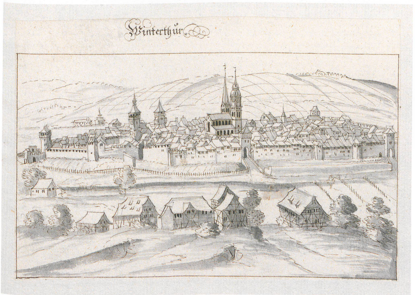
Abb. 1 Stadt Winterthur, Blick vom Heiligberg, anonym. Feder auf Papier, 10,4 × 17,8 cm (Bild), 20,8 × 36,0 cm (Blatt), in: JOHANN FRIEDRICH MEYSS, Lexicon Graphico Heraldico-Stemmatographicum urbis et agri tigurini , Bd. 7, 1743. Zentralbibliothek Zürich, Ms E 59, vor S. 615.

Graff-Saal genannten Raum im Kunstmuseum Winterthur sind heute vorwiegend Nachimpressionisten ausgestellt. Doch nicht nur die Bildsprache und Darstellungsweise Graffs sind für etliche Betrachtende heute nicht modern genug; auch die damals gesprochene und geschriebene Sprache ist für viele kaum mehr verständlich, wie ein Blick auf die erste biografische Skizze von Hans Heinrich Heidegger 1768 (Abb. 2) verdeutlicht. 2 Schon die Schreibweise und Aussprache des Namens bereiten Mühe.