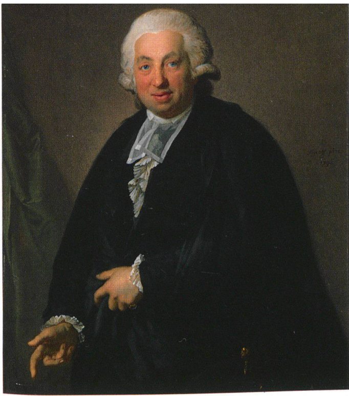
Abb. 12 Salomon Hegner, von Anton Graff. Öl auf Leinwand, 108,5 × 87,5 cm. Winterthur, Rathaus.

gestellt wurden. 34 In erster Linie sind die Schultheissenporträts zu nennen, die zunächst die Bibliothek im Rathaus und ab 1842 die neue Bibliothek im ersten Stock des Knabenschulhauses schmückten, bis der Anton Graff-Saal im neuen, 1916 eröffneten Kunstmuseum viele Gemälde Graffs im öffentlichen Besitz vereinigen konnte (Abb. 11). 35