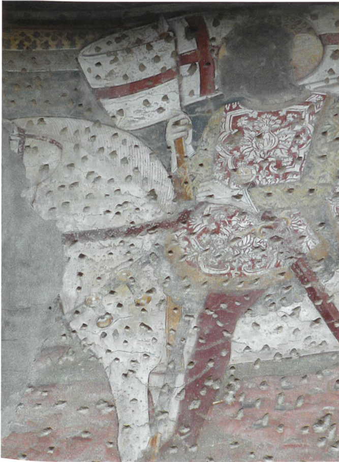
Fig. 22 Maestro anonimo, San Vittore a cavallo, fine XV secolo, Moleno, chiesa di san Vittore Mauro.