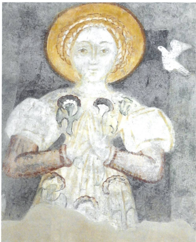
Fig. 20 Maestro anonimo, Santa Caterina d'Alessandria, prima metà XV secolo, Cademario, chiesa di sant'Ambrogio vecchio.