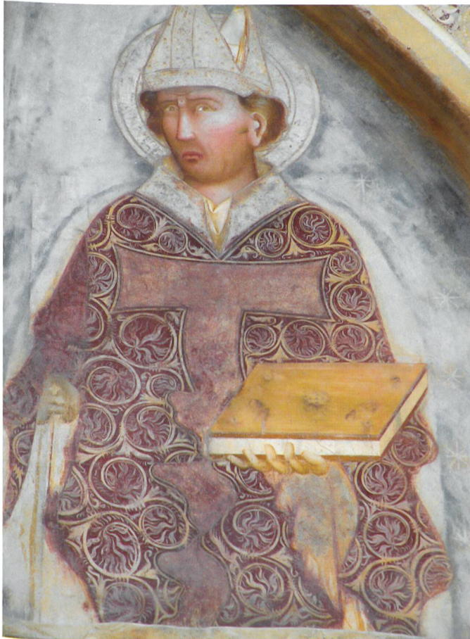
Fig. 7 Maestro di san Biagio, San Biagio, 1360 ca., Ravecchia, chiesa di san Biagio.