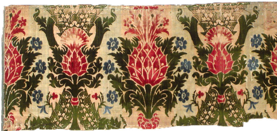
Fig.25 Manifattura italiana, Frammento di velluto , ultimo quarto XV secolo, Prato, Museo del Tessuto.

dei tessuti pregiati nell'abbigliamento contribuivano poi la foggia bipartita , le fodere e i bordi in pregiata pelliccia, i galloni dorati applicati lungo lo scollo e i polsini e le lunghe sequenze di bottoni, tutti elementi che diedero vita – citando la frase formulata da Bruno Toscano per la coeva pittura umbra – «a quel panorama piuttosto affollato di protomartiri sorpresi a vestirsi presso gli ultimi farsettai tardogotici». 56