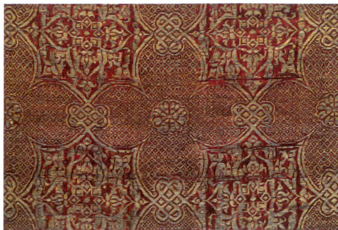
Fig.2 Manifattura spagnola, Frammento della casula di san Venceslao, prima metà XIV secolo, Praga, cattedrale di san Vito.

Tra le molteplici tipologie di vesti in stoffe preziose affrescate nell’area del Canton Ticino dalla metà del XIV alla fine del XV secolo testimonianza più antica è quella che si rintraccia nella chiesa leventinese di sant’Ambrogio a Chironico. Fu lo stesso Maestro Petruspaulus, incaricato della decorazione pittorica dell’edificio da poco ricostruito e ampliato, ad apporre all’innesto del catino absidale meridionale la scritta con il suo nome, la pro-