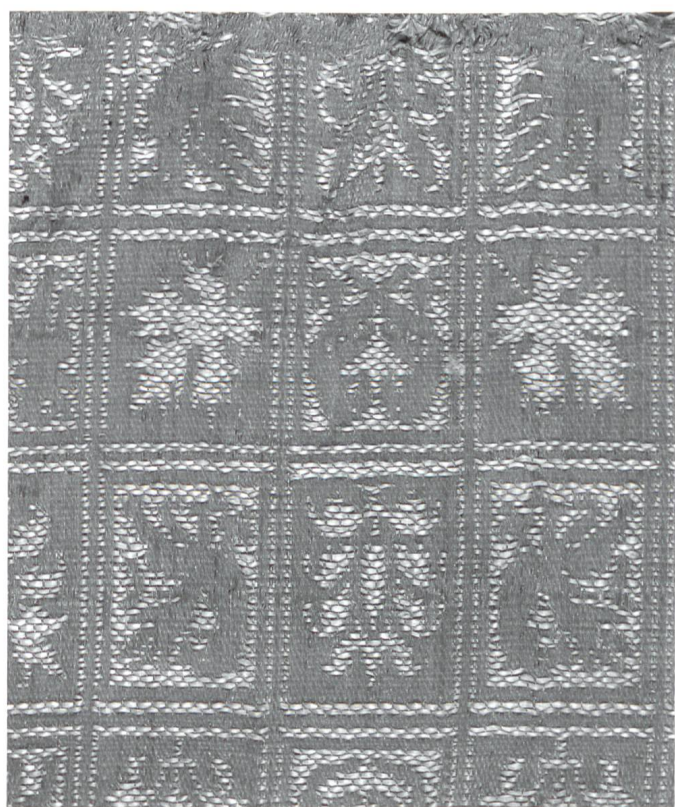
Fig. 19 Manifattura italiana, Frammento di lampasso, seconda metà XIV secolo, Norimberga, Germanisches Nationalmuseum.