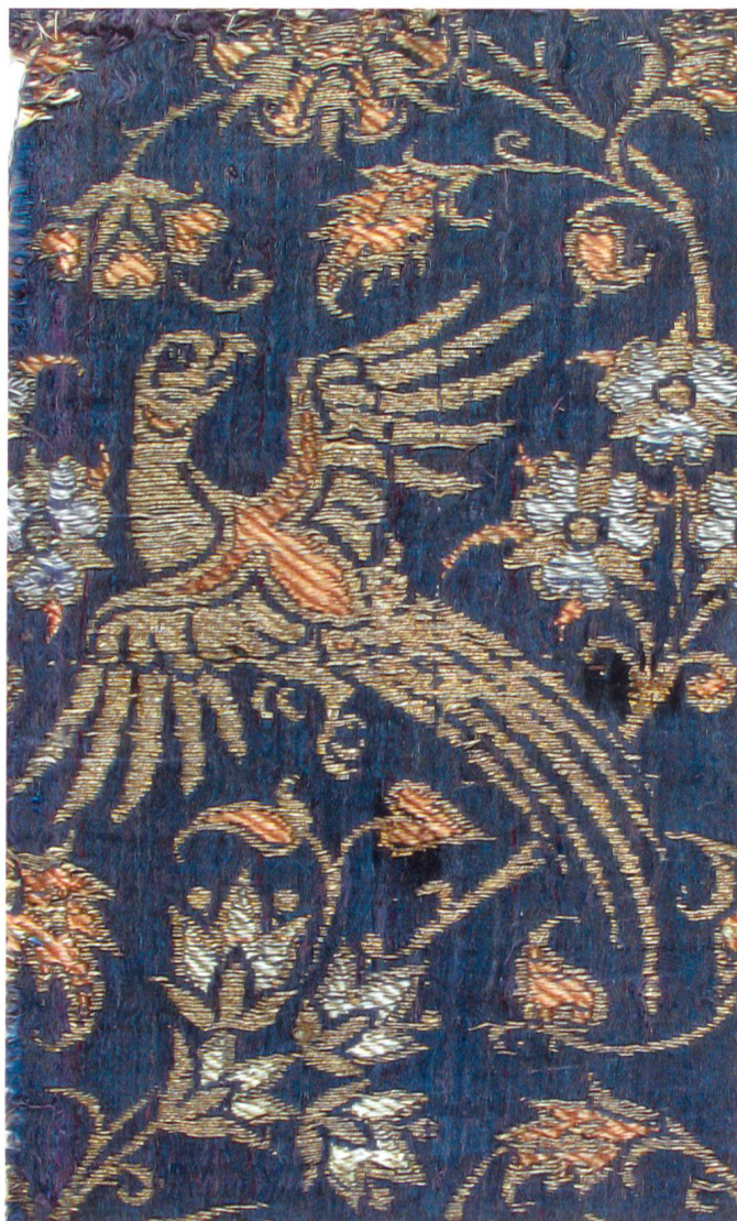
Fig. 16 Manifattura lucchese, Frammento di lampasso, seconda metà XIV secolo, New York, The Metropolitan Museum of Art.

sacrificio che Cristo dovrà subire per la salvezza degli uomini, proprio in quest'epoca si era andata affermando l'iconografia della Vergine con il Bambino in grembo che tra le dita tiene un pennuto al quale era da attribuire, in relazione alla specie, un preciso significato allegorico. Secondo la tradizione medievale il cardellino, in latino detto carduelus per la peculiarità di cibarsi di cardi, era da interpretare come un richiamo alla corona di spine che fu posta sul capo di Gesù durante la Passione 41 , mentre una leggenda popolare tramandava che il piumaggio rosso-arancio del pettirosso fosse dovuto a una spina sfilata dalla corona di Cristo che ne aveva macchiato il petto con il sangue divino. 42