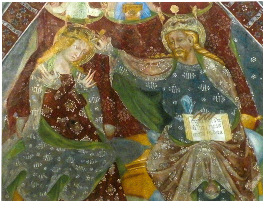
Fig. 13 Maestro di santa Maria in Selva, Incoronazione della Vergine, 1401, Locarno, chiesa di santa Maria in Selva.

ce del Redentore – suo attributo per averla ritrovata sul monte Golgota – abbigliata con una veste punteggiata dalla lettera Y. Sul fatto che per la sua valenza grafica la lettera dell'alfabeto sia da intendere quale allusione a Cristo non sembrano quindi sussistere dubbi; ipotesi del resto avvalorata da alcuni testi tre e quattrocenteschi dove il nome di Gesù figura scritto nella forma «Yesu» o «Yeshu».