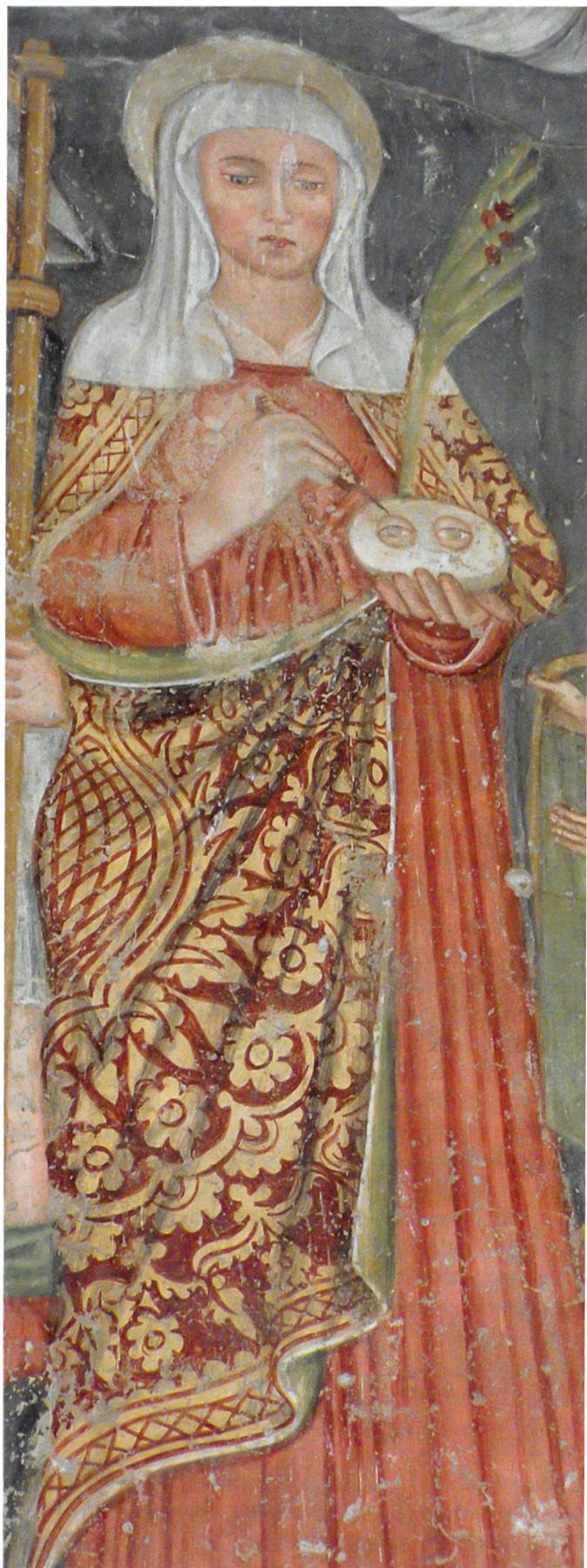
Fig. 24 Maestro anonimo, Santa Lucia, XVI secolo, Villa Lughese, chiesa di santa Maria Assunta.

si apprestavano a riprodurre, in maniera più o meno puntuale, nelle loro opere. L'importanza attribuita in epoca medievale e rinascimentale alle stoffe lussuose è testimoniata, oltre che dalle pressanti richieste della classe dominante per la confezione di abiti e l'arredamento delle loro dimore, dalla funzione svolta in ambito ecclesiastico, dove le sfarzose e scintillanti sete dei paramenti liturgici erano concepite quali strumenti per manifestare in maniera tangibile la gloria di Dio. Questo concetto aveva origini lontane nel tempo e nello spazio. Fu infatti tra il IV e il V secolo che a Bisanzio i ricchi drappi, in precedenza esclusivamente riservati alla complessa etichetta di corte, assunsero un ruolo fondamentale nella celebrazione dei riti liturgici. L'acquisizione da parte del clero di una pratica imperiale era da ricondurre allo stretto rapporto che univa i due mondi: se la Chiesa accoglieva l'uso regale dei tessuti per connotare la sacralità dello spazio e delle cerimonie, è altresì vero che ammantandosi con splendide sete l'imperatore bizantino manifestava pubblicamente il suo ruolo di rappresentante terreno di Dio. In entrambi i casi i manufatti tessili avevano il compito di palesare, a un primo e superficiale colpo d'occhio, l'autorità di chi deteneva il privilegio di potersene adornare, suscitando nello spettatore un immediato moto di reverenza e devozione. 53