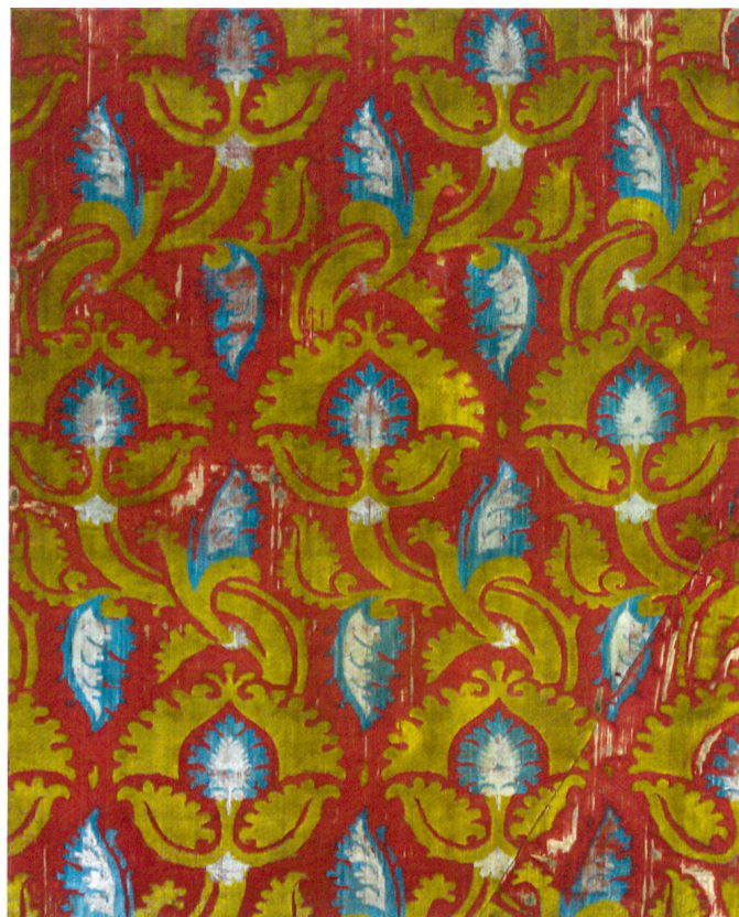
Fig. 21 Manifattura veneziana, Frammento di velluto, inizi XV secolo, Lione, Musée des Tissus.

i primi decenni del Quattrocento nella chiesa dei santi Lorenzo e Agata a Rossura (fig. 17). Tralasciando il mantello foderato in pregiata pelliccia, la gonnella bipartita – che trova un precedente nella santa Dorotea di Biasca – si presenta realizzata con una stoffa a elementi vegetali svolazzanti stilizzati su fondo bianco accostata a un lampasso vermiglio con rettangoli campiti da infiorescenze di sapore tartarico-orientale. La metà sinistra dell'abito è affine a un velluto italiano datato tra la fine del XV e gli inizi del XVI secolo (fig. 18), mentre il drappo serico con partito geometrico trova riscontro in una testimonianza tessile di produzione italiana risalente alla seconda metà del Trecento (fig. 19). 43 Se è difficile immaginare che una veste bipartita possa essere stata cucita abbinando due tessuti con consistenza così diversa – un velluto e un lampasso – è altresì vero che nella raffigurazione pittorica questo problema non si poneva. Inoltre, poiché il partito decorativo a racemi stilizzati risulta un unicum anche tra i velluti giunti sino a noi, non è da escludere che fosse utilizzato anche per i lampassi di cui non è sopravvissuto alcun frammento.