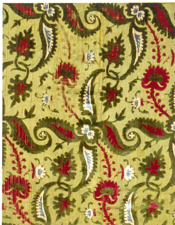
Fig. 18 Manifattura italiana, Frammento di velluto, fine XV-inizi XVI secolo, Lione, Musée des Tissus.