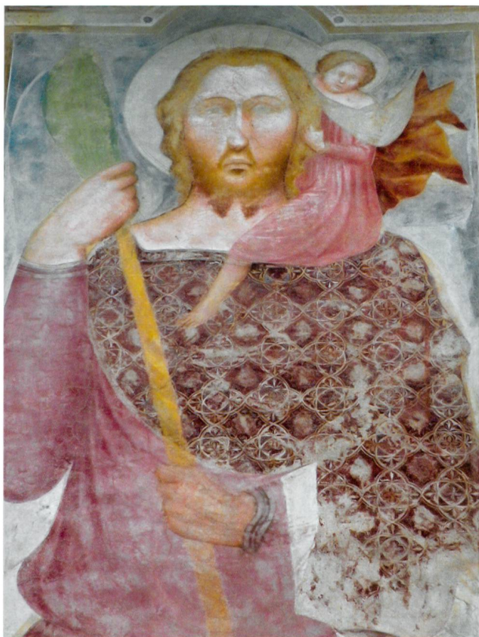
Fig. 5 Maestro di san Biagio, San Cristoforo, 1360 ca., Ravecchia, chiesa di san Biagio.

A distanza di neanche un ventennio nella chiesa bellinzonese di san Biagio a Ravecchia la gigantesca figura di san Cristoforo, sulla facciata esterna, e quella del patrono, dentro la lunetta sopra il portale, si presentano anch'esse abbigliate con vesti in pregiati drappi serici. Gli affreschi, datati intorno al 1360, sono stati attribuiti a un generico Maestro di san Biagio, artista di formazione lombarda che, attraverso la mediazione di Giovanni da Milano e Giusto de' Menabuoi, sembra aver accolto influenze giottesche rielaborandole in una complessa pittura pervasa da un'eleganza e da un lirismo di stampo gotico cortese. 19 Anche in questo caso la resa pittorica delle stoffe mostra una stretta attinenza con la realtà: il mantello di san Cristoforo (fig. 5) riproduce assai realisticamente un raffinatissimo tessuto a motivi geometrici di ascendenza islamica, tipico della produzione ispano-moresca della seconda metà del XIII secolo, come documenta un frammento rinvenuto nella tomba di Don