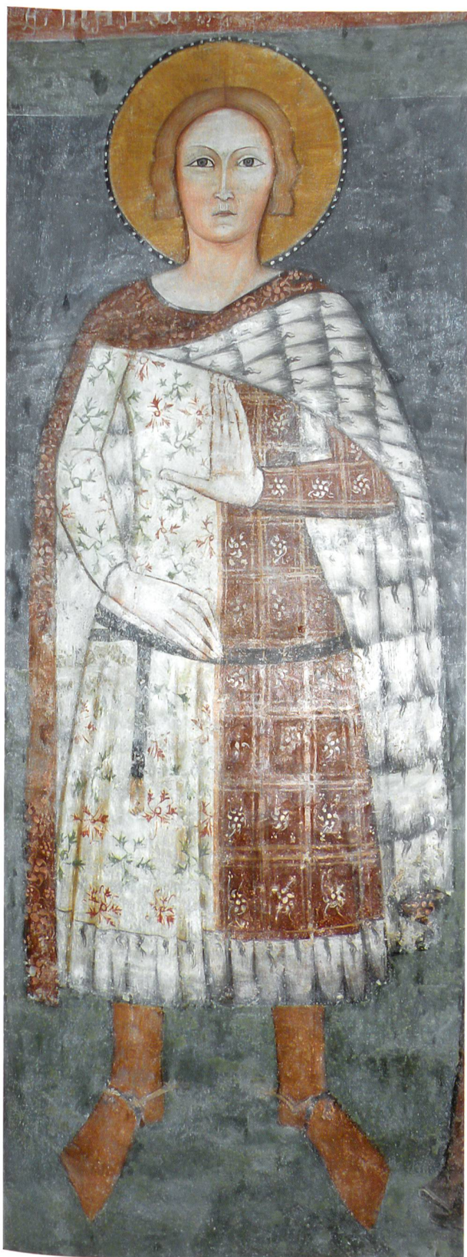
Fig. 17 Maestro anonimo, San Martino, primi decenni XV secolo, Rossura, chiesa dei santi Lorenzo e Agata.