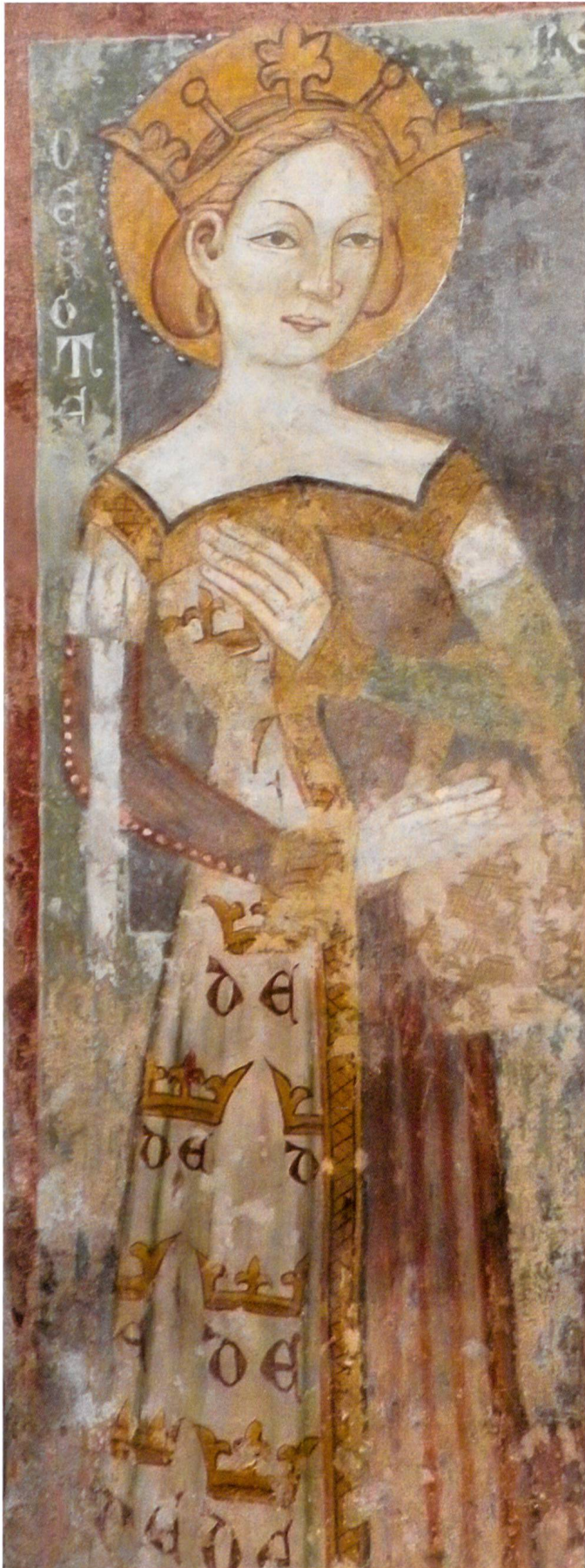
Fig.9 Maestro anonimo, Santa Dorotea, XIV secolo, Biasca, chiesa dei santi Pietro e Paolo.