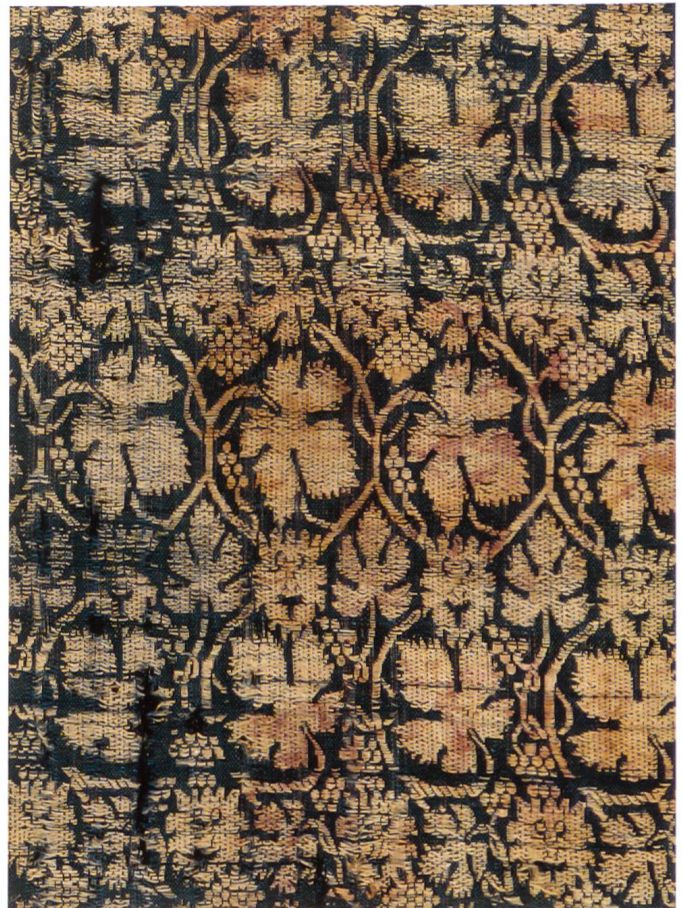
Fig. 8 Manifattura italiana, Frammento di lampasso, seconda metà XIV secolo, Riggisberg, Abegg-Stiftung.