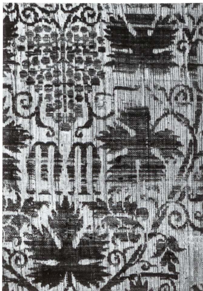
Fig. 14 Manifattura italiana, Frammento di lampasso, seconda metà XIV secolo, Berlino, Kunstgewerbemuseum.

Infine, nella scena con l' Incoronazione della Vergine , affrescata tra il 1400 e il 1401 dal raffinato Maestro di santa Maria in Selva sulla volta dell'omonima chiesa locarnese, il manto di Maria e la tunica di Cristo si presentano disseminati dall'iterazione della lettera M (fig. 13). Anche in questo caso sarà da considerare, non da ultimo in relazione alla componente francesizzante dell'artista 31 , la possibilità di un raffinato significato simbolico che sembra trovare la sua origine nel testo duecentesco Li abecés par ekivoche et li signification des lettres . Oltre a riferirsi all'iniziale del nome della madre del Salvatore, il carattere ripetuto sulla stoffa azzurra che ammantava la Vergine sarebbe da intendere quale allusione a «Marie, mère douce» 32 , simbologia che tra la fine del Trecento e gli inizi del Quattrocento trova un parallelo nella lettera figurata di Giovannino de' Grassi con la scena dell' Annunciazione 33 e in un gioiello in oro a forma di M con figurine a tutto tondo della Vergine e dell'angelo annunciante. 34 Lo stesso carattere disseminato sull'abito di Cristo sarebbe invece da interpretare, per il grafismo delle tre aste unite in un unico segno, come l'equivalente visivo dell'Essere Uno e Trino. 35 Tra le rare testimonianze di questa tipologia tessile, che doveva essere assai diffusa poiché