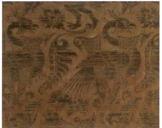
Fig.12 Manifattura italiana, Frammento di lampasso, prima metà XIV secolo, Norimberga, Germanisches Nationalmuseum.