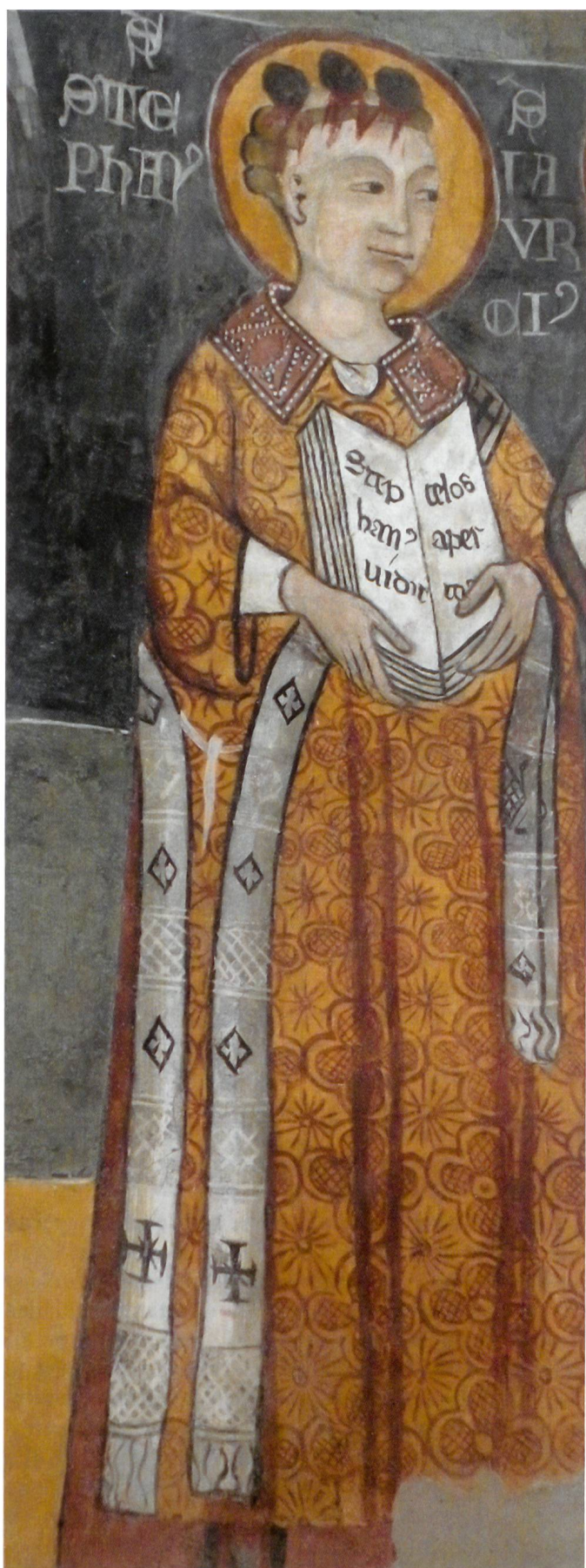
Fig.1 Maestro Petruspaulus, Santo Stefano, 1340–1341, Chironico, chiesa di sant’Ambrogio.

animato da fantasiosi elementi zoomorfi e fitomorfi di sapore naturalistico al quale attingere. Dai documenti risulta, infatti, che già agli inizi del Trecento l’industria tessile italiana aveva raggiunto un così alto livello d’imitazione dei «panni tartarici» da rendere difficoltoso distinguere un drappo d’importazione da uno realizzato a Lucca o a Venezia, all’epoca maggiori centri italiani produttori di sciamiti e lampassi. 10 A rendere ancora più complessa la questione delle attribuzioni contribuì, a partire dai primi decenni del Quattrocento, un sovertimento nel flusso degli scambi commerciali tra Europa e Medio Oriente musulmano. L’assenza di rinnovamento nell’arte della tessitura islamica e il sopraggiungere delle truppe mongole, che invasero la Siria e presero d’assedio Damasco nel 1401, comportarono il declino delle manifatture egiziane e siriane, provocando l’apertura dei mercati mediorientali ai raffinati prodotti occidentali. Dal canto loro i setifici italiani, che avevano conquistato i mercati europei grazie alla qualità dei loro velluti e alla continua innovazione tecnica e stilistica, s’impegnarono a favorire le esportazioni adattando sia le dimensioni delle pezze sia i motivi decorativi in modo da soddisfare appieno le richieste degli acquirenti ottomani; accorgimenti che all’epoca riscosero grande successo ma oggi rendono ancora più ardua la distinzione tra produzione europea e islamica. 11