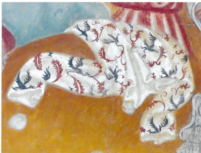
Fig. 15 Maestro anonimo, Crocifissione, prima metà XV secolo, Cademario, chiesa di sant'Ambrogio vecchio.

menzionata negli inventari e nelle leggi suntuarie volte a limitarne l'uso 36 , si annovera un frammento trecentesco di lampasso italiano ornato da foglie di vite e grappoli d'uva arricchite da coppie di lettere dell'alfabeto tra cui figura anche la M (fig. 14). 37