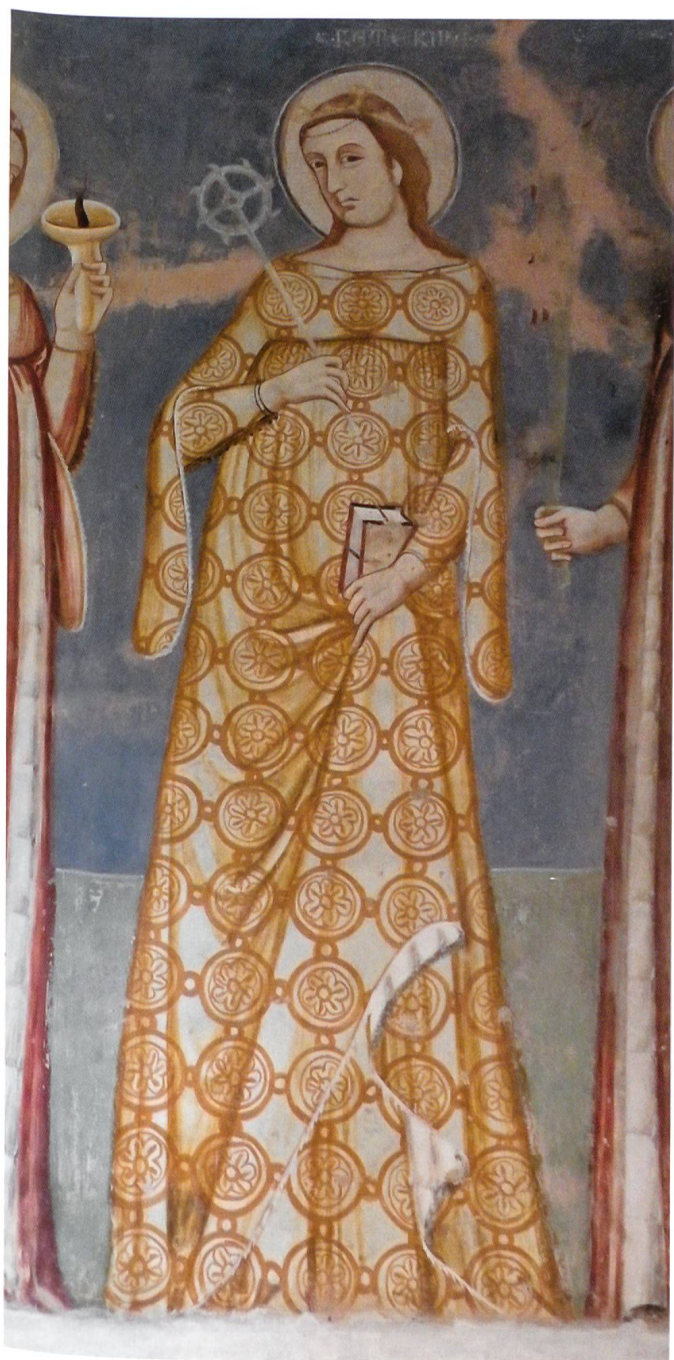
Fig. 3 Maestro di Castel San Pietro, Santa Caterina d'Alessandria, 1343–1345, Castel San Pietro, chiesa di san Pietro.

venienza dal borgo medievale di Menaggio e la data di esecuzione degli affreschi che, sebbene frammentaria, è stata ricondotta all'arco temporale compreso tra il 23 ottobre 1340 e il 28 giugno dell'anno successivo. 12 Dagli approfonditi studi condotti da Vera Segre dopo l'ultimo restauro delle pitture ad affresco, ultimato nel 2006, è altresì emersa la complessa personalità artistica del frescante, che nella conoscenza estremamente aggiornata delle novità culturali dimostra di valicare i confini della sua formazione comasca. Rivelatori in questo senso sono gli echi, a distanza di appena qualche decennio, della pittura assisiata e padovana di Giotto e le citazioni ico-