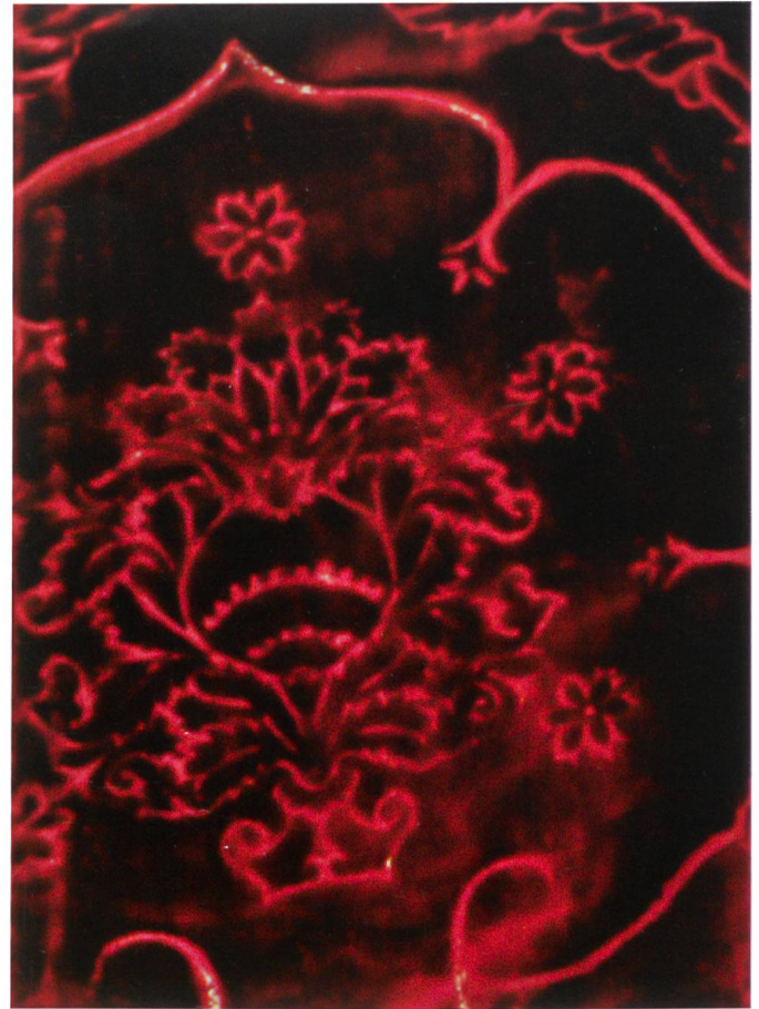
Fig. 23 Manifattura italiana, Pianeta in velluto, seconda metà XV secolo, Aquila, chiesa di san Vittore.

sero interpretate quale allusione al dolore e ai tormenti patiti da Cristo durante la crocifissione. 46