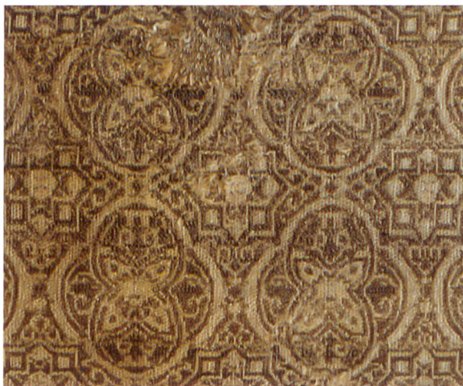
Fig. 6 Manifattura ispano-moresca, Frammento di tunica di Don Felipe di Castiglia, seconda metà XIII secolo, Riggisberg, Abegg-Stiftung.

Altra tipologia tessile degna di nota di cui sopravvivono pochi esempi affrescati e ancora meno reperti serici è quella ornata dall'iterazione di lettere dell'alfabeto. Fondamentali a questo riguardo sono le ricerche condotte da Jean-Pierre Jourdan, che ha evidenziato come all'aspetto grafico-ornamentale dei caratteri alfabetici sia indissolubilmente associato un valore semantico attribuitogli dalla società del tempo. 22 Questi ornamenti criptici, basati su giochi fonetici e associazioni mentali elaborati per essere indirizzati a persone colte e istruite in grado di coglierne la portata simbolica, nel corso degli anni finirono probabilmente per assumere una mera connotazione decorativa, scevra di qualsiasi significato, quando destinati alla visione da parte di individui incapaci di decifrare le singole lettere dell'alfabeto. In area ticinese personaggi sacri che indossano tessuti punteggiati da segni alfabetici si rintracciano in pitture murali datate tra l'ultimo quarto del Trecento e gli inizi del Quattrocento, anni in cui le stoffe con questo partito ornamentale furono par-