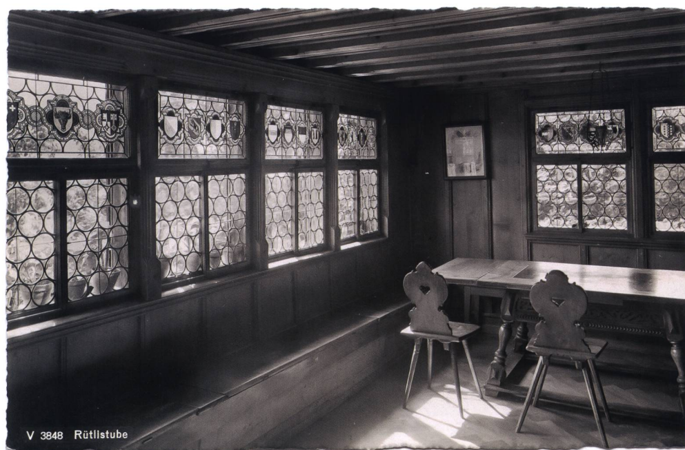
V 3848 Rütlistube