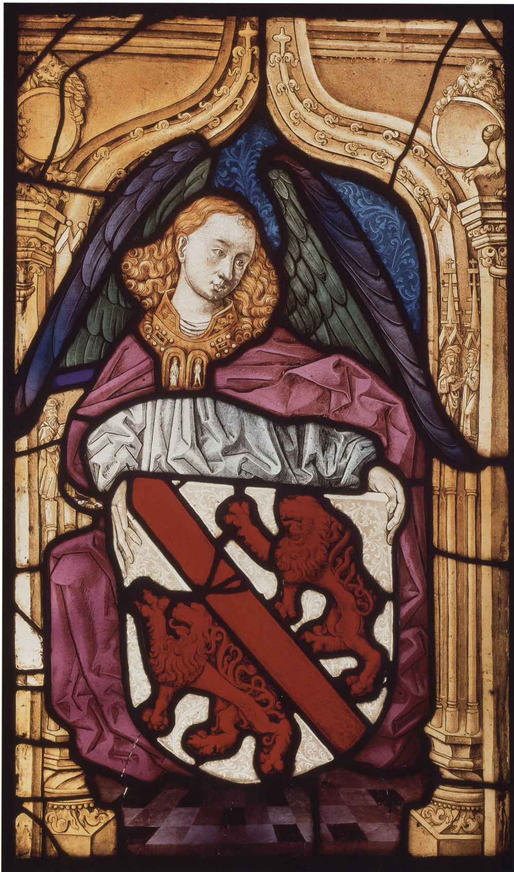
Abb. 12 Stadtscheibe von Winterthur, um 1493, Herkunft Wallfahrtskirche St. Anna, Veltheim bei Winterthur. Farbige Gläser bemalt, 77 × 46,2 cm. Schweizerisches Nationalmuseum, LM 4698.