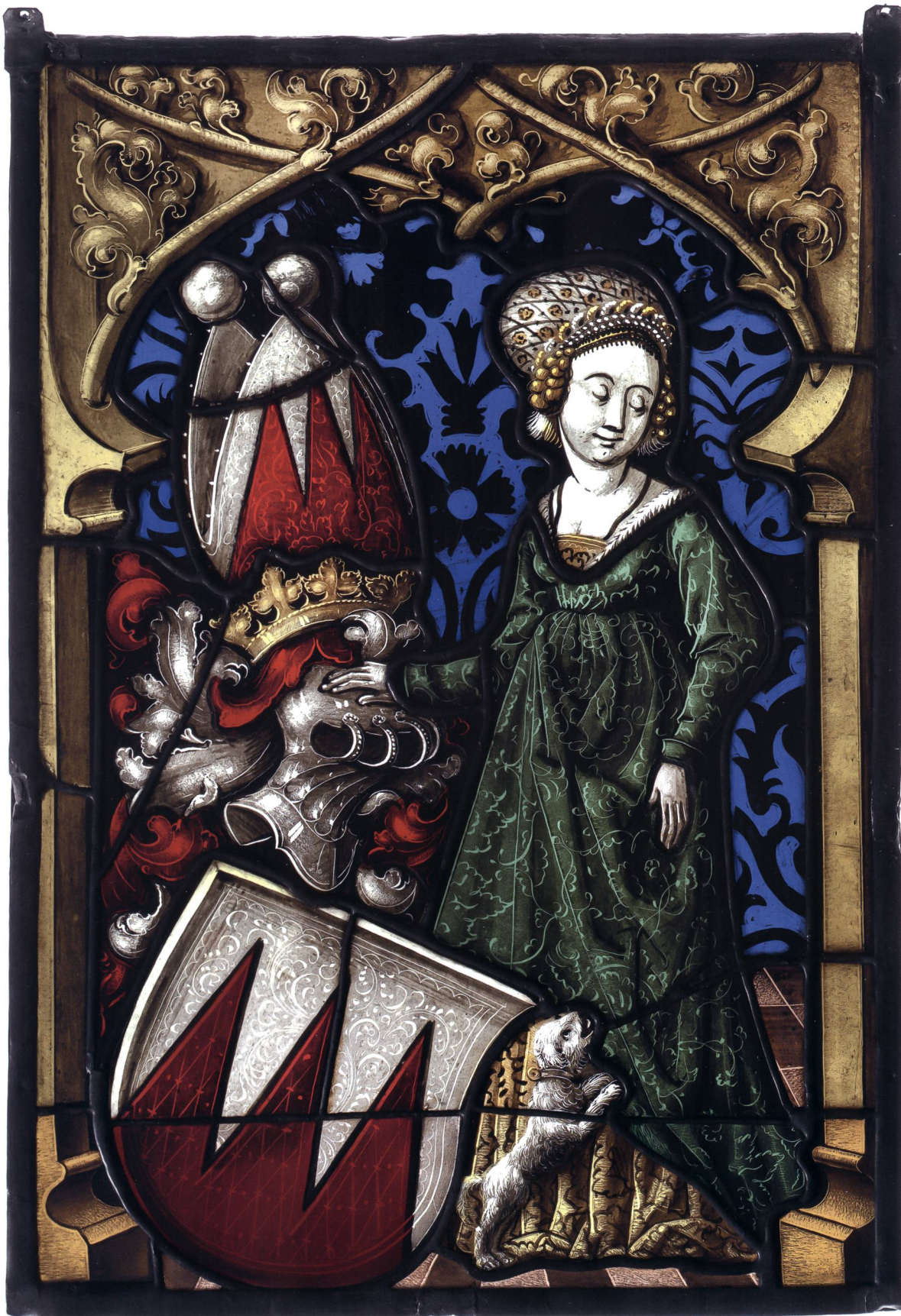
Abb. 14 Wappenscheibe der Grafen von Sulz, um 1500, ehemals im Arbeitszimmer von Johann Rudolf Rahn, Talacker, Zürich. Farbige Gläser bemalt, 36 × 24,8 cm. Schweizerisches Nationalmuseum, LM 12807.