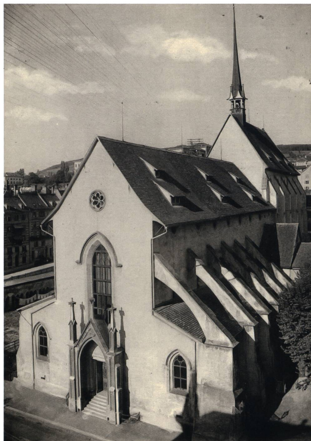
Abb. 1 Blick auf die Predigerkirche und die verbliebenen Erdgeschosssteile des Kreuzgang-Nordflügels (Arkaden mit Wäscheleine) vor dem Abbruch im November 1892.

serklosters in Zürich, konnten für das Museum gesichert und hier einer Zweitverwendung zugeführt werden. Nachdem die um 1833/34 zu einem Theater umgebaute Klosterkirche 1890 einem Brand zum Opfer gefallen war, wurden von den zwölf ausgebauten Masswerkfenstern neun für das Landesmuseum reserviert (cf. Abb. 2 und 3 Beitrag Gutbrod, S. 117), wo sie zusammen mit den Doppelsäulenarkaden aus dem Kreuzgang des Predigerklosters, der 1887 ebenfalls ein Raub der Flammen geworden war (Abb. 1), einen Kreuzgang aus historischen