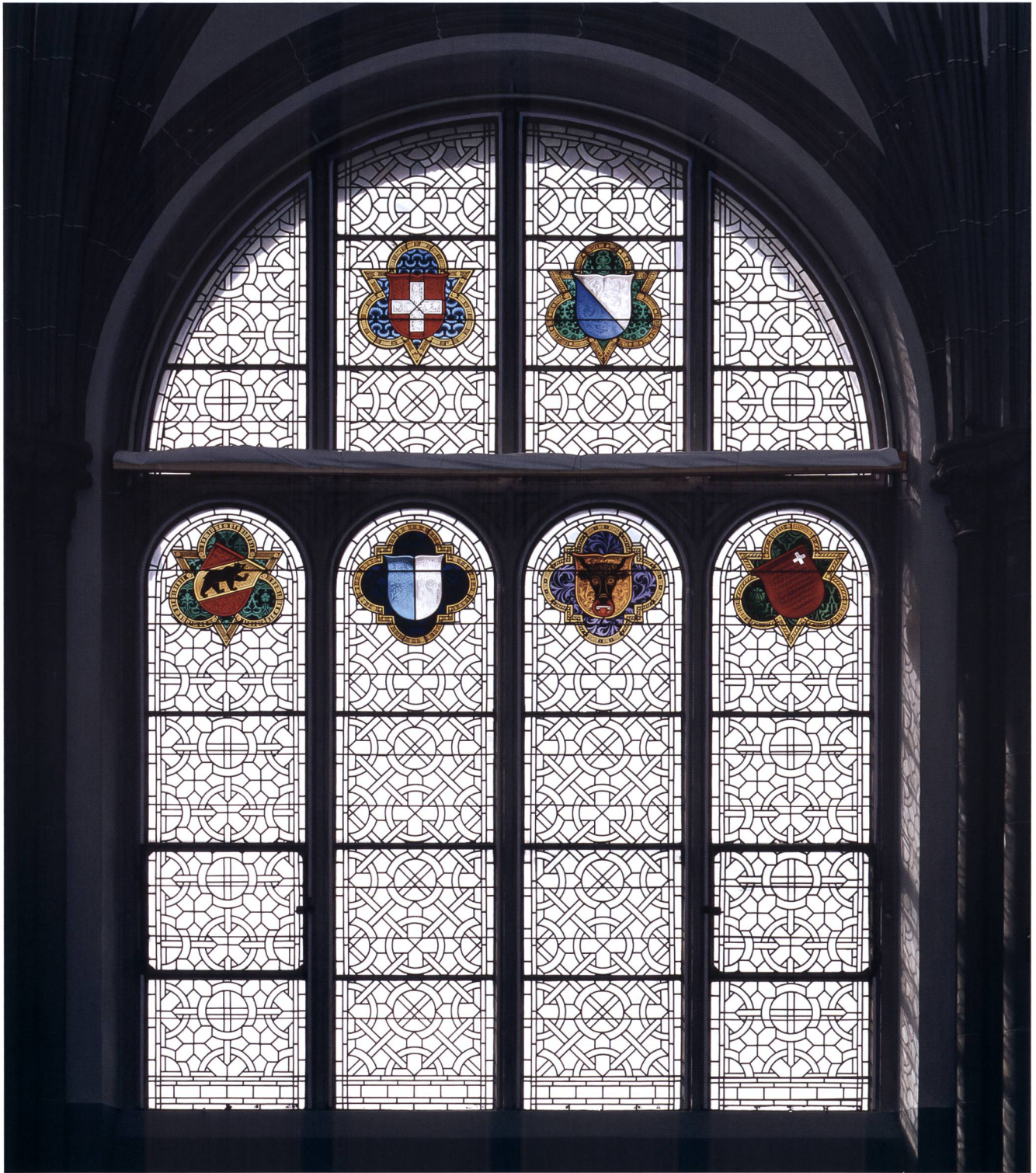
Abb. 9 Südliches Mittelfenster in der Ruhmeshalle im Landesmuseum Zürich, Wappen der Schweiz, von Zürich, Bern, Luzern, Uri und Schwyz, Entwurf Alois Balmer, diverse Glasmaler, 1896/97. Schweizerisches Nationalmuseum, DIG 5086.