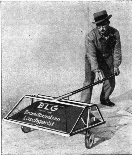
(Obige Illustration ist durch Herrn A. Füllemann, Goldau a. Rigi, in freundlicher Weise zur Verfügung gestellt worden.)

ohne weitem Schaden anzurichten, vollständig abbrennen kann. — Eine Beschreibung dieses Gerätes findet sich im April-Heft 1935 der «Protar».