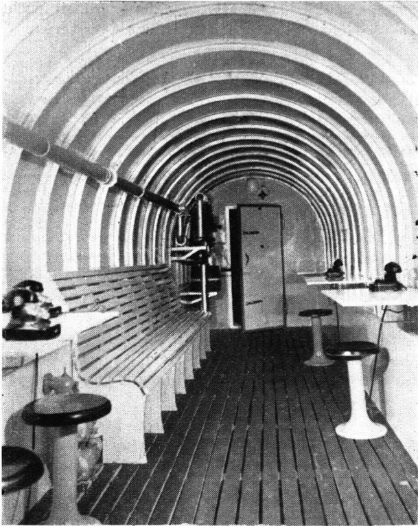
Innenansicht eines Schutzraumes, welcher als Befehlsstand einer Luftschutztruppe dient. — Hinten links: Filter mit Raumbelüftungsanlage.

die besondere Verstärkung des Dachsattels und nimmt Geschossen die volle Auftrefffläche. Die rahmenartige Konstruktion weist ausserdem gegenüber Deckungen mit festen Auflagern derart günstige Momente auf, dass dieselben bei entsprechenden Berechnungen berücksichtigt werden müssen.