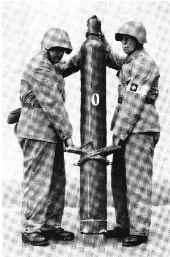
Abb. 2. Transport bei aufgestellter Flasche.

Die Zange kann in jeder beliebigen Höhe angesetzt werden, je nach der Grösse der Träger. Gewicht der Zange zirka 4 kg. Preis Fr. 12.—.