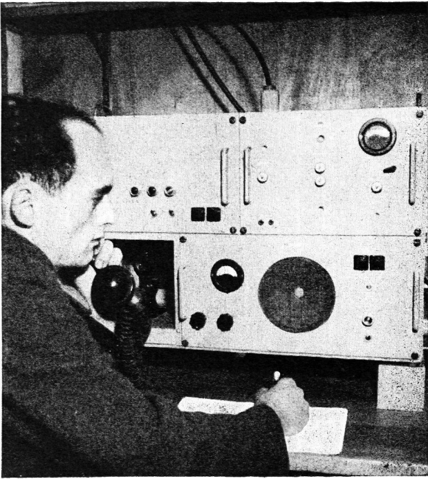
Abb. 1 UKW-Gerät (Leitstation)

würden. Da deshalb direkt im Klartext gesendet werden kann, werden Fehlerquellen und Verzögerungen durch Chiffrieren vermieden.