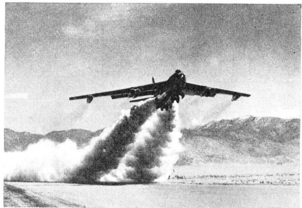
BOEING B.47 «STRATOJET»

Mit Rücksicht auf den dünnen, elastischen Flügel weist diese Type ein Tandemfahrwerk auf, das in den Rumpf eingezogen wird. Die Besatzung einer Stratojet besteht aus dem Piloten, dem Hilfspiloten und dem Navigator. Letzterer übt zugleich die Funktionen eines Bombenschützen aus.