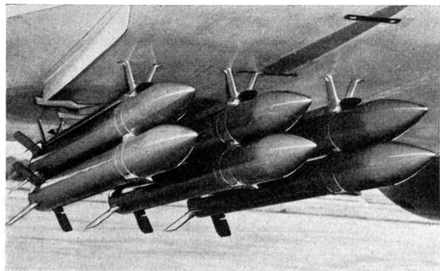
Der DRAKEN mit 12 Bofors-Raketen des Kalibers 13,5 cm bewaffnet. Unter jedem Flügel sind je sechs solcher «Air-to-ground»-Raketengeschosse, d. h. Luft/Boden-Angriffsraketen angebracht. Mit andern Worten: Der DRAKEN mit Erdkampfbewaffnung.

Werkbesuch bot sich Gelegenheit, die modernen Anlagen der schwedischen SAAB-Werke eingehend zu besichtigen, wobei auch ein Augenschein der vorbildlich eingerichteten Untergrund-Fabrikationsanlagen miteinbezogen war. Dieser Werkbesuch, die neuzeitlichen Fertigungsmethoden sowie zwei Flugdemonstrationen des neuesten SAAB-Baumusters J-35 «Draken» hinterliessen denn auch einen vorzüglichen Eindruck.