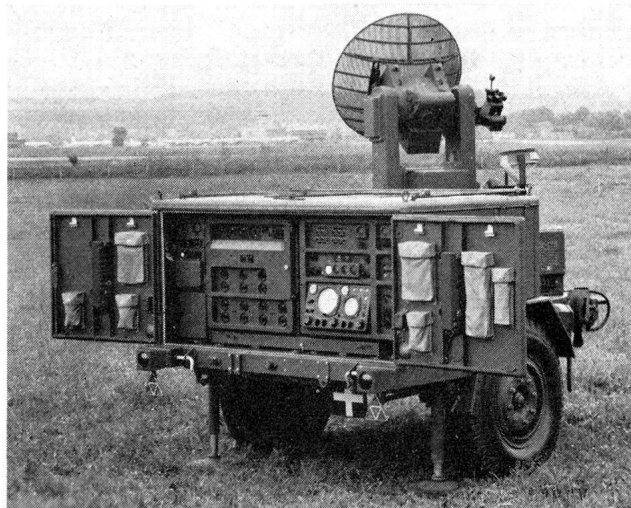
Das Feuerleitgerät zum 35-mm-Flabgeschütz. Hauptelemente: Richtgerät, Radar-Anzeigegerät, Rechenggerät, Fahrwerk.

vorgeführt. Auch in dieser Konstruktion ist eine Anzahl einzigartiger technischer Neuerungen enthalten. Auf den ersten Blick fällt der erstaunlich rasche Stellungsbezug, die minimale Bedienungsmannschaft und die rasche Feuerbereitschaft nach Erfassen des Zieles durch die Radaranlage auf. Die Batterie besteht aus der Radaranlage, dem elektronisch gesteuerten Auswertgerät und zwei Zwillingsflabkanonen, Kaliber 35 mm. Dazu kommt die Stromversorgungsanlage; doch ist auch Netzanschluss möglich. Besonders eindrucksvoll ist das Auswertgerät, auch Feuerleitgerät genannt, welches sekundenschnell die kompliziertesten Berechnungen bewerkstelligt, die Schiesselemente