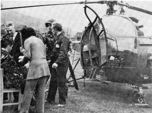
Auslad von Verwundeten aus dem Helikopter und erste Versorgung der Verletzten