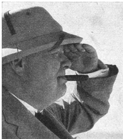
«Der Luftschutz, das Innenministerium und das Gesundheitsministerium befinden sich genau so in der vordersten Linie wie die Panzerkolonnen.»

Das verkündete der in Krieg und Frieden erfolgreiche britische Premierminister Winston Churchill im Dezember 1940. Damals hatten englische Armeen auf dem europäischen Festland die Schlacht von Dünkirchen verloren und in Nordafrika der Bedrohung des für das Königreich lebenswichtigen Suezkanals entgegenzutreten. Trotzdem vermochte gleichzeitig die Bevölkerung Londons und anderer Heimatstädte schwersten deutschen Fliegerbombardementen aus eigener Kraft zu widerstehen. Als weltweiter Seher und Planer erkannte der jetzt zurückgetretene Churchill rechtzeitig die Totalität des modernen Krieges und richtete die Abwehr darnach ein. Wir müssen unsererseits erkennen, dass der Schutz der Zivilbevölkerung in der Schweiz noch bedenklich im Rückstand ist. Der Aufbau eines nach den Kriegserfahrungen wirksamen Zivilschutzes ist daher für alle das Gebot der Stunde!