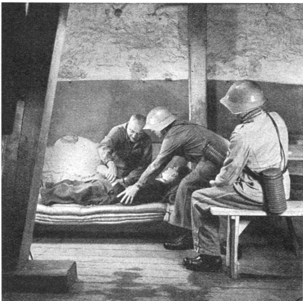
Pflege eines Verletzten

Nachbarhaus, während die Kriegsfeuerwehr im Innenangriff den Brandherd angeht. Die Hauswehren können aber auch zur Bekämpfung des Flugfeuers eingesetzt werden. Entsteht im übrigen in der Löschaktion der Kriegsfeuerwehr vorübergehend ein Unterbruch, z. B. durch den Ausfall einer Motorspritze, so können es wieder zusammengefasste Mittel der Hauswehren sein, welche bis zum erneuten Angriff der Kriegsfeuerwehr das Feuer so lange an der Weiterausbreitung hindern.