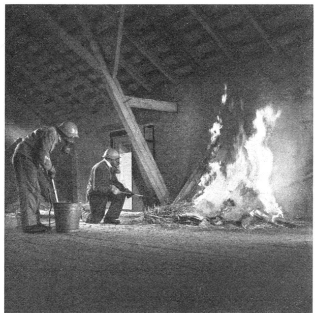
Erfolgreiche Schadenbekämpfung mit Eimerspritze und Feuerhaken