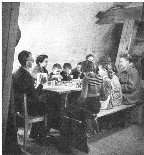
Ablenkende Beschäftigung ist wichtig

Allfällige Regionsinstruktoren sind die Gehilfen der Kantonsinstruktoren. Sie leiten und beaufsichtigen nach Weisung des Kantons die Organisation und Ausbildung der Hauswehren in der betreffenden Region.