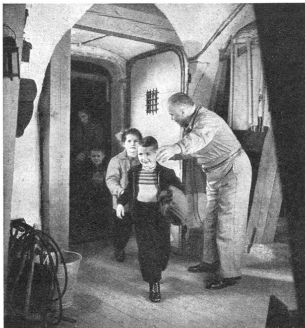
Die Hausinsassen gehen in den Schutzraum

An der Spitze der Organisation der Hauswehren steht in der Ortschaft der Dienstchef. In grösseren Ortschaften mit mehr als 3000 Einwohnern wird zudem auf je 2000—4000 Einwohner als Zwischenglied ein