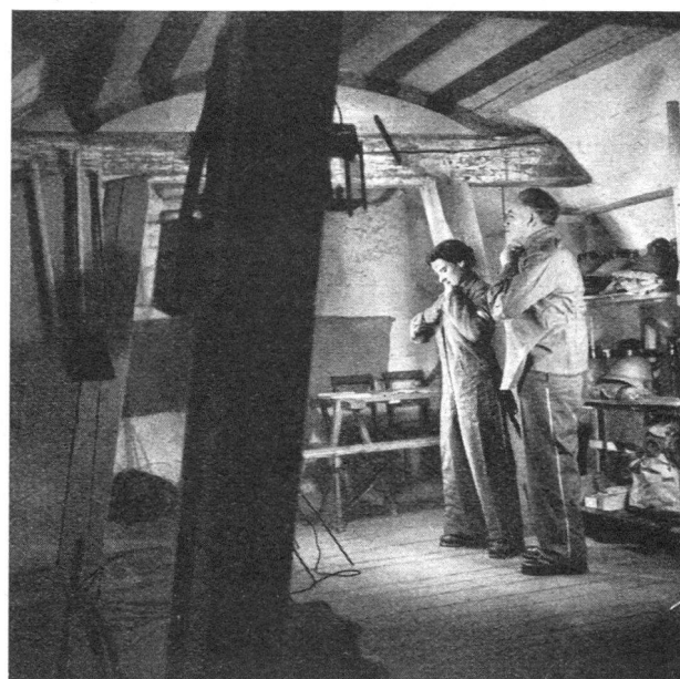
Bei Fliegeralarm bezieht die Hauswehr ihren Posten

Bei der Bombardierung von Basel am 4. März 1945 wurden 79 Häuser von Brandbomben getroffen, viele davon gleich von mehreren. In 61 Fällen konnten die Entstehungsbrände von den Hausfeuerwehren gelöscht werden, trotzdem diese Organisation zu dieser Zeit nicht auf Pikett gestellt war.