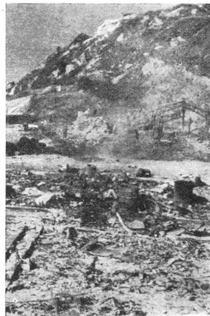
Was von einem Materiallager nach einem kommunistischen Angriff übriggeblieben ist.