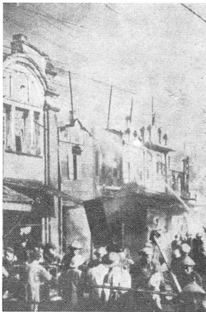
Ein Luftangriff der Nationalchinesen hat in der Hafenstadt Futschau erheblichen Schaden angerichtet.