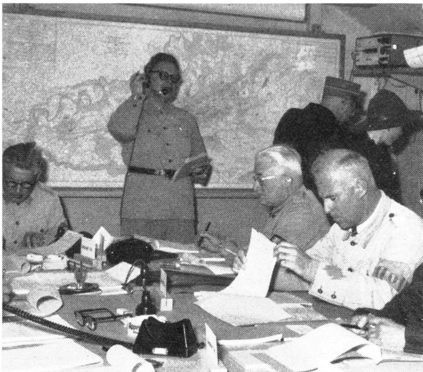
Blick in den Kommandoposten des Ortschefs in St. Gallen, wo schwerwiegende Entschlüsse gefasst werden mussten.

Für den Zivilschutz besteht kein eigener Verfassungsartikel. Der Dienst im Zivilschutz, Schutzorganisationen