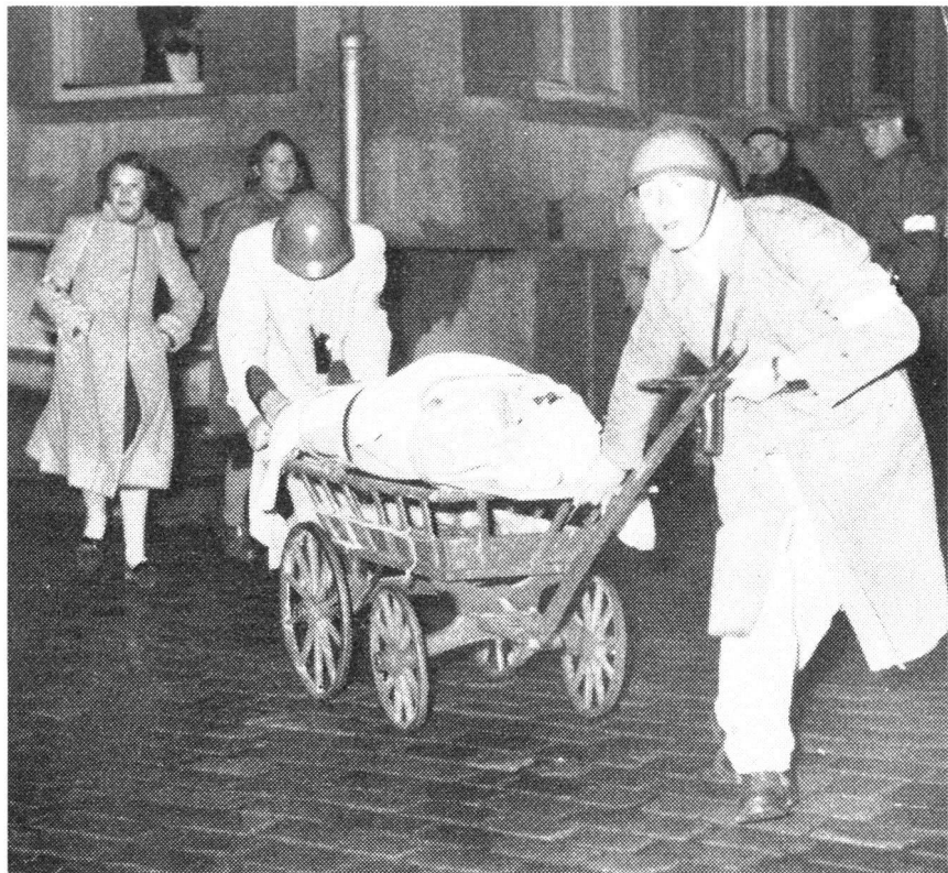
Zum Abtransport von Verwundeten sind oft Behelfsmittel nötig.

wegen übertragene Aufgabe zugunsten des Armeesanitätsdienstes müssen wir uns ernstlich fragen, ob das Schweizerische Rote Kreuz mit samt seinen Hilfsorganisationen heute überhaupt in der Lage ist, eine neue grosse Aufgabe zu übernehmen, wie sie die aktive Mitarbeit am Sanitätsdienst des im Aufbau begriffenen Zivilschutzes, dem sog. Kriegssanitätsdienst, darstellt.