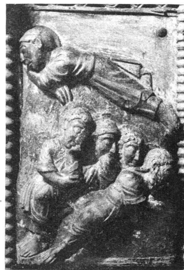
Die Erlösung von der Angst durch die Angst des Erlösers Köln, St. Maria im Capitol (1065).