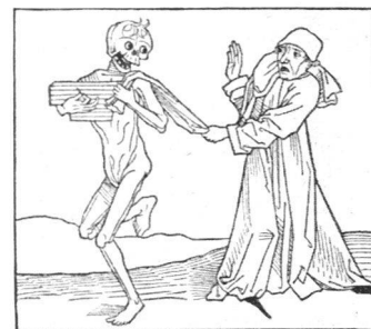
Die letzte Stunde Holzschnitt (um 1490): Der Tod und der Gelehrte.

Zwecke genutzt werden kann, lässt keinen rechten Jubel über unsere Zukunftsaussichten aufkommen. Natürlich ist es nicht so, dass es uns schlechter ginge, als unseren Vorfahren. Die Furcht ist über Jahrtausende hinweg und durch alle Generationen ständiger Begleiter der menschlichen Existenz gewesen und wird es wohl auch immer sein. Ob man sich vor einem Atomkrieg oder