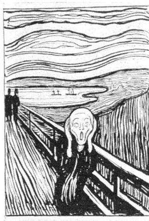
Die blosse Angst E. Munch: Geschrei. Lithographie (1895).