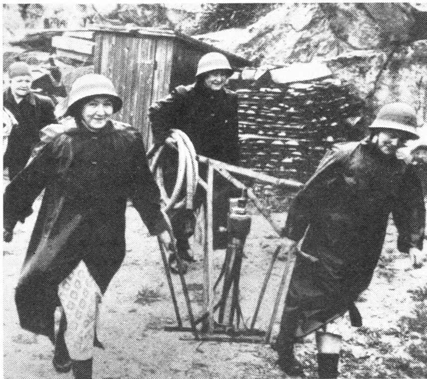
Weibliche Feuerwehr in Schweden

Zur handlichen Notausstattung gehören Kleinkleinradio, Reiseapotheke und Taschenlampe.