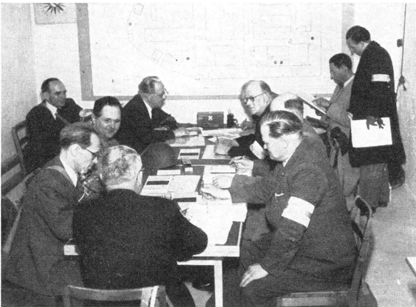
Kommandoposten eines Industriebetriebes

Auf dem Kommandoposten der Werkschutzleitung eines grösseren Industriebetriebes in Schweden. Die Karte an der Wand lässt die Grösse des Betriebes erkennen. Dem Betriebsschutzleiter stehen die Chefs der einzelnen Dienstzweige zur Seite, die bereits im Frieden in Manövern und Planübungen in ihre wichtige Aufgabe eingeführt werden.