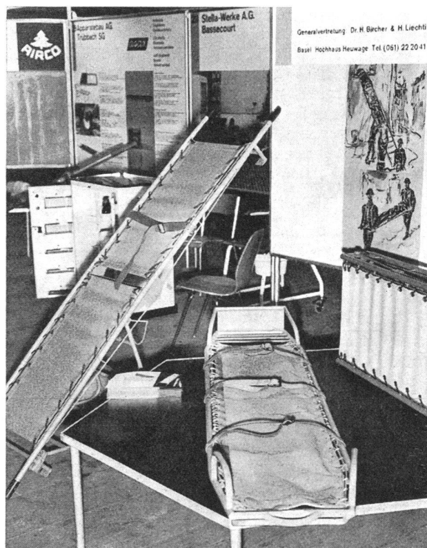
Blick in mehrere Firmenstände