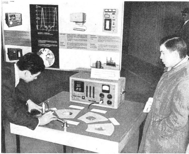
Messgeräte für radioaktive Strahlung