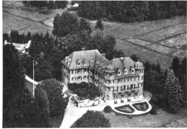
In Tutzing am Starnbergersee (Bayern) liegt eine der neun Landes-Luftschuttschulen des Bundesluftschutzverbandes, die wertvolle zentrale Ausbildungsstätten des Zivilschutzes sind und nach einheitlichen Richtlinien aufklären und ausbilden. Die Lage dieser Schulen, wie zum Beispiel Tutzing, trägt viel dazu bei, dass sich die Kursteilnehmer auch als Menschen näherkommen und damit willkommene Gelegenheiten erhalten, sich gründlich über diese Probleme auszusprechen.